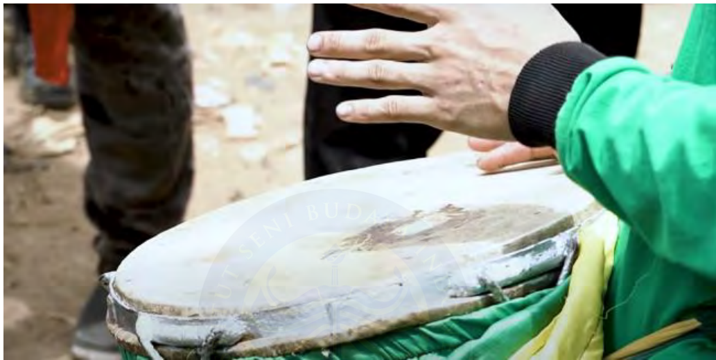
Gambar 4.2 Alat Musik yang digunakan saat Pertunjukan

musik Bangbung Hideung menjadi lebih kontemporer dan "urban," sehingga daya tariknya lebih luas. Penggunaan instrumen modern ini menghilangkan suasana sakral dan menggantinya dengan energi yang lebih ringan dan profan, yang cocok dengan selera audiens masa kini.