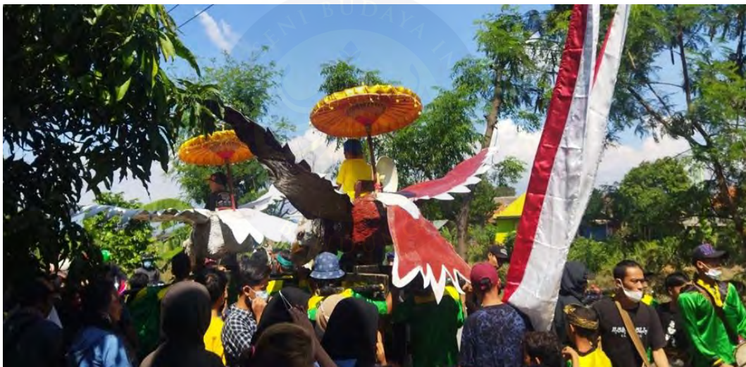
Gambar 4.1 Pertunjukan Reak

Namun saat ini, Bangbung Hideung seringkali dinyanyikan dalam acara-acara budaya yang tidak memiliki kaitan spiritual, seperti di panggung musik, festival budaya, atau acara hiburan. Pergeseran tempat ini mengubah suasana lagu, menjadikannya lebih santai dan lebih fokus pada nilai estetis daripada spiritual. Tempat yang sekuler dan berorientasi pada hiburan ini menghilangkan aura sakral dan 1 menjadikannya sekadar ekspresi seni budaya.