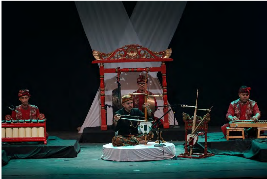
Gambar 16. Pelaksanaan 2