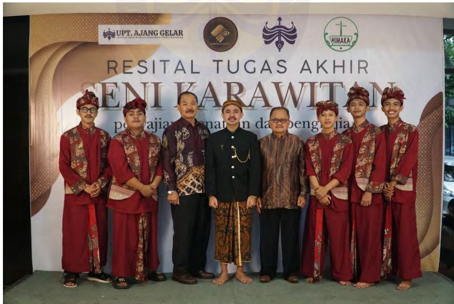
Gambar 19. Foto Bersama