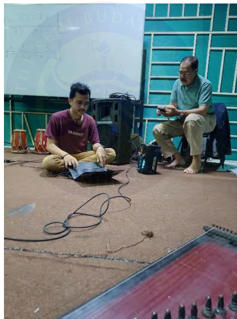
Gambar 10. Revisi Pemb.1