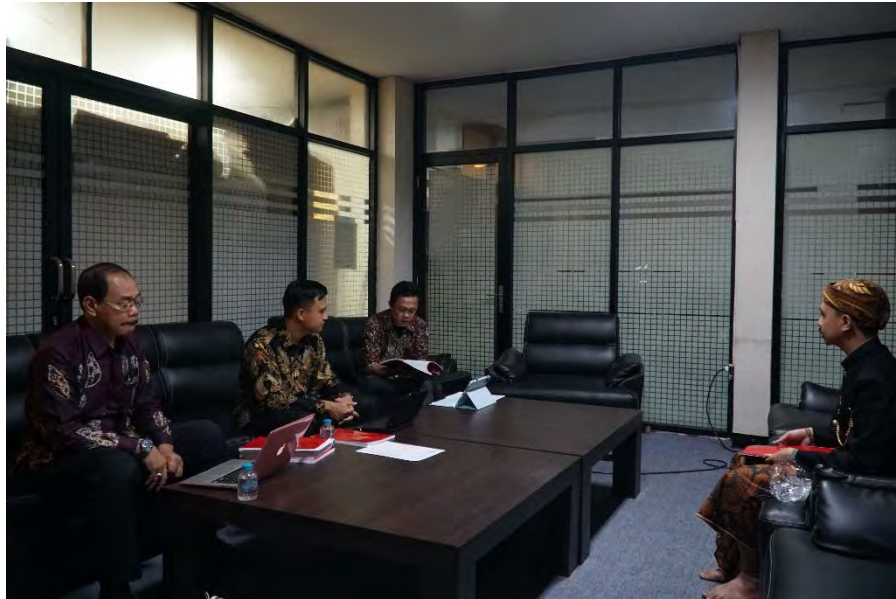
Gambar 18. Sidang Komprehensif