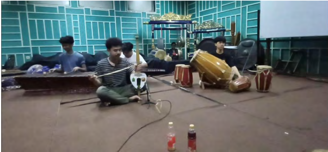
Gambar 11. Proses Latihan