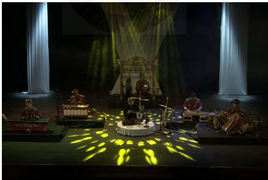
Gambar 15. Pelaksanaan 1