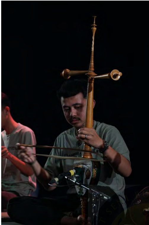
Gambar 13. Gladi 2