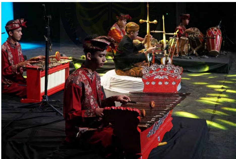
Gambar 17. Pelaksanaan 3