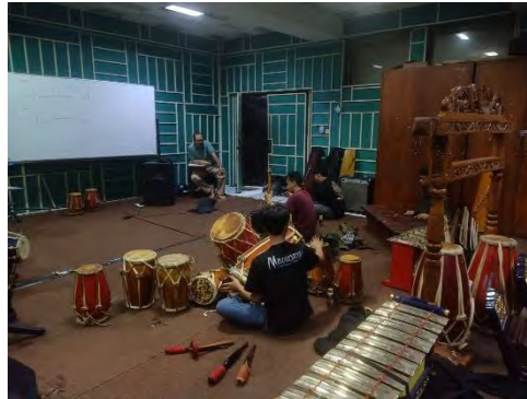
Gambar 9. Bimbingan Karya