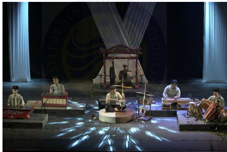
Gambar 12. Gladi 1