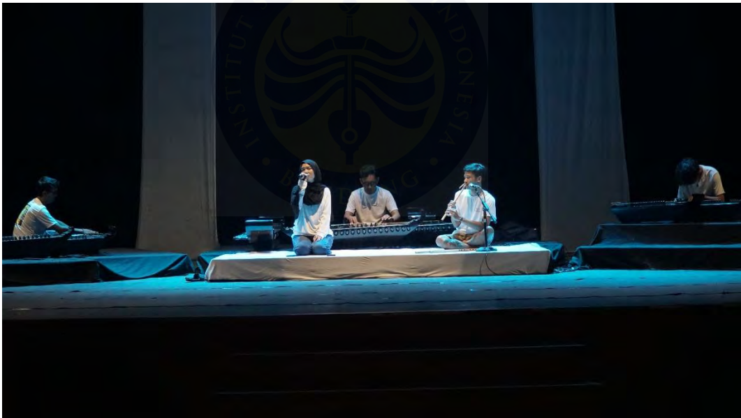
Pelaksanaan gladi bersih 1 dokumentasi panitia