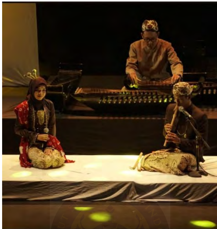
Pelaksanaan Tugas Akhir 1 dokumentasi panitia