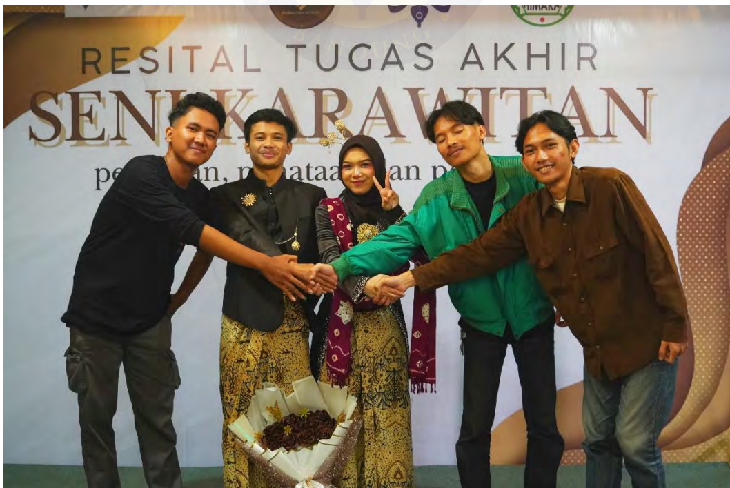
Foto bersama Teman 1 dokumentasi pribadi