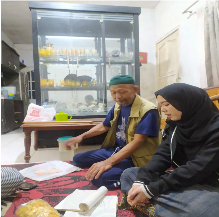
Proses Latihan 3