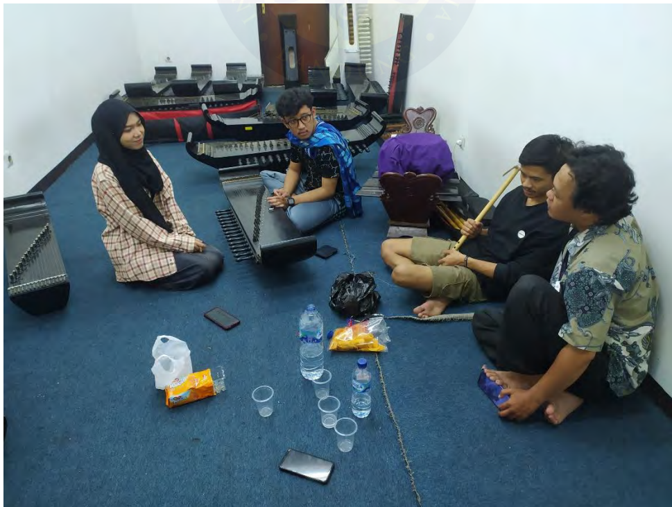
Proses Latihan 4 dokumentasi pribadi