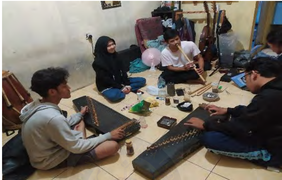
Proses Latihan 1 dokumentasi pribadi