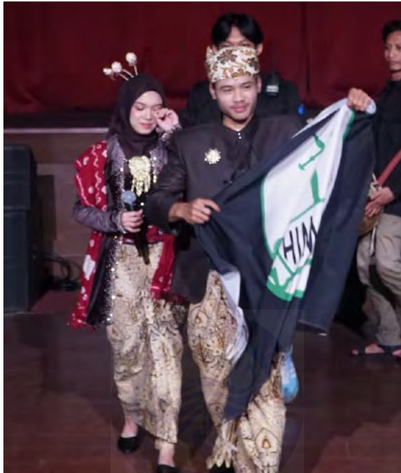
Pelaksanaan Tugas Akhir 3 dokumentasi panitia