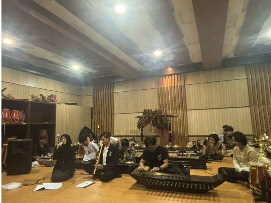
Pelaksanaan sidang Kolokium 1 dokumentasi pribai