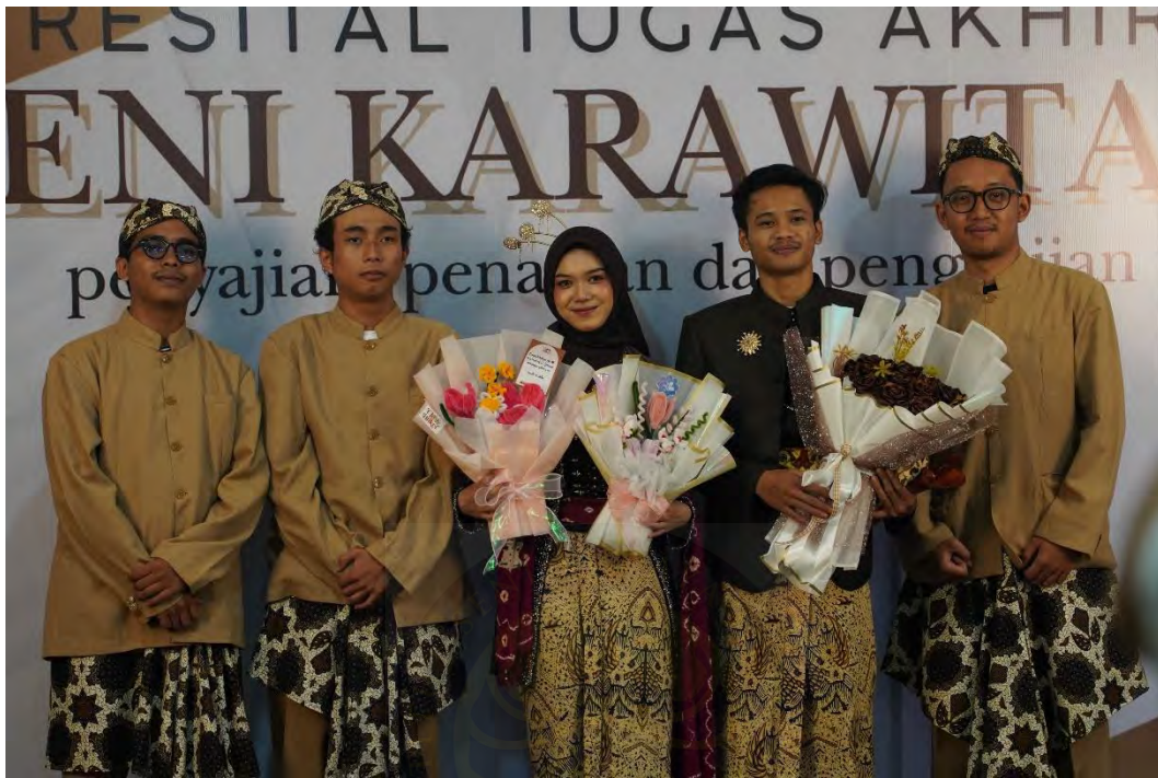
Foto bersama pendukung 1 dokumentasi pribadi