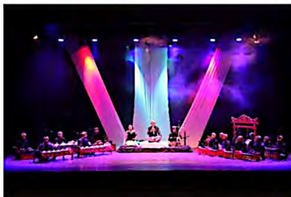
Lampiran 5 Foto Pelaksanaan Tugas Akhir (Dokumen: Koleksi HIMAKA , Desember 2025)