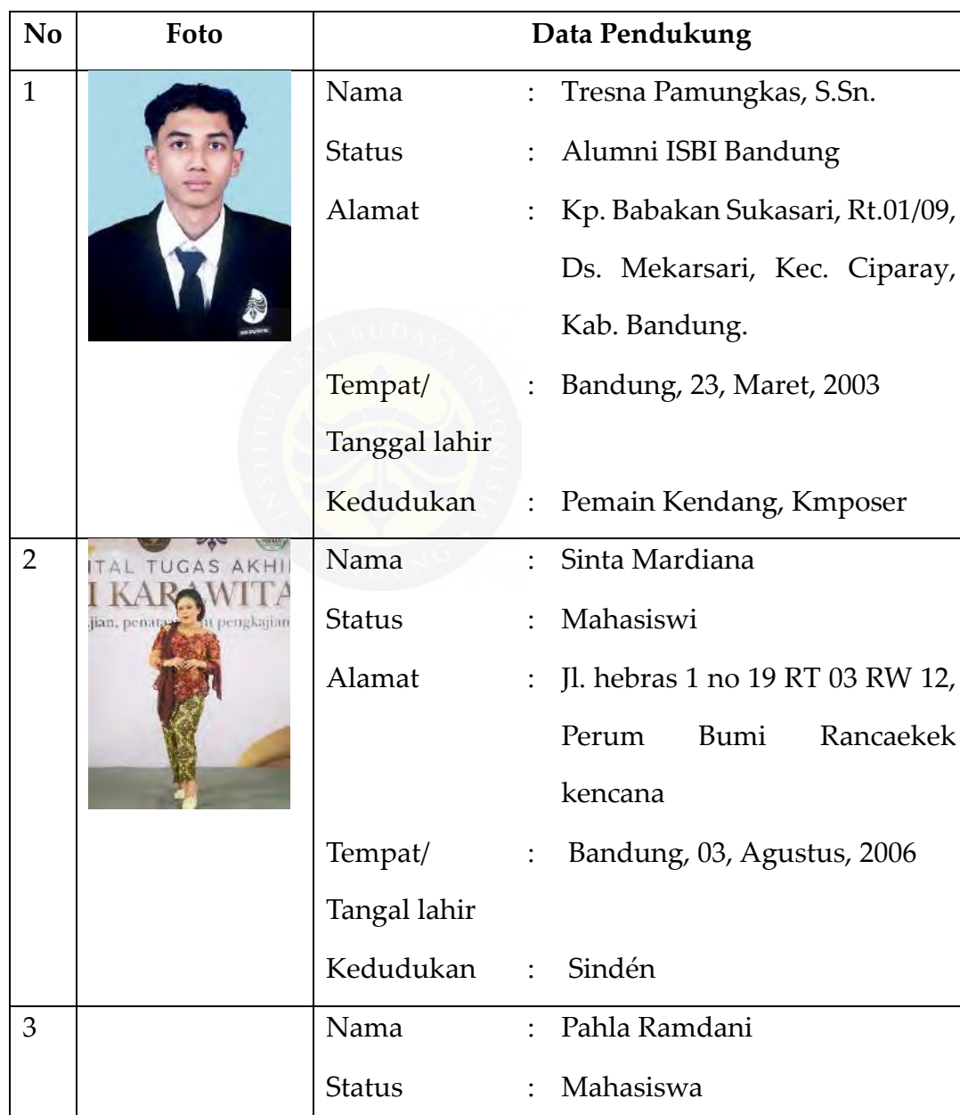
Tabel . 4 Personil Pendukung Karya Seni

rekan dan kedabat penyaji yang turut serta dalam karya ini, berikut merupakan pendukung yang terlibat penyajian karya ini: