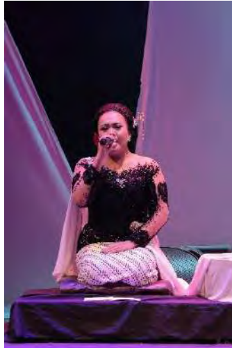
Gambar 3. 4 Kostum sinden