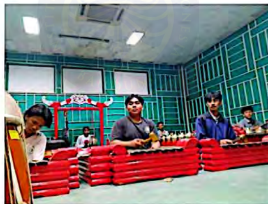
Lampiran 2 Foto Proses Latihan