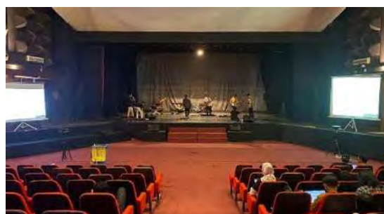
Gambar 3. 1 Ilustrasi Gedung Pertunjukan Sunan Ambu

Karya yang berjudul " Panyelang Haleuang Sindén " ini disajikan digedung pertunjukan "Sunan Ambu" ISBI Bandung, dengan bentuk panggung prosenium. Tentunya panggung ini sangat cocok untuk sajian yang dikemas oleh penyaji.