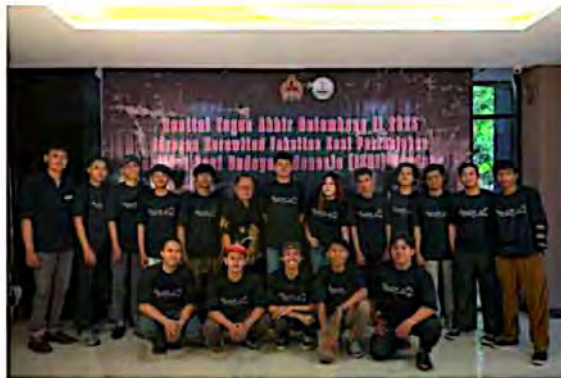
Lampiran 4 Foto Dengan Pendukung Saat Gladi Bersih (Dokumen: Koleksi HIMAKA , Desember 2025)