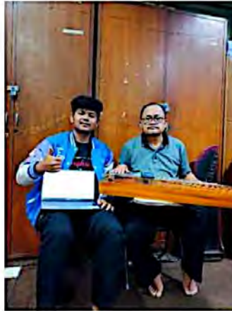
Lampiran 1 Foto Bimbingan tulisan bersama Pembimbing 1