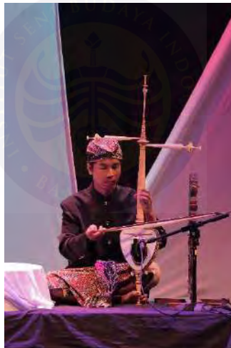
Gambar 3. 5 Kostum Pendukung