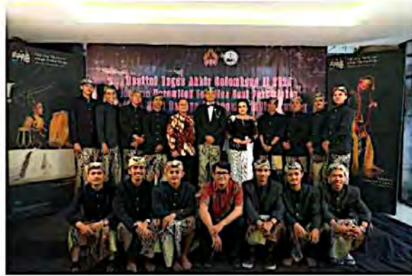
Lampiran 6 Foto Bersama Pendukung dan Pembimbing 1 dan 2 saat Pelaksanaan Tugas Akhir

(Dokumen: Koleksi HIMAKA , Desember 2025)