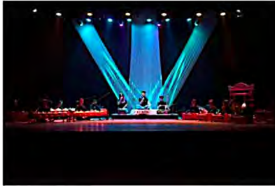
Lampiran 3 Foto Gladi Bersih pelaksanaan Tugas Akhir (Dokumen: Koleksi HIMAKA , Desember 2025)