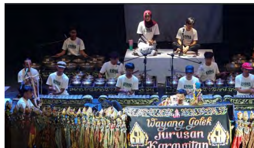
Lampiran 4. 5 Foto Gladi Bersih pelaksanaan Tugas Akhir (Dokumen: Koleksi HIMAKA , Mei 2025)