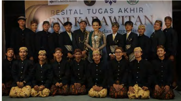
Lampiran 4. 8 Foto Bersama Pendukung saat Pelaksanaan Tugas Akhir (Dokumen: Koleksi HIMAKA , Mei 2025)