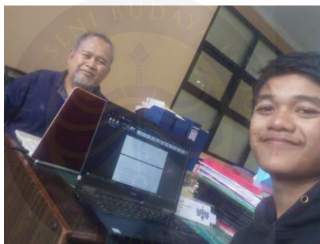
Lampiran 4. 2 Foto Bimbingan Tulisan Bersama Pembimbing 2 (Dokumen: Koleksi Syahdan , April 2025)