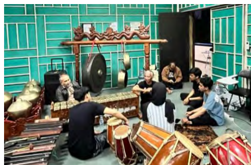
Lampiran 4. 3Foto Bimbingan Karya Bersama Pembimbing 1 dan 2 (Dokumen: Koleksi Kenzio , April 2025)