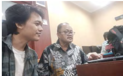
Lampiran 4. 1 Foto Bimbingan Tulisan Bersama Pembimbing 1