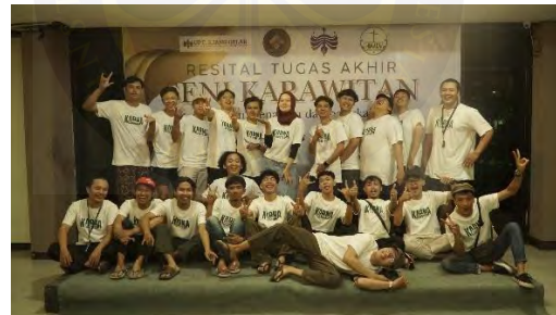
Lampiran 4. 6 Foto Dengan Pendukung Saat Gladi Bersih