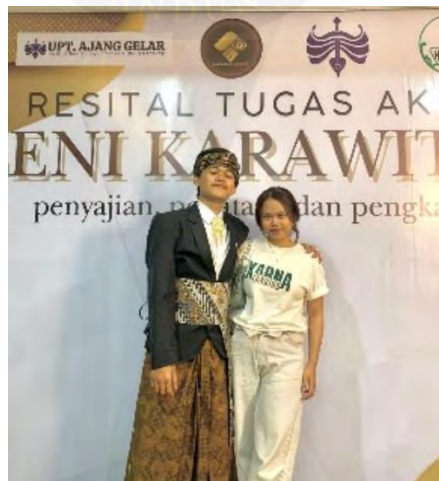
Lampiran 4. 10 Foto Penyaji Dengan Pasangan