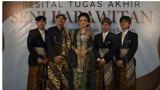
Lampiran 4. 9 Foto Penyaji Sajian "Asmara Laga" (Dokumen: Koleksi HIMAKA , Mei 2025)