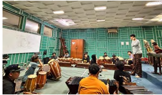
Lampiran 4. 4 Foto Proses Latihan Karya Di ISBI BANDUNG