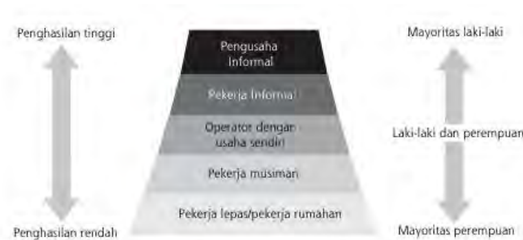
Gambar 2. 1 Segmentasi Ekonomi Informal

kelompok tertentu mendapatkan keuntungan yang lebih besar dibandingkan kelompok lainnya.