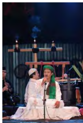
Gambar 04. Kostum Penyaji

Disamping konsep garap, tata letak panggung dan yang lainnya, kostum juga merupakan salah satu aspek pendukung yang sangat penting untuk menambah estetika diatas panggung. Pada sajian ini penyaji menggunakan kostum gamis berwarna putih dan mengenakan peci dan sorban sebagai aksesoris kepala. Adapun para pendukung menggunakan kampret dan pangsi berwarna hitam dan putih, lalu menggunakan peci atau iket sebagai aksesoris kepala.