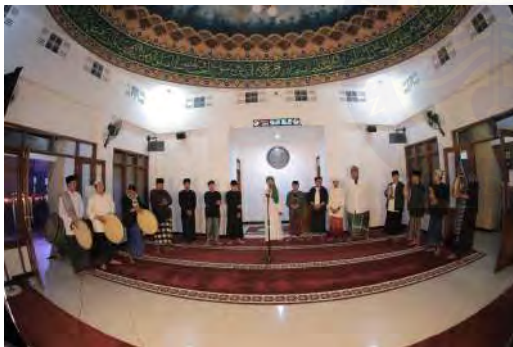
Gambar 01. Masjid ISBI Bandung (Dokumentasi Pusdoksen ISBI Bandung, Desember 2025)

yang penyaji buat, jalur helaran tersebut diawali dari depan masjid ISBI Bandung hingga ke area teater kebon ISBI Bandung. Panggung kedua yaitu bertempat di teater kebon ISBI Bandung yang dimana teater kebon ISBI Bandung ini juga termasuk kedalam kategori panggung arena, yang bentuk panggungnya bisa ditonton dari berbagai macam arah. Kedua desain panggung tersebut tentunya sudah disesuaikan juga dengan konsep garap yang penyaji buat. Adapun bentuk panggung yang digunakan oleh penyaji terlampir dalam gambar dibawah ini.