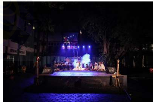
Gambar 02. Panggung Teater kebon ISBI Bandung