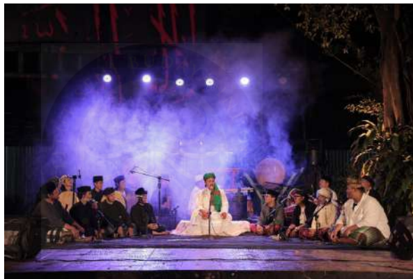
Gambar 03. Layout panggung teater kebon

penyaji berada di posisi depan dan diikuti oleh para pendukung yang berbaris membawa bawa alat musik terebang , dan pada panggung kedua posisi penyaji berada di tengah panggung menggunakan level berbentuk bulat, yang bertujuan agar penonton lebih fokus kepada penyaji. Lalu alat musik pengiring terebang , rebana , kendang , tarompet , dan goong berada diantara kanan dan kiri panggung.