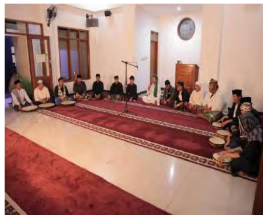
Gambar 05. Kostum Pendukung