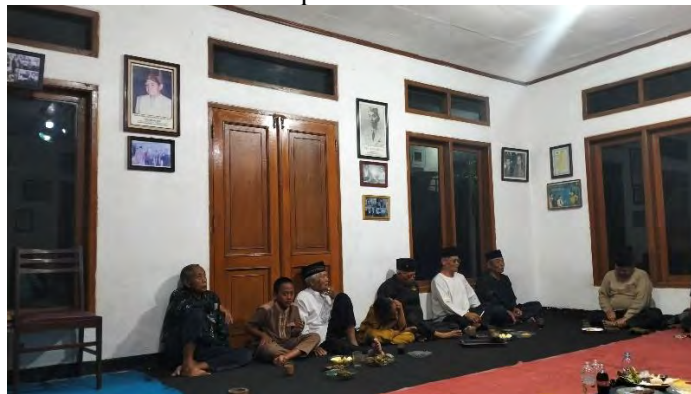
Gambar 4.4 Pelaksanaan Upacara Ritual Pitutor Jumat Kliwon