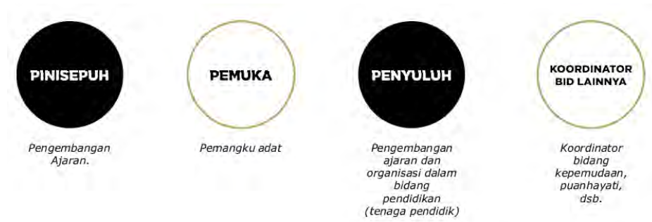
Gambar 4.3 Bagian Kepengurusan Organisasi AKP

(Sumber: Kepengurusan Organisasi Aliran Kebatinan "PERJALANAN")