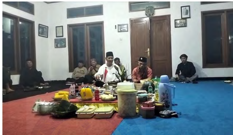
Gambar 4.9 Tahapan Menerangkan Sesaji