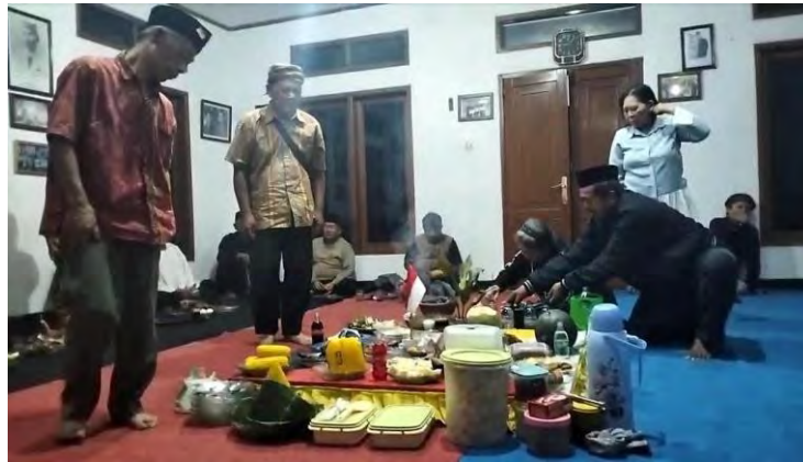
Gambar 4.10 Menikmati Sesaji

(Dokumentasi, Cicy Angraini Merlianita, 2025)