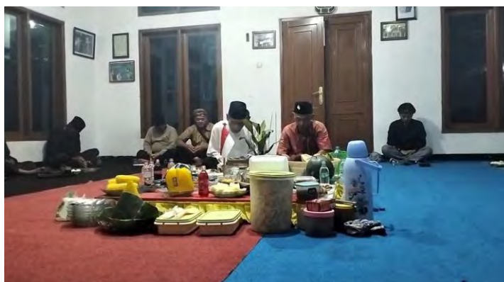
Gambar 4.7 Membakar Kemenyan

(Dokumentasi, Cicy Anggraini Merlianita, 2025)