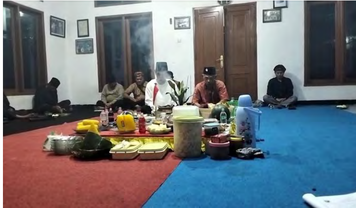
Gambar 4.8 Tahap Mengheningkan Cipta

(Dokumentasi, Cicy Anggraini Merlianita, 2025)