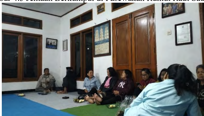
Gambar 4.5 Jemaah Berkumpul di Pasewakan Runtut Raut Sauyunan