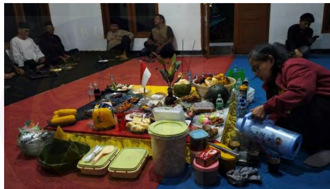
Gambar 4.6 Mempersiapkan Sesaji