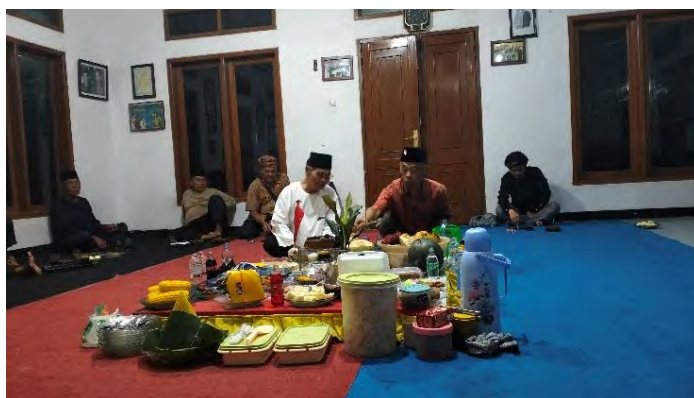
Gambar 4.11 Pemaparan Makna dari Sesajen

(Dokumentasi, Cicy Anggraini Merlianita, 2025)