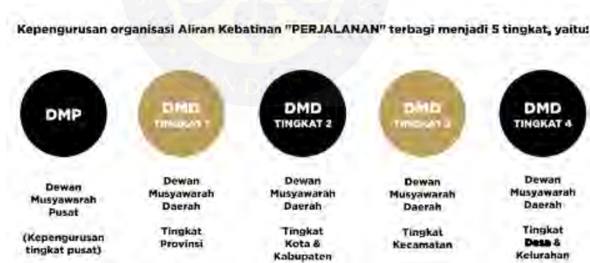
Gambar 4.2 Tingkat Kepengurusan Organisasi AKP