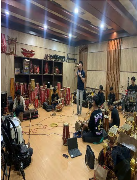
Gambar 3. 3 Foto Proses Latihan