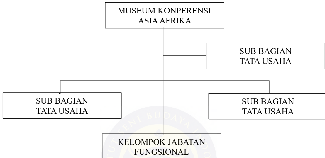
Bagan 4. 1 Struktur Organisasi Museum Konperensi Asia Afrika