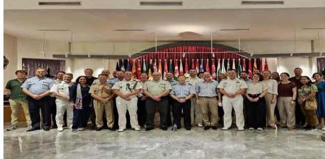
Gambar 4.7 Delegasi Pertahanan dan Kedutaan Besar Belanda

Keberadaan Museum Konferensi Asia Afrika tidak hanya meningkatkan pariwisata sejarah di Indonesia, tetapi juga memperkuat konektivitas global negara ini. Museum ini mendorong pertumbuhan ekonomi Indonesia, khususnya dalam bidang impor dan ekspor. Dengan ekspor dan impor yang semakin stabil, perekonomian negara juga ikut berkembang.