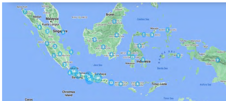
Gambar 4.1 Peta Persebaran Museum.

Berikut ini merupakan peta sebaran museum yang berada di Indonesia pada tahun 2024.