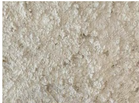
Gambar 4. 2 Tembok dengan teknik kamprot pada bagian sisi Timur

Kondisi Museum KAA sekarang ini beroperasi dengan baik, seperti kelistrikkannya, struktur bangunan yang masih sesuai dengan keasliannya, dan sebagainya masih berjalan dengan baik. Museum KAA di bawah naungan Biro Umum Kementerian Luar Negeri juga melakukan perawatan-perawatan yang dilakukan di museum itu sendiri (Syafira, wawancara pribadi, 15 Mei, 2024). Jadi, untuk perawatan Museum KAA itu sendiri tergantung di mana letak wilayah yang memerlukan perawatan tersebut karena menyesuaikan dengan penanggungjawab pengelolanya juga.