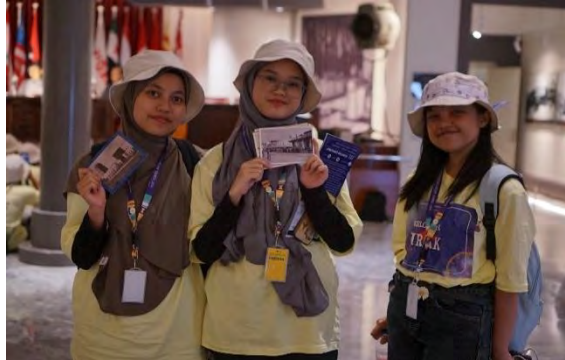
Gambar 4.6 Kegiatan Bandung Historical Studi Games