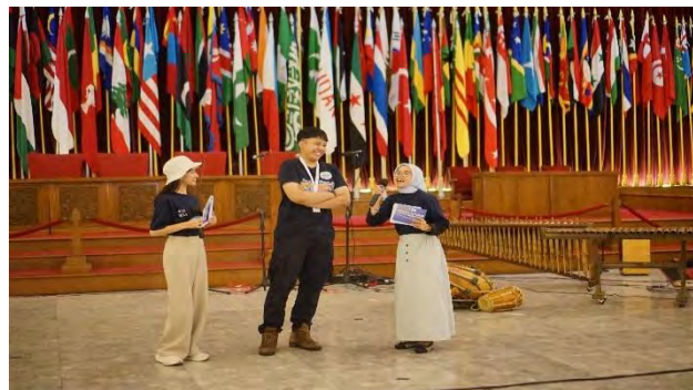
Gambar 4.5 Student conference Bandung Historical Study Game

Salah satu program yang hadir dan sering dipilih sebagai program pendamping peringatan KAA adalah Diskusi Kelompok Terarah. Dalam diskusi ini pihak museum biasanya menyediakan pemantik diskusi terkait Sejarah Konferensi Asia Afrika dan perkembangannya hingga saat ini. Kemudian mengundang siapa saja yang tertarik untuk berdiskusi. Hasil dari diskusi ini juga digunakan pihak museum sebagai referensi dalam pengembangan dan pengelolaan museum KAA. Pada tahun ini diskusi diadakan di aula Gedung Merdeka dan dihadiri oleh sekitar 70 orang yang tertari berdiskusi seputar KAA selama kurang lebih 2-3 jam. Selain dari Diskusi Kelompok Terarah, program pendukung peringatan yang biasa diadakan oleh museum adalah Asia Afrika student conference Bandung Historical Study Games , Senam 3000 anak, parade dan masih banyak lagi. Program ini biasanya berjalan selama seminggu penuh bertepatan dengan pengibaran bendera. Hanya saja pasca Covid-19 pihak museum lebih waspada sehingga kegiatan yang mengundang banyak masa diadakan secara terpisah.