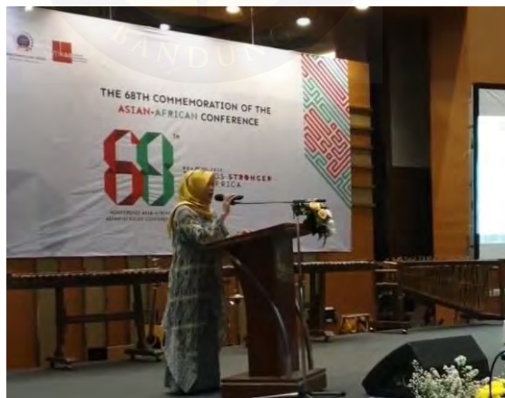
Gambar 4.4 Sambutan Pembukaan Jamuan Teh Petang

Jamuan teh petang merupakan salah satu program rutin museum yang berasal dari rangkaian peringkatan Konferensi Asia Afrika. Pada acara ini biasanya turut mengundang para saksi sejarah, delegasi dari perwakilan kedutaan besar negara luar untuk Indonesia. Jadi bisa dibilang kalau kegiatan ini merupakan jamuan diplomatik juga. Biasanya acara ini tidak dibuka untuk umum, hanya tamu undangan saja yang dapat hadir. Lokasi yang digunakan untuk acara ini berada di dalam Gedung Merdeka, sehingga lebih tertutup dan intim. Selain sebagai rangkaian peringatan Ulang Tahun KAA, jamuan teh petang ini juga difungsikan untuk menjaga hubungan antar negara lain dengan Indonesia, terutama yang sudah menjalin kerjasama terhadap Indonesia.