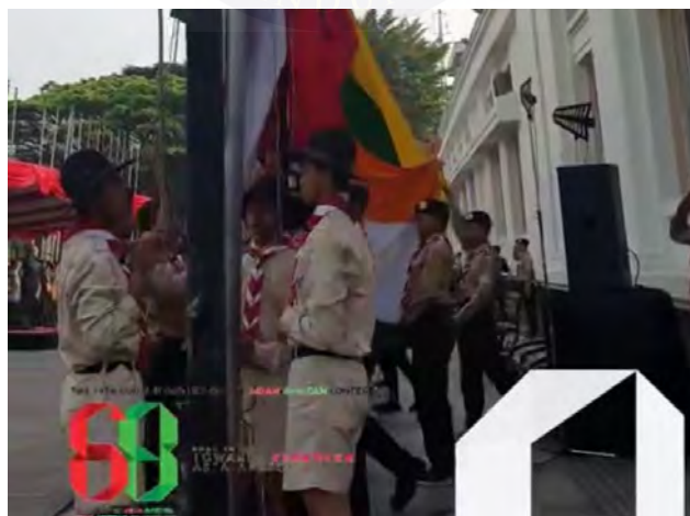
Gambar 4.4 Prosesi Penaikan Bendera

bendera negara peserta Konferensi Asia Afrika yang dilaksanakan oleh Pramuka Kota Bandung. Penaikan bendera menjadi simbol dimulainya rangkaian peringatan yang akan digelar selama 7 hari. Pada hari terakhir yakni pada tanggal 24 akan kembali diadakan penurunan bendera-bendera tersebut sebagai tanda sudah berakhirnya rangkaian peringatan ulang tahun Konferensi Asia Afrika. Program ini digelar untuk umum, jadi tidak hanya pengunjung museum, semua orang yang melintas sekitar Gedung Merdeka dapat menyaksikannya. Namun, sebagian besar warga kota Bandung menjadikan program ini sebagai momentum sejarah yang harus disaksikan sehingga banyak dari mereka sengaja datang untuk menyaksikannya. Hal tersebut bisa ditinjau berlandaskan banyaknya pengunjung yang hadir saat prosesi penaikan dan penurunan bendera hingga membuat padat jalanan.