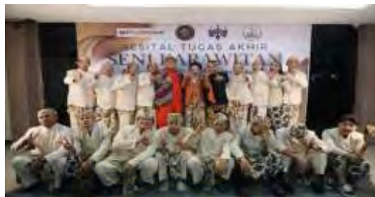
Gambar 4.21. Pelaksanaan Tugas Akhir (Dokumentasi: Panitia HIMAKA, Mei 2025)