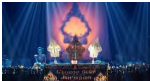
Gambar 4.19. Pelaksanaan Tugas Akhir