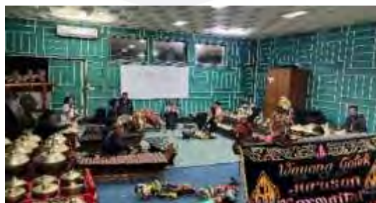
Gambar 4.22. Bimbingan Karya Seni