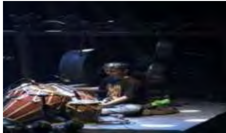
Gambar 4.17. Gladi Bersih