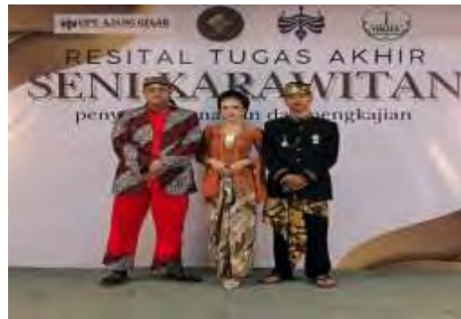
Gambar 4.20. Pelaksanaan Tugas Akhir (Dokumentasi: Panitia HIMAKA, Mei 2025)