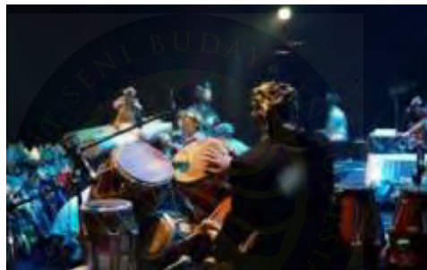
Gambar 4.18. Pelaksanaan Tugas Akhir