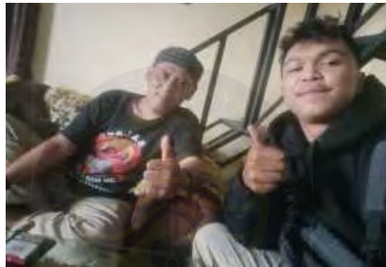
Gambar 4.24. Narasumber