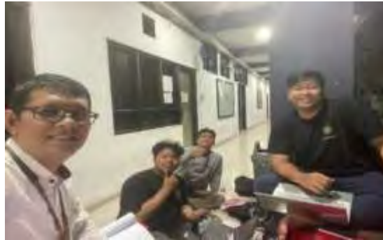
Gambar 4.23. Bimbingan Penulisan (Dokumentasi: Ghany, April 2025)