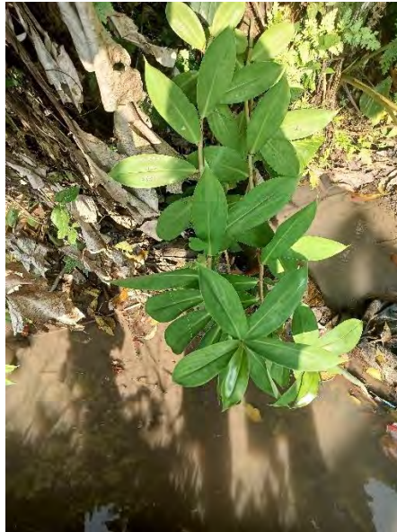
Gambar 4.31 Tanaman Pacing