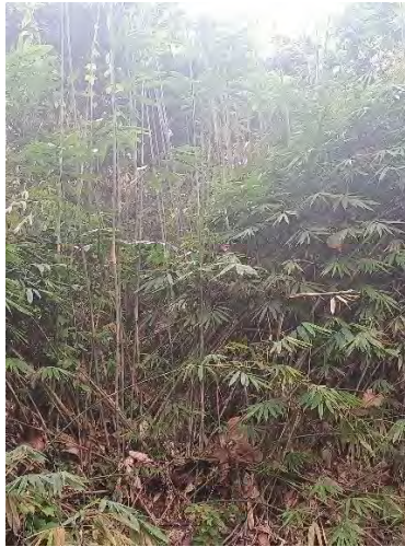
Gambar 4.33 Dapur an Awi Tamiang (Rumpun Bambu Tamiang)