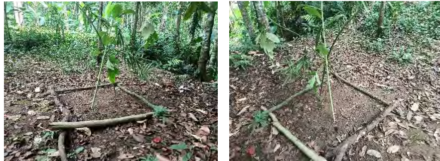
Gambar 4.15 & 4.16 Pungpuhunan sebagai penanda dimulainya menanam Padi Huma