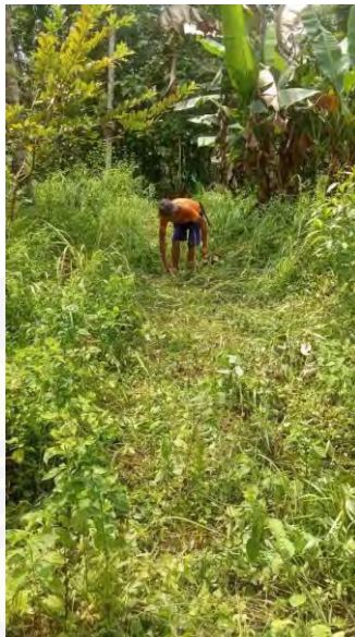
Gambar 4.11 Proses Nyacar (membersihkan Lahan) Oleh Abah Kalimi.

Bisanya dilakukan seminggu sesudah dilaksanakannya Narawas, kegiatan nyacar dilakukan untuk membersihkan ladang yang sudah ditentukan agar bersih dari ilalang dan Semak belukar, sehingga ladang tersebut siap digarap untuk menanam Padi Huma.