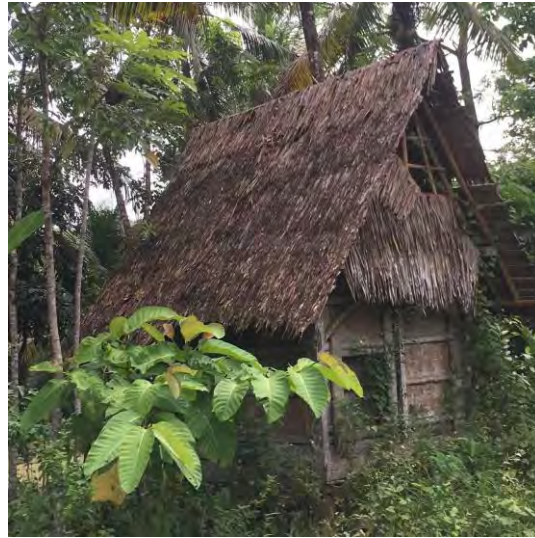
Gambar 4.29 Leuit (Lumpang Padi) Yang Terbangkalai