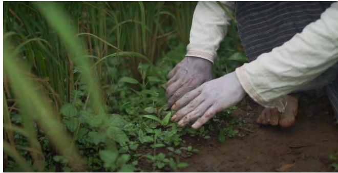
Gambar 4.23 Proses Nrored (pembershan gulma)