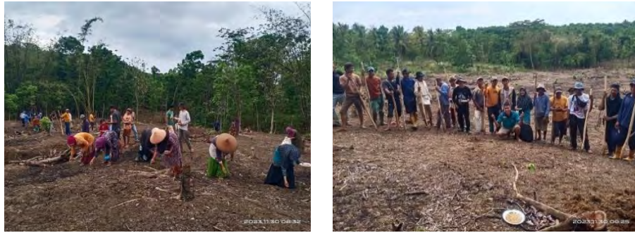
Gambar 4.19 & 4.20 Proses Penanaman Padi secara Liliuran (Gotong Royong)