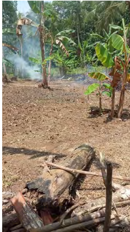
Gambar 4.14 Proses Ngaduruk (Pembakaran Gundukan Semak Belukar)