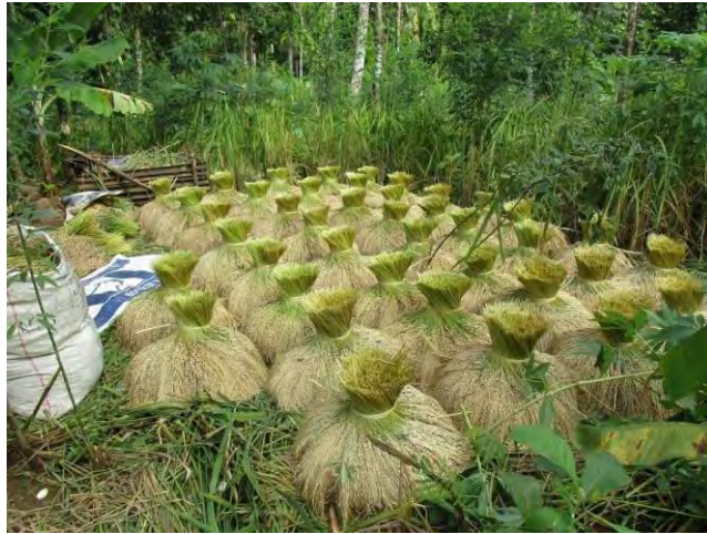
Gambar 4.26 Bentuk Poongan Padi Huma.