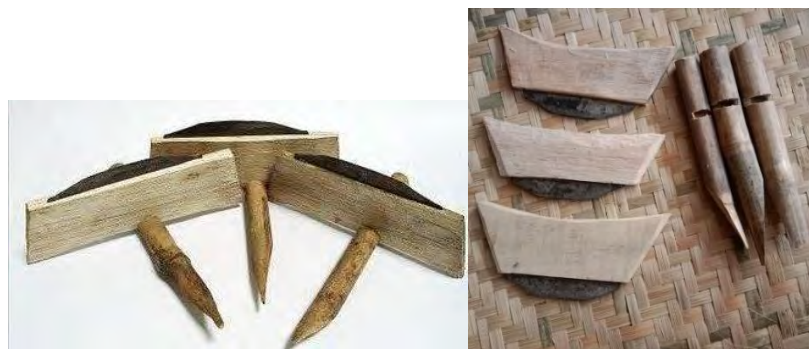
Gambar 4. 24 & 4.25 Bentuk Etem (Ani-ani) Sebagai alat Panen Padi Huma

Proses yang paling ditunggu oleh para Petani Huma, dimana setelah menunggu dan merawat Padi diladang dengan waktu yang terbilang lama, akhirnya para Petani bisa memanen hasil tanamnya. Dalam memanen Padi Huma biasanya petani Huma menggunakan alat panen berupa Etem (Dalam Bahasa Sunda) atau Ani-ani, yaitu alat panen Padi yang berfungsi memanen dengan cara memotong pertangkai dan digemgam menjadi satu cangci (satu genggam), Setelah itu disatukan menjadi satu Pocong (satu ikatan), yang setelahnya dikeringkan dengan cara dijemur diatas Lantaian (ruas bambu yang dibentuk seperti gawang memanjang), satu Lantaian penuh biasanya disebut dengan satu Gedeng . Setelah seluruh Lantaian Huma penuh Padi Huma dibiarkan hingga kering dengan bantuan sinar matahari, supaya setelah kering bisa dibawa ke rumah untuk di masukan kedalam Leuit (Lumbung Padi).