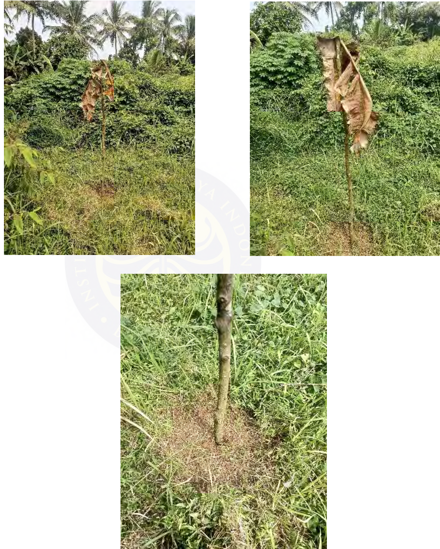
Gambar 4.5, 4.6 & 4.7 Bentuk Tanda Narawas, sebagai tanda bahwa lahan akan digarap

tersebut akan segera digarap, sehingga petani lain tidak akan menggunakan lahan yang sudah diberi tanda tersebut. Serta biasanya di atas batang kayu diselipkan dedaunan agar penanda tersebut terlihat jelas.