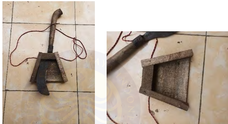
Gambar 4.8 & 4.9 Omprang

Sebelum penentuan Lokasi biasanya petani memberi tanda kepada petani dengan memainkan Omprang , sebuah sarung Arit yang terbuka Dimana saat dalam perjalanan menuju ladang huma yang digarap petani mengadukan Arit dan Omprang sehingga menghasilkan bunyi sebagai penanda waktu akan dimulainya menanam Padi Huma didaerah tersebut.