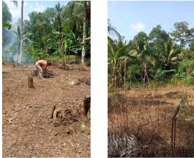
Gambar 4.12 & 4.13 Pengumpulan Semak kering yang telah di Cacar(Bersihkan)