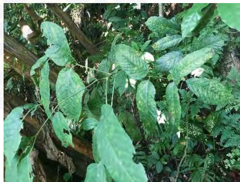
Gambar 4.32 Tanaman Sulangkar