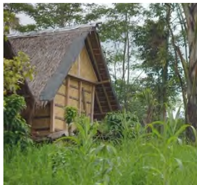
Gambar 4.28 Leuit (Lumbung Padi) Sebagai Tempat Penyimpanan Padi Huma

Sebelum dibawa dan diarak menggunakan Rengkong dan Omprang , biasanya Padi Huma yang telah kering dipindahkan dari Lantaian dan disimpan terlebih dulu di Para (bagian antara atap dan langit-langit Saung (Gubuk)) selama satu malam, hal ini bertujuan untuk mendinginkan Padi Huma atau sering disebut dengan istilah Niis keun Nyi Sri .