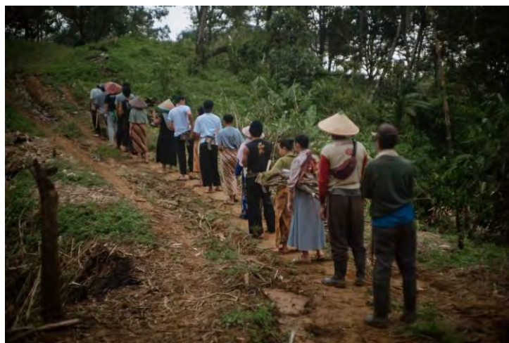
Gambar 4.10 Liliuran (Gotong Royong) menuju ladang Huma.