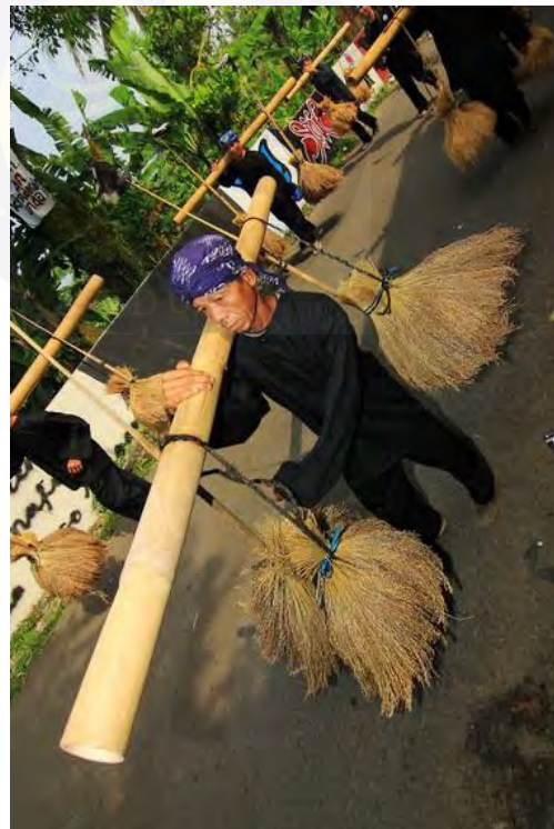
Gambar 4.30 Petani Membawa Padi dari ladang menuju Leuit (Lumpang Padi)