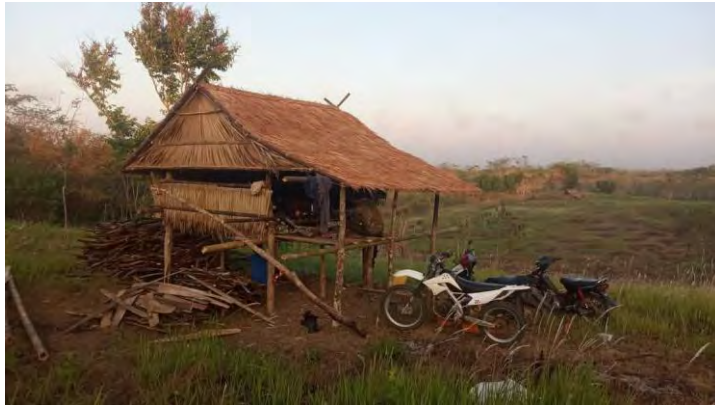
Gambar 4.21 Proses Mangkalan (Menjaga Padi Dari Hama)