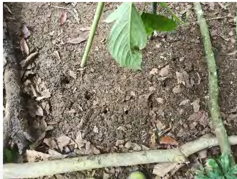
Gambar 4.17 Tujuh lubang penanda dalam Pungpuhunan

pertumbuhan Padi Huma yang ditanam di lahan yang digarap, bila padi pada lubang pertama terserang hama dan penyakit, maka padi lain yang ditanam akan trjangkit hama dan penyakit yang sama, sedangkan bila padi pada lubang pertama tumbuh subur maka padi lain yang ditanam akan ikut tumbuh subur.