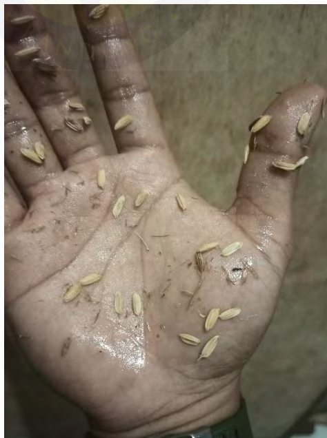
Gambar 4.18 Benih Padi yang saling bertemu satu sama lain