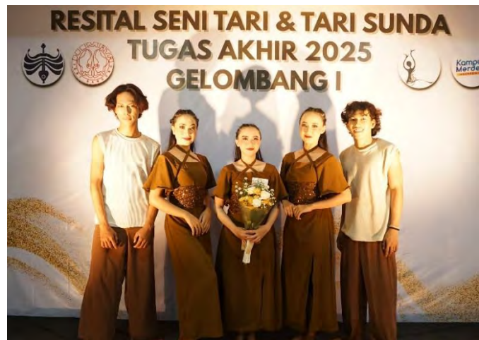
Gambar 89. Foto Bersama Penari Pendukung