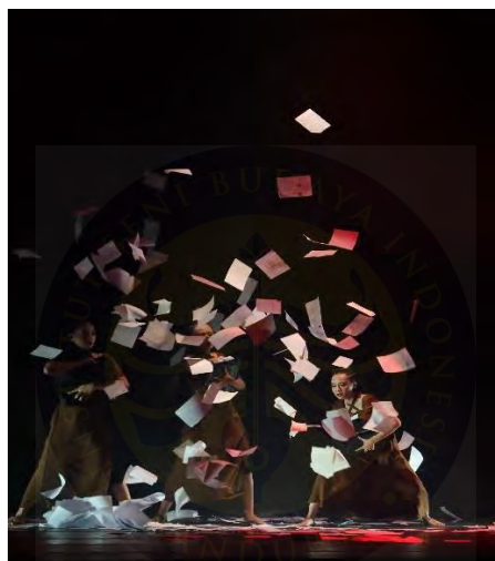
Gambar 84. Foto Saat Pertunjukan