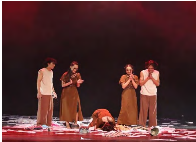
Gambar 86. Foto Saat Pertunjukan