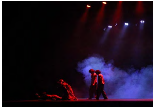
Gambar 83. Foto Saat Pertunjukan