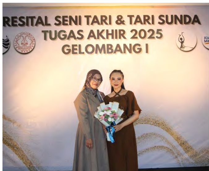
Gambar 88. Foto Bersama Mamah