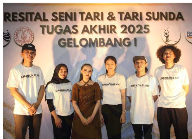
Gambar 90. Foto Bersama Tim