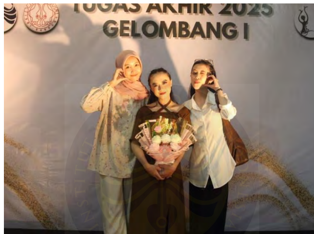
Gambar 93. Foto Bersama Sahabat