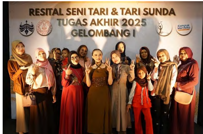
Gambar 92. Foto Bersama Keluarga