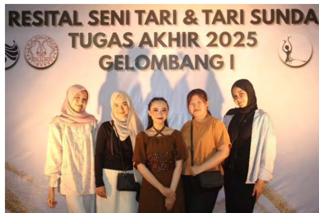
Gambar 94. Foto Bersama Teman