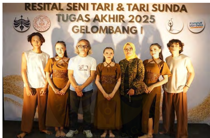
Gambar 87. Foto Bersama Dosen Pembimbing