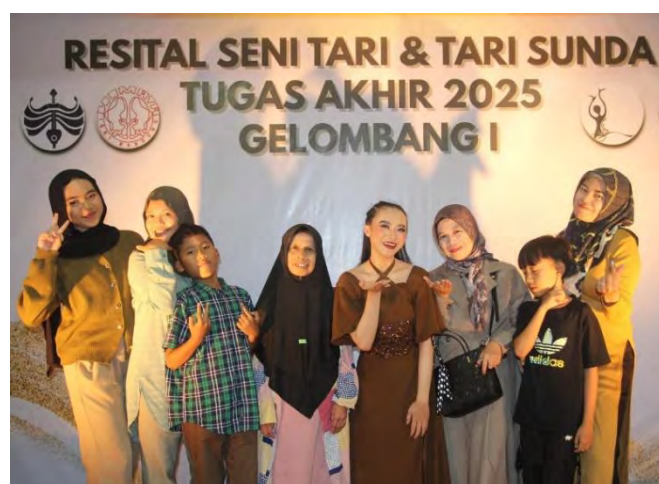
Gambar 91. Foto Bersama Keluarga