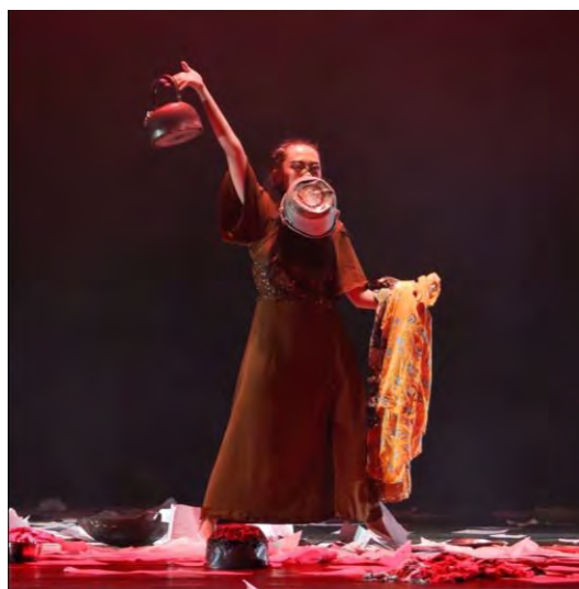
Gambar 85. Foto Saat Pertunjukan (Foto: Koleksi Devika, 2025)