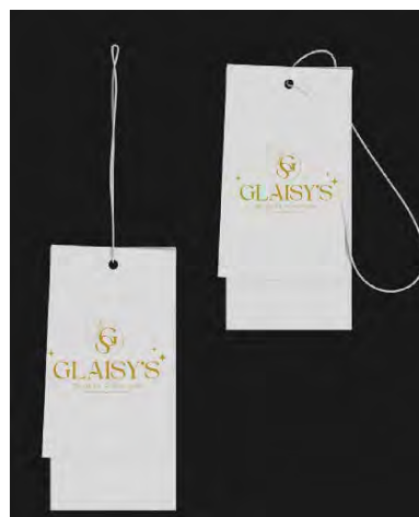
Gambar 5.5 Hangtag

Hangtag biasanya ditemukan menggantung pada bagian luar baju yang memberikan informasi mengenai logo brand , harga, warna, ukuran, dan cara perawatan baju tersebut. Hangtag dapat memberikan nilai tambah pada brand /merek dan produk. Hangtag dari brand /merek Glaisy's dibuat dengan nuansa hitam, gold , dan putih yang memberikan kesan elegan sesuai dengan identitas brand tersebut.