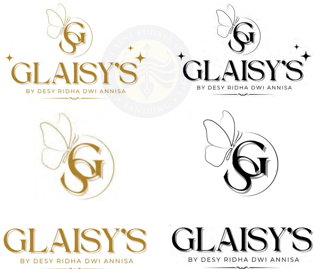
Gambar 5.3 Brand/Merek

Berikut merupakan logogram, logotype , dan tagline pada brand /merek yang dibuat.