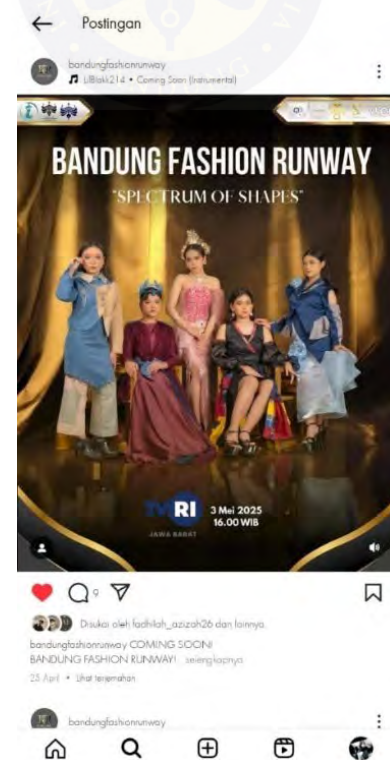
Gambar 5.8 Media Promosi

Media promosi untuk penyajian karya berfungsi sebagai sarana untuk memperkenalkan dan menyebarluaskan hasil karya melalui media sosial, sehingga dapat menjangkau masyarakat secara lebih luas. Promosi karya ini dilakukan melalui akun Instagram resmi Bandung Fashion Runway serta akun Instagram milik brand terkait.