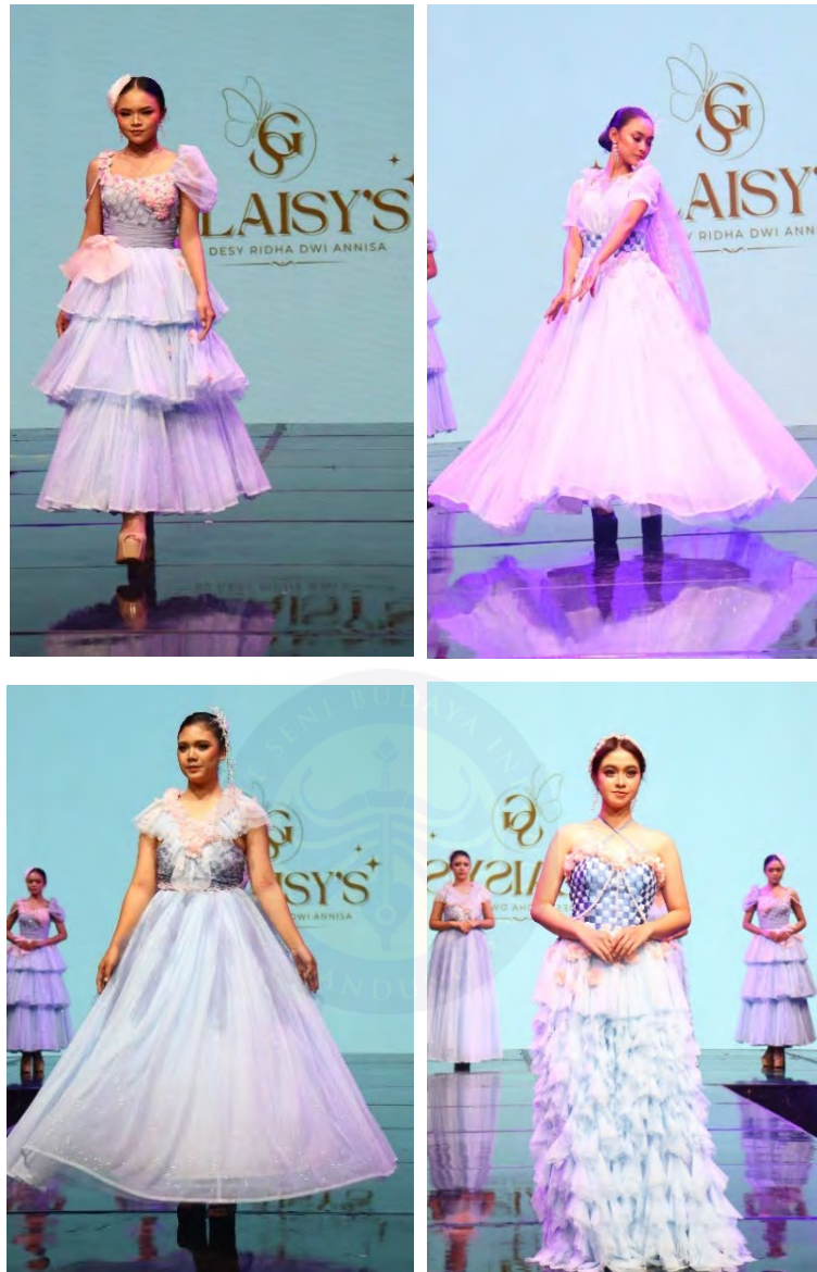
Gambar 5.2 Penyajian Karya