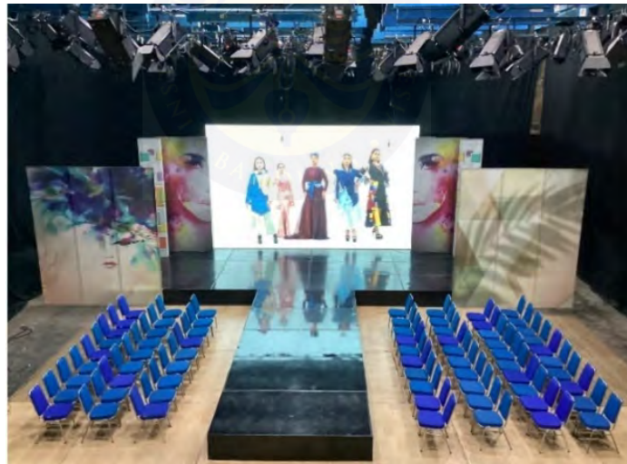
Gambar 5.1 Penyajian Karya

Konsep fashion show ini disajikan dalam bentuk parade di atas catwalk yang dirancang menyerupai panggung dengan tinggi sekitar 30 cm. Catwalk merupakan elemen kunci dalam peragaan busana, berbentuk jalur yang menjadi fokus utama di ruang pertunjukan. Di atas jalur inilah para model melenggang untuk menampilkan koleksi busana dalam sebuah fashion show (Sanicara, 2019).