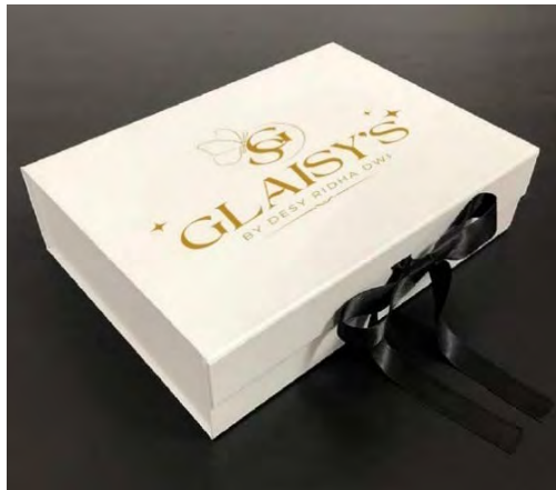
Gambar 5.7 Packaging/Pengemasan