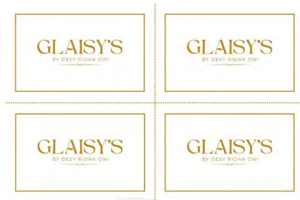
Gambar 5.4 Label

Label pakaian adalah tanda pengenal yang menunjukkan siapa pembuat busana tersebut. Selain sebagai identitas produk, label juga dapat memberikan kesan tentang seberapa bagus kualitas pakaian yang dibuat (Rizak Zuhrotul, 2020:1).