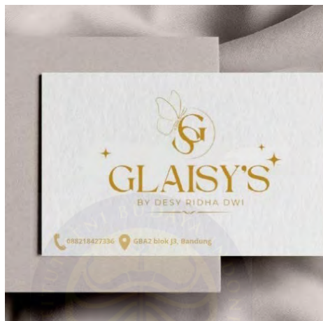
Gambar 5.6 Kartu Nama

Kartu nama adalah salah satu media promosi cetak yang berfungsi sebagai alat komunikasi sekaligus identitas profesional dari sebuah brand atau pelaku usaha. Umumnya, kartu nama memuat berbagai informasi penting seperti nama brand atau merek, logo sebagai simbol visual yang mewakili identitas usaha, nomor kontak yang dapat dihubungi, alamat email , akun media sosial yang aktif, serta alamat lengkap tempat usaha.