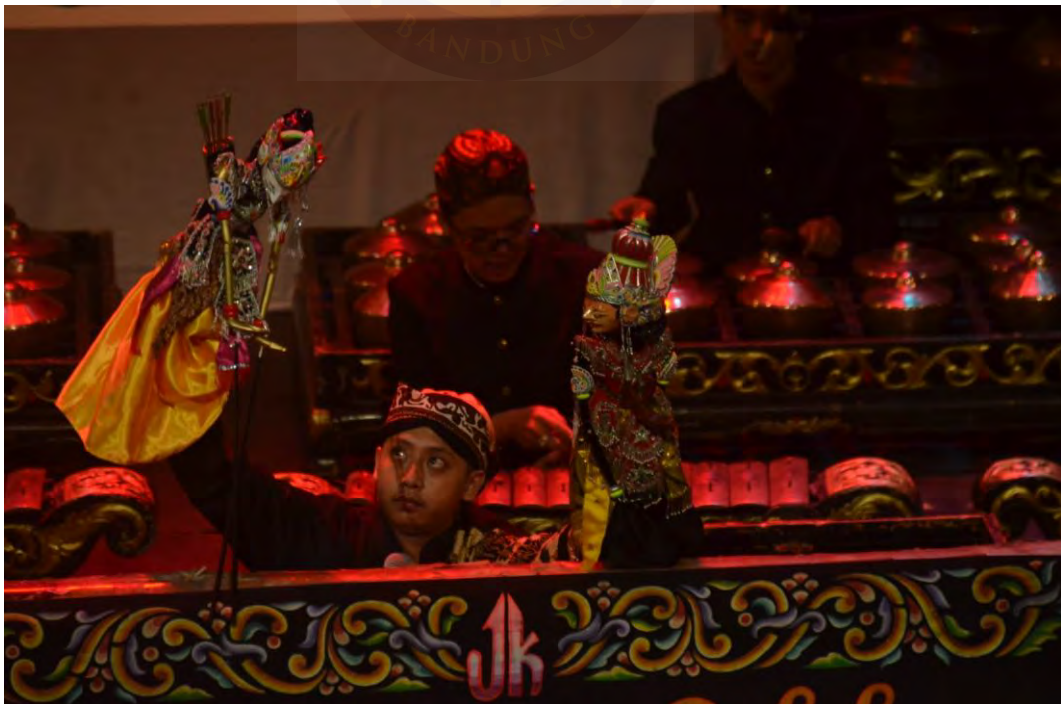
Gambar 1.2 Foto Pelaksanaan.