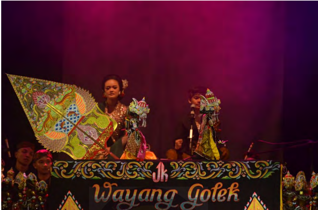
Gambar 1.3 Foto Pelaksanaan.