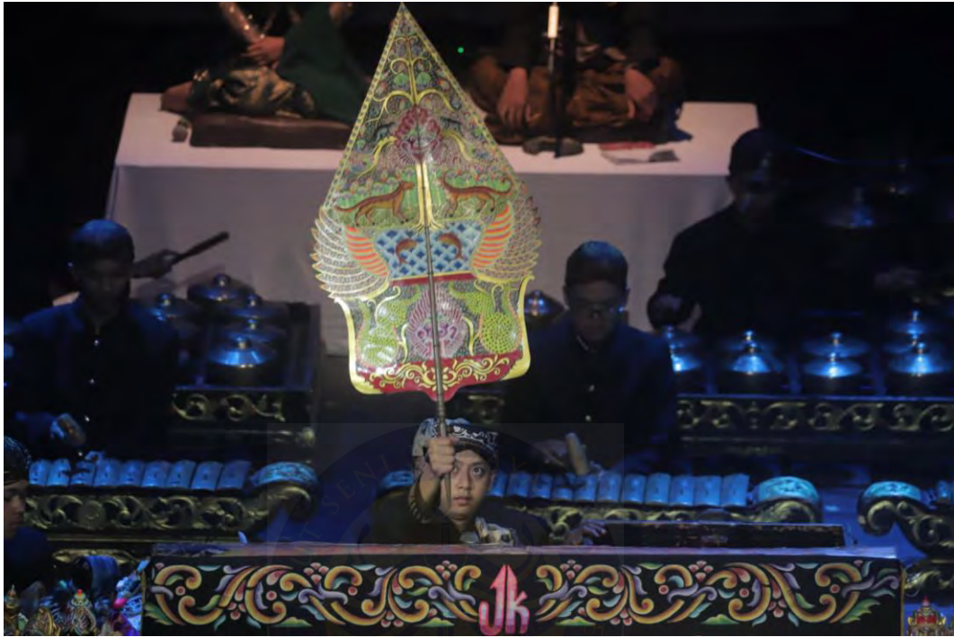
Gambar 1.1 Foto Pelaksanaan.