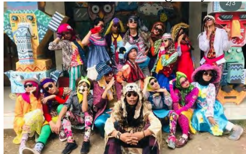
Gambar 4. 9 Art and Design Day 2019