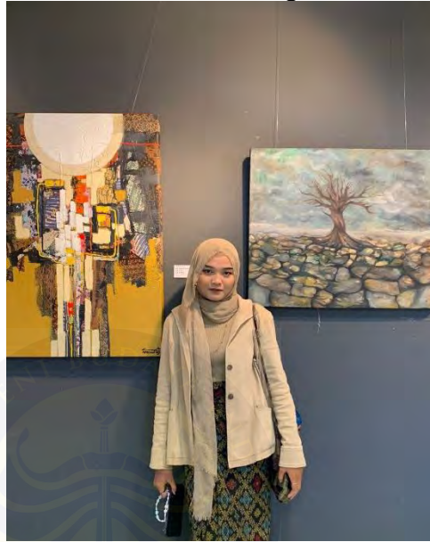
Gambar 4. 21 Power Dressing dan Kain Etnik

Penambahan aksesoris ikat pinggang, dan sepatu boots berwarna coklat memperkuat kesan fungsional sekaligus terlihat stylish pada tampilannya.