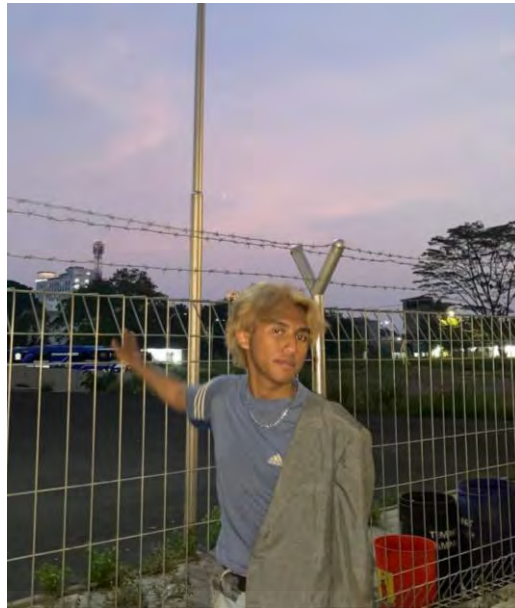
Gambar 4. 18 Casual and Streetwear