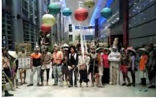
Gambar 4. 2 Musik Bambu Nusantara I (10 September 2007)