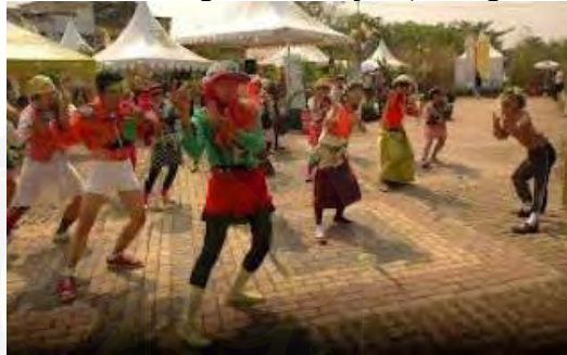
Gambar 4. 4 Bandung Kotaku Hijau (2-3 Agustus 2008)