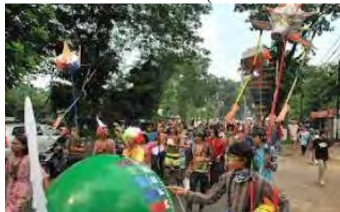
Gambar 4. 6 Helar Festival (13 Desember 2009)