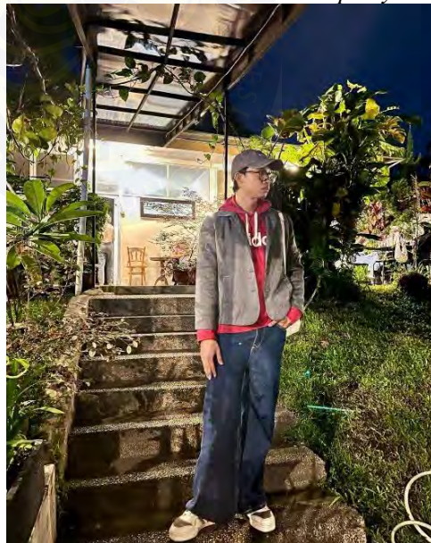
Gambar 4. 14 Casual and Sporty