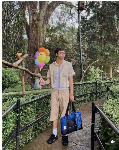
Gambar 4. 13 Casual Looks