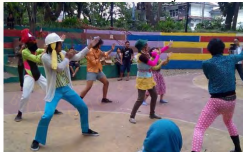
Gambar 4. 7 Pra Event DjamoE #5

Dalam dokumentasi tersebut, mereka tampil pada sebuah