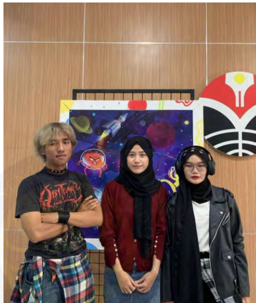
Gambar 4. 19 Streetwear Looks