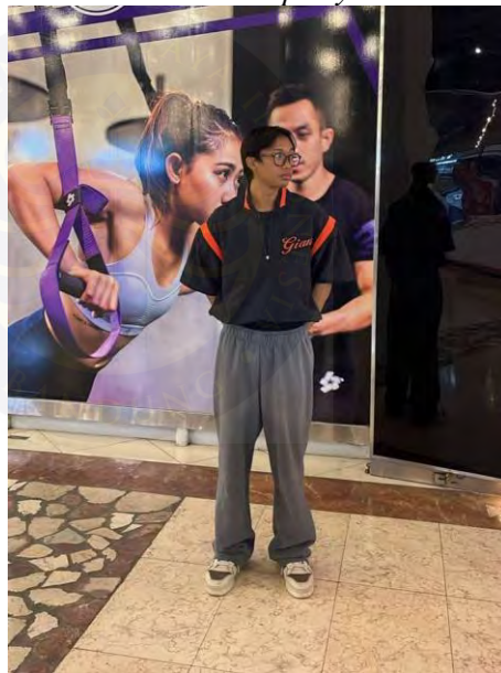
Gambar 4. 12 Sporty Looks

Berikut terdapat beberapa dokumentasi visual yang memperlihatkan bagaimana Ipong menggunakan fesyen yang cenderung casual dan sporty secara personal dalam aktivitas sehari-harinya. Fesyen tersebut dapat memperlihatkan preferensi estetis, kenyamanan, juga identitas kulturalnya dalam aktivitas sehari-hari di lingkungan sosialnya.