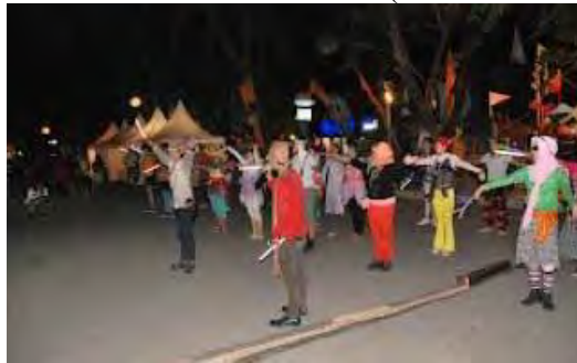
Gambar 4. 5 Jakarta Urban Fest (24 Oktober 2009)