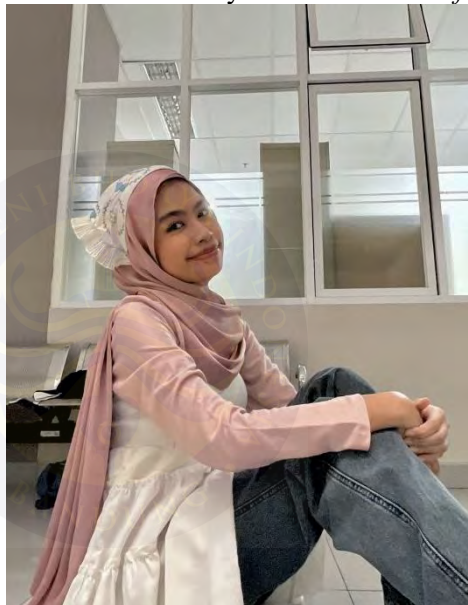
Gambar 4. 15 Fesyen Cerah dan Scarf

Terdapat beberapa dokumentasi yang akan disajikan penulis sebagai pendukung narasi fesyen Tasya, yang merepresentasikan pilihan fesyen cerah dan penggunaan aksesoris seperti scarf dalam aktivitas sehari-harinya.