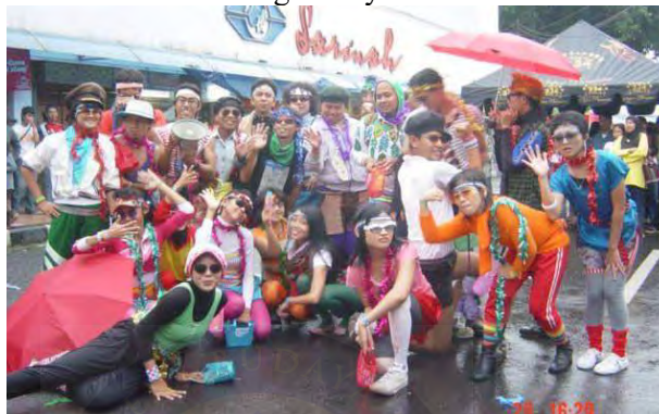
Gambar 4. 1 Ganiati dengan Gaya Club 80's dan Headband

yakni fesyen olahraga ketat, berwarna cerah, dan headband yang menjadi identik dengan semangat kebugaran dan gaya hidup. Adapun tokoh seperti Jane Fonda yang mempopulerkan tampilan ini, melalui video senamnya (InStyle, 2023).