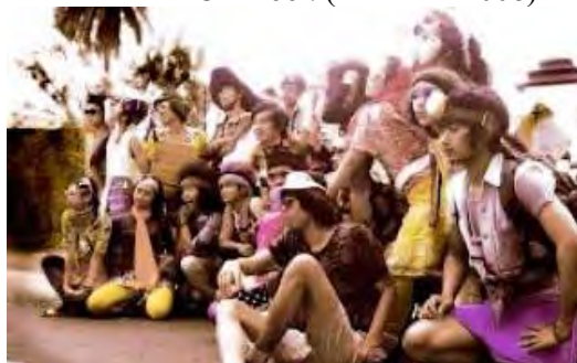
Gambar 4. 3 T-Look (22 Maret 2008)