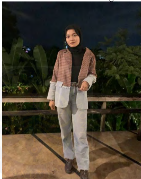
Gambar 4. 20 Power Dressing Looks