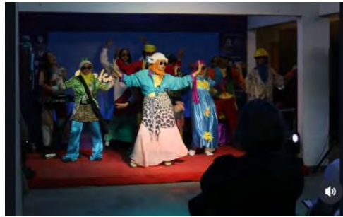
Gambar 4. 11 Pekan Kreatif 2024