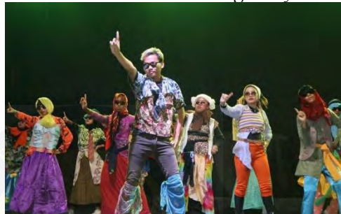
Gambar 4. 10 Art and Design Day 2024