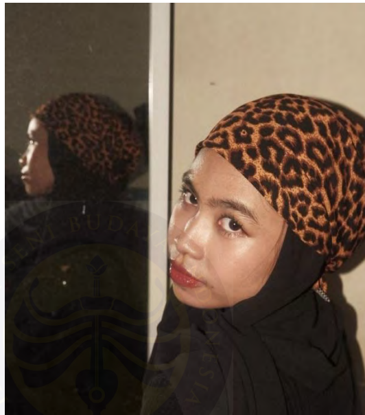
Gambar 4. 16 Scarf Leopard

jeans memperkuat kesan kasual yang nyaman untuk aktivitas sehari-hari. Sementara scarf bermotif sebagai layer kedua yang menjadi simbol gaya khas fleksibel, dan dapat digunakan dalam berbagai situasi tanpa kehilangan identitas diri.