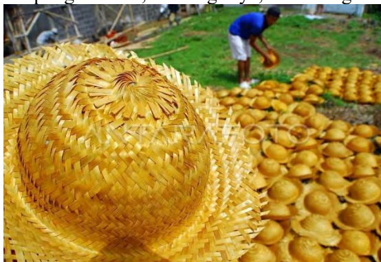
Gambar 4.3 Pembuatan topi pramuka di kawasan sentra pembuat topi pramuka, Kampung Pondok, Sindang Jaya, Kab. Tangerang