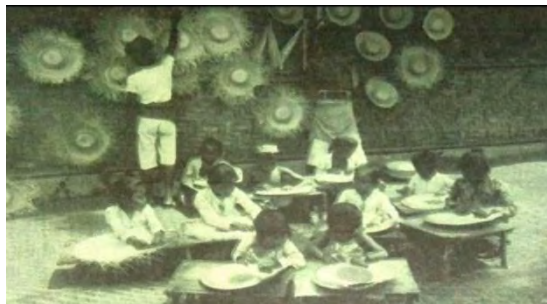
Gambar 4.2 anyaman topi bambu yang dikerjakan oleh anak-anak di tahun 1925

Pada masa kolonial Hindia Belanda, produksi topi bambu menjadi salah satu kegiatan ekonomi yang signifikan di wilayah Tangerang. Menurut Hok Tjay (2019), kegiatan ini pada awalnya digeluti oleh masyarakat Betawi, Sunda, dan Tionghoa. Perkembangan teknologi, terutama dengan masuknya listrik ke daerah tersebut, mendorong keterlibatan tiga perusahaan Eropa yang kemudian memproduksi topi secara mekanis. Selama masa keemasan produksi topi, terutama ketika harga pasar menguntungkan dan aktivitas pertanian berkurang, tidak kurang dari 200.000 hingga 300.000 penduduk termasuk laki-laki, perempuan, dan anak-anak terlibat dalam proses produksi, mulai dari pengolahan serat bambu hingga tahap akhir pembuatan topi. Sebagaimana pada gambar berikut.