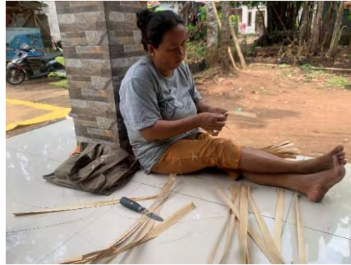
Gambar 4.9 Proses Ngerik atau Mengiris tipis

Sumber: Dokumentasi Zahra Fitriana .R., 13 Maret 2025