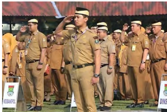
Gambar 4.5 Pemakaian Peci Bambu saat Apel ASN Kab.Tangerang