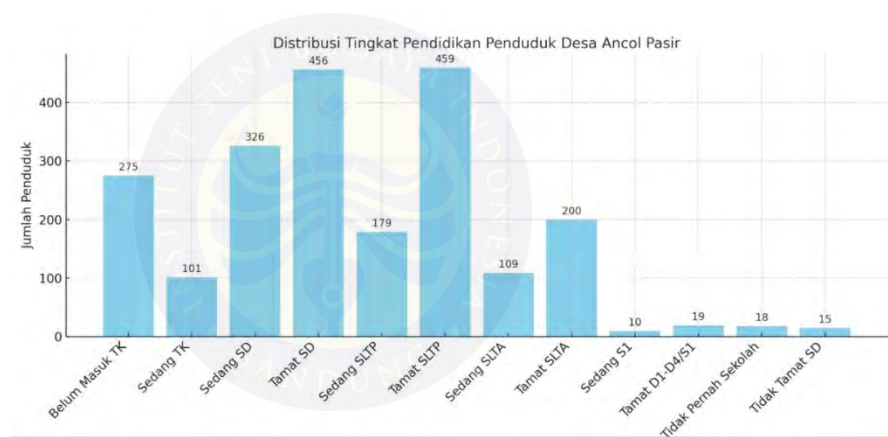
Gambar 4.8 Rekapitulasi Tingkat Pendidikan Masyarakat Desa Ancol Pasir per Februari 2025