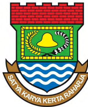
Gambar 4.4 Logo Kabupaten Tangerang