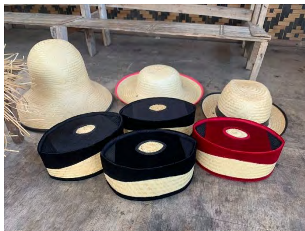
Gambar 4.6 Ragam Inovasi Topi Bambu

sumber: dokumentasi Zahra Fitriana .R., 14 maret 2025