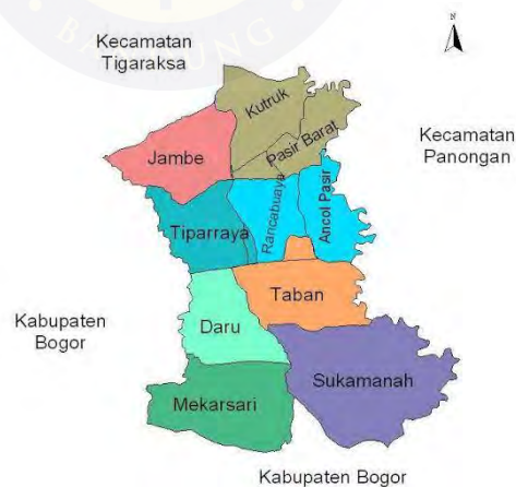
Gambar 4.7 Peta Desa Ancol Pasir dalam lingkup se-Kecamatan Jambe

Sumber: Badan Pusat Statistik Kab. Tangerang 2017