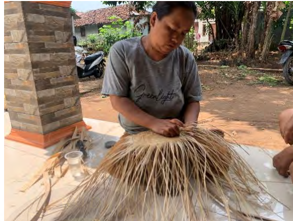
Gambar 4.11 Proses Menganyam Topi Bambu