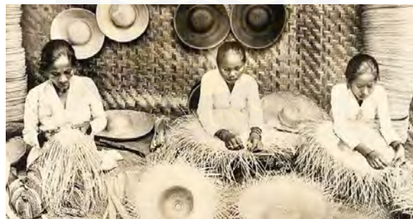
Gambar 4.13 Sejumlah Ibu Rumah Tangga di Tangerang sedang menganyam topi, komoditas ekspor andalan Hindia Belanda awal abad ke-20

Di Desa Ancol Pasir Kecamatan Jambe, perempuan terbiasa menjalani peran ganda. Mereka mengelola rumah tangga sekaligus terlibat dalam kegiatan ekonomi seperti menganyam topi bambu. Keterlibatan perempuan dalam kerajinan ini bukan hal baru. Sejak masa Hindia Belanda, mereka telah menjadi tenaga kerja utama dalam industri topi bambu, yaitu dengan menjalankan kegiatan produksi dari rumah secara kolektif. Peran ini terbentuk karena diwariskan secara turun-temurun, terutama dari ibu kepada anak perempuan, yakni melalui pewarisan keterampilan secara informal dalam lingkungan keluarga. Berikut dokumentasi sejarah yang memperlihatkan bahwa pewarisan keahlian menganyam berawal sejak Zaman Hindia Belanda yang dilakukan oleh para ibu-ibu terdahulu.