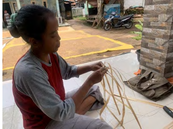
Gambar 4.10 Proses Mimitian/Membuat Bunga Dasar