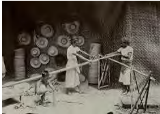
Gambar 4.1 Pembuatan topi bambu mencakup seluruh anggota keluarga di tahun 1925

Permana & Hasanudin, 2019:16). Berikut dokumentasi sejarah pembuatan topi bambu yang dilakukan secara kolektif dalam satu keluarga.