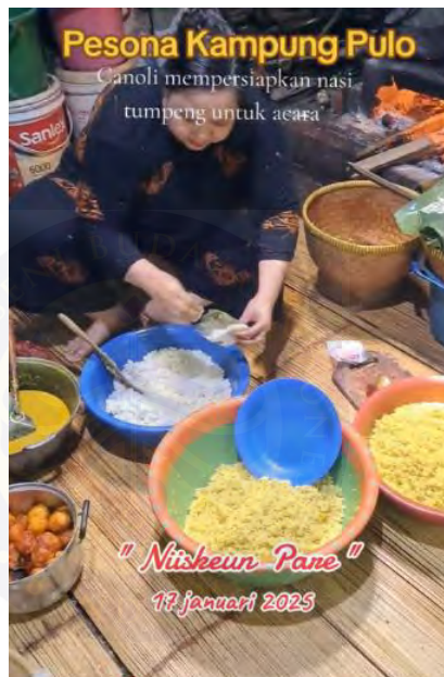
Gambar 4. 10 Perempuan Kampung Adat Pulo Memasak Nasi Kuning

Perlengkapan yang dibutuhkan untuk tradisi niisken pare yaitu nasi kuning dan lauk pauk yang disiapkan atau dimasak oleh perempuan Kampung Adat Pulo. Tidak terdapat ketentuan pasti mengenai jumlah beras dan lauk pauk yang dimasak, besarnya disesuaikan dengan kemampuan dan ketersediaan yang dimiliki oleh setiap keluarga dalam masyarakat Kampung Adat Pulo.