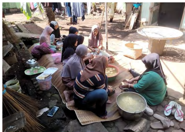
Gambar 4. 13 Perempuan Kampung Adat Pulo Memasak Bersama