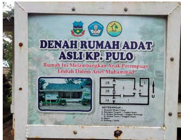
Gambar 4. 4 Denah Rumah Adat, Kampung Adat Pulo