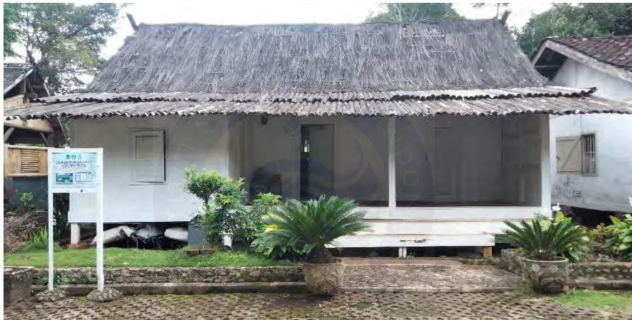
Gambar 4. 3 Tampak Depan Rumah Adat Kampung Pulo