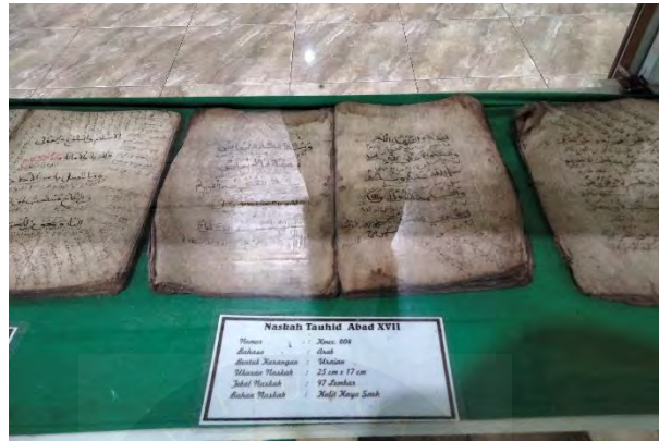
Gambar 4. 8 Kitab Tauhid