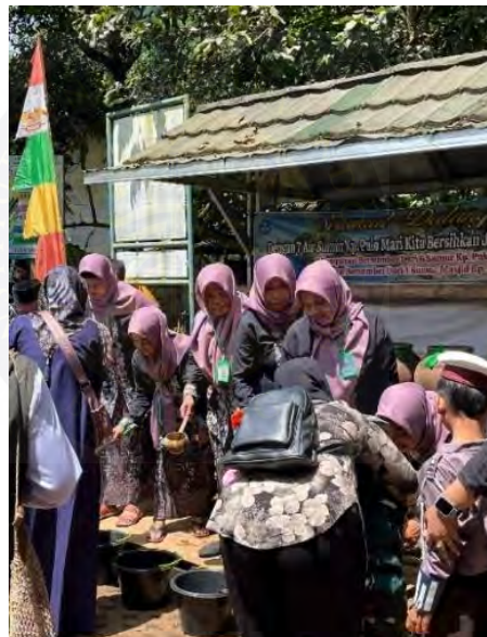
Gambar 4. 12 Perempuan Kampung Adat Pulo Membasuhkan Air Kepada Peserta Sunatan Massal