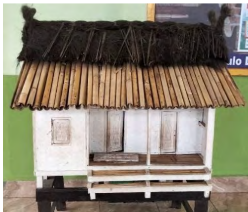
Gambar 4. 11 Miniatur Rumah Adat