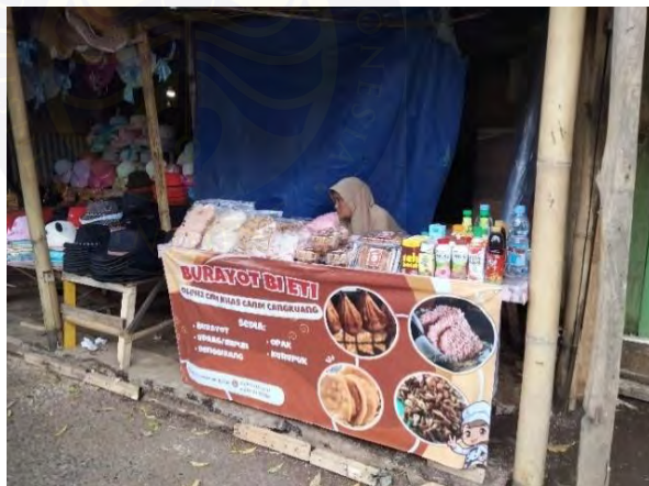
Gambar 4. 6 Makanan Khas yang dijual