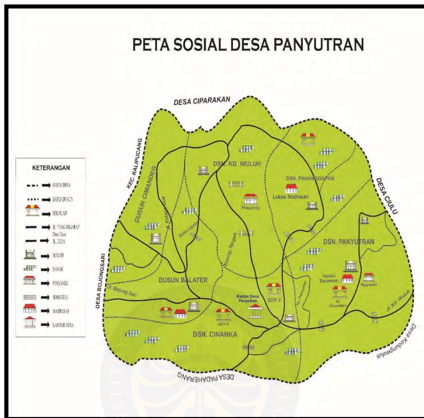
Gambar 4. 1 Peta Desa Panyutran