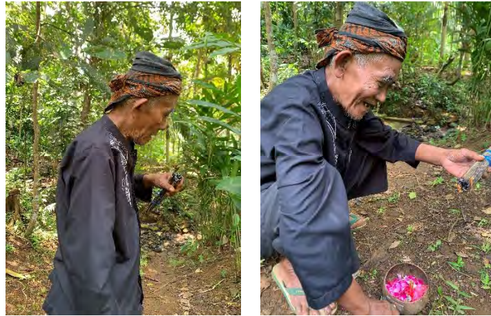
Gambar 4. 6 Proses pembakaran kemenyan pada Mancung Kelapa