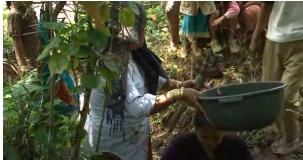
Gambar 4. 8 Proses basuh wajah calon ronggeng