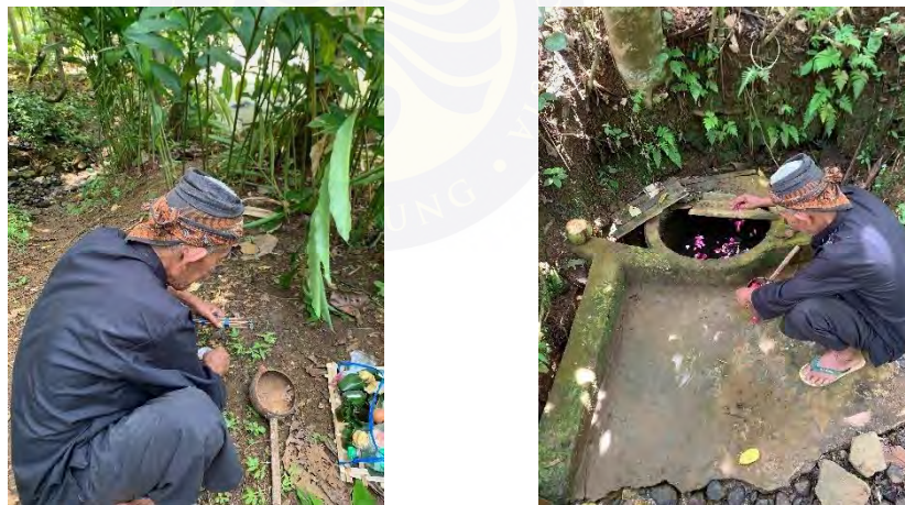
Gambar 4. 5 Proses memasukan bunga 7 rupa

tidak bersifat arbitrer, melainkan didasarkan pada kepercayaan komunal bahwa sumur tersebut memiliki keterkaitan kuat dengan entitas spiritual Neng Ayu yang diyakini sebagai pelindung sekaligus pemberi berkah bagi kesenian Ronggeng Gunung. Sesajen yang disiapkan umumnya terdiri dari berbagai komponen organik seperti bunga-bunga tertentu, buah-buahan pilihan, nasi tumpeng, dan berbagai makanan tradisional lainnya yang disusun. Peletakan sesajen ini merupakan bentuk komunikasi simbolik dengan dimensi spiritual, sekaligus sebagai permohonan izin dan perlindungan agar seluruh rangkaian ritual dapat berlangsung dengan lancar tanpa hambatan spiritual.