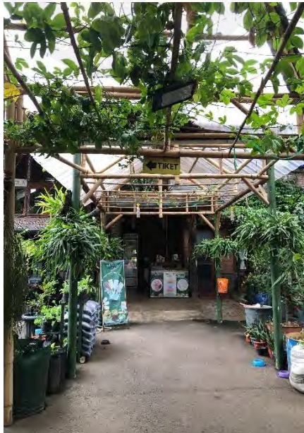
Gambar 4.4 Halaman Depan SAU