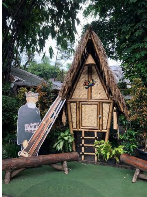
Gambar 4.3 Miniatur Saung Udjo