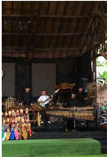
Gambar 4.6 Pertunjukan ARUMBA