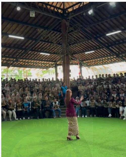
Gambar 4.5 Pelatihan Angklung