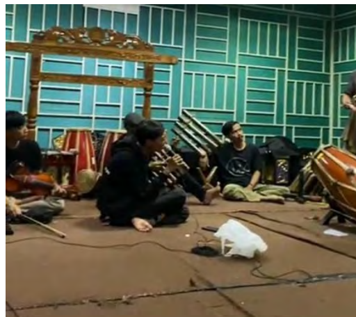
Lampiran 5. Proses Latihan