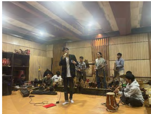
Lampiran 4. Proses Kolokium.