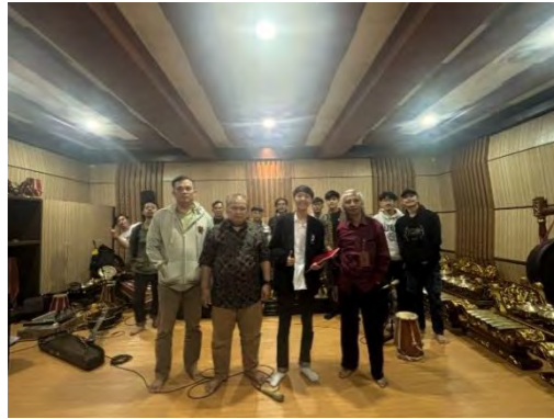
Lampiran 3. Foto Bersama Dewan Penguji Kolokium.