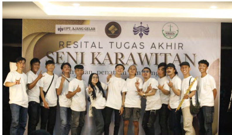
Lampiran 6. Proses Gladi Bersih