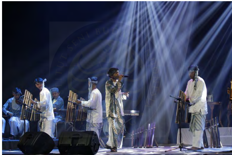
Lampiran 7. Ujian Tugas Akhir