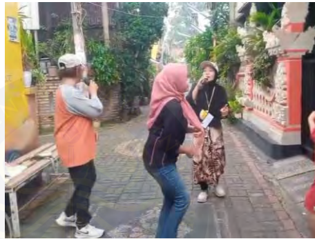
Gambar 4.3 Kegiatan Hiburan

“kalau malam minggu Biasa sih mereka ya bapak-bapaknya tuh kalo malam minggu sih2. Kayak karaokean mereka gitu. Karaokean bareng-bareng mau orang orang Bali situ. Emang udah disediakan sama Bu RT itu. Kalau weekend itu pasti mereka karokean. Mau orang Bali, mau orang apa, pokoknya semua kumpul bareng”. (Violeta Priskilia. Ambon. 40 Tahun)