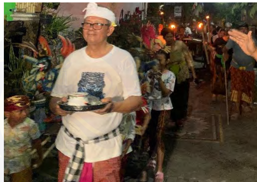
Gambar 4.11 Tradisi Ngarupuk di Kampung Bali Bekasi

magrib, yang artinya waktu dilaksanakan berdampingan dengan umat Islam untuk berbuka puasa. Waktu yang dilaksanakan bersinggungan antara dua ritual keagamaan, dahulu sempat menimbulkan rasa heran di kalangan warga non Bali. Kondisi yang biasa hening saat adzan Magrib menjadi meriah karena bunyi-bunyian dari gamelan dan arakan Ngarupuk , suatu aktivitas tersebut jarang di saksikan sebelumnya.