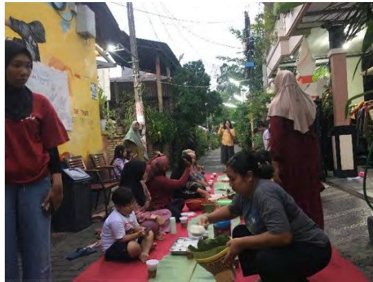
Gambar 4.5 Momen Menyiapkan Untuk Buka Puasa Bersama

bukan hanya merasakan kebersamaan, tetapi mempererat rasa saling menghargai di antara warganya.