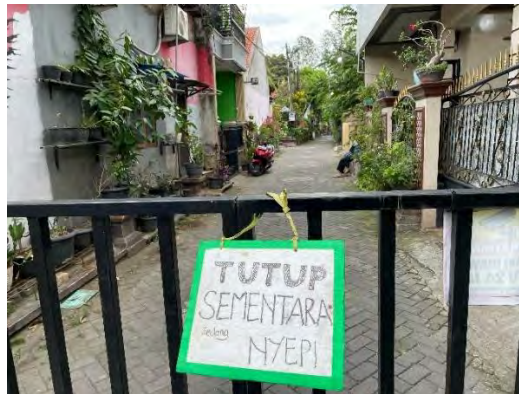
Gambar 4.7 Suasana Nyepi

konsep Nyepi ini dari semua kalangan. sehingga tidak ada aktivitas yang mengganggu suasana Nyepi.