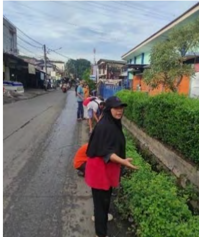
Gambar 4.2 Kegiatan Gotong Royong