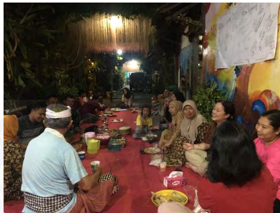
Gambar 4.4 Suasana Buka Bersama di Kampung Bali Bekasi

“kita setiap puasa pasti ada agenda buka puasa bersama, kita semua disini kumpul tidak hanya yang islam saja tapi yang non islam juga ikut buka puasa seperti yang bali nya dan kristen kita semua kumpul di depan rumah saya gelar karpet dan makanan biasanya sumbangan orang-orang pada datang bawa maknan atau minuman nanti kita bagi-bagi saat buka puasa”. (Puji Lestari. 2025)