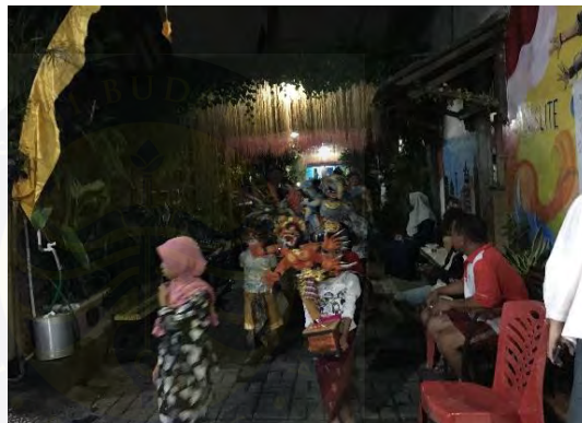
Gambar 4.13 Tradisi Ngarupuk di Kampung Bali Bekasi