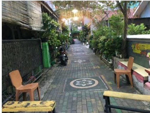
Gambar 4.8 Suasana Nyepi