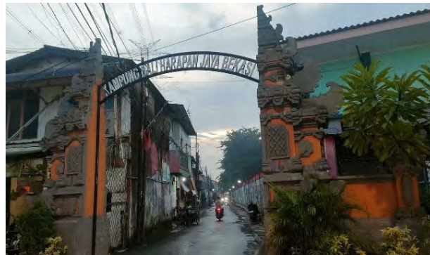
Gambar 4.1 Gapura Kampung Bali Bekasi

kawasan tersebut. Kampung bali juga sering dijamin lokasi Kuliah Kerja Nyata serta penelitian para Mahasiswa ataupun pelajar.