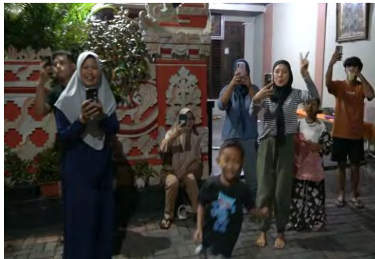
Gambar 4.12 Antusias warga non Bali