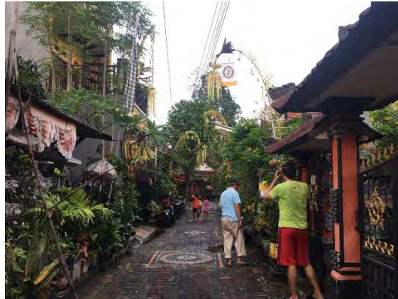
Gambar 4.10 Pemasangan Janur Untuk Galungan

di tambahkan sesajen pada janur. Semua warga etnis Bali turut memasang janur di depan rumah masing-masing karena sudah menjadi keharusan setiap perayaan galungan.