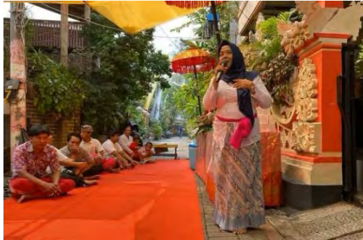
Gambar 4.9 Suasana Halal Bihalal