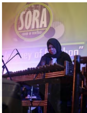
Gambar 4.4. Calung Rumpun Bambu

tabung yang mirip dengan xylophone . Carumba dimainkan dengan cara dipukul menggunakan stik bambu atau tangan. Dalam kelompok musik SORA digunakan dua buah alat musik carumba ini.