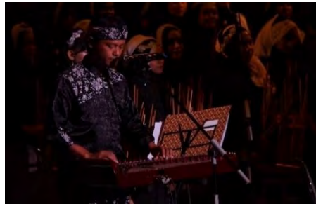
Gambar 4.9. Kecapi