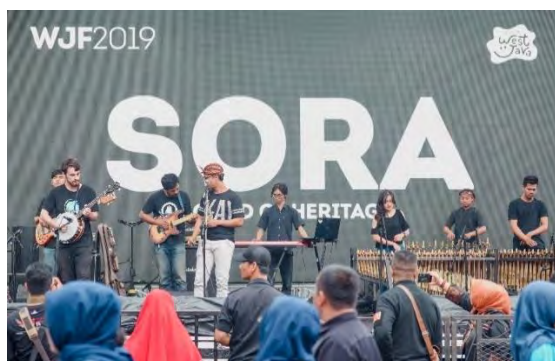
Gambar 4.19. WJF 2019