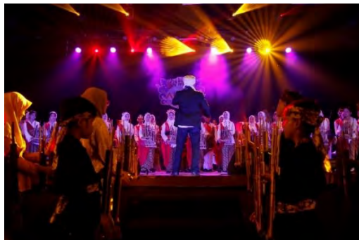
Gambar 4.20. Angklung Khatulistiwa