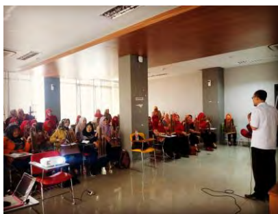
Gambar 4.1. Workshop Angklung

Selain itu juga ada kegiatan workshop atau pelatihan angklung untuk guru-guru TK, dengan maksud agar lebih banyak lagi pelatih-pelatih angklung yang berkualitas.