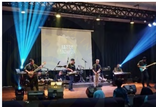
Gambar 4.18. Jazzylicious 2

Konser JAZZYLICIOUS 2 kali ini dengan tema “Soundnovation” dengan tagline: Where Tradition Meets Innovation., tidak hanya menciptakan sebuah pertunjukan musik, tetapi juga sebuah peristiwa seni yang memperkuat identitas kultural dengan kreativitas masa kini. Konser Jazzylicious 2 ini dilaksanakan di Padepokan Mayang Sunda pada tanggal 6 Desember 2023.