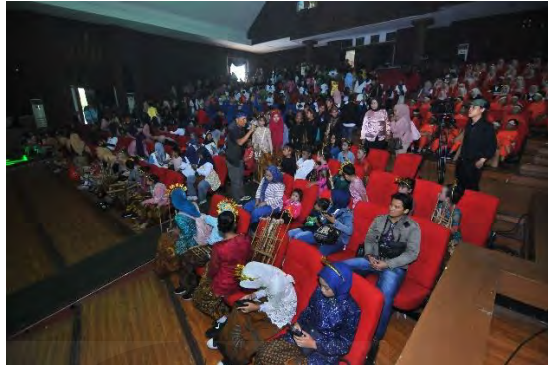
Gambar 4.23. Penonton Pertunjukan SORA

penonton sangat positif. Kelompok musik SORA dapat menginspirasi anak muda untuk tertarik mengulik karya dari kreasi musik tradisi ke dalam format modern.