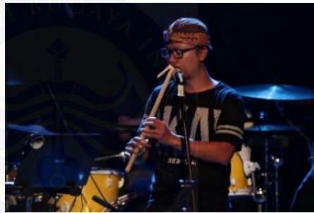
Gambar 4.6. Suling

Suling, yang juga disebut seruling, banyak ditemukan di Jawa Barat, menurut sejarah suling ini sudah berusia 14 abad. Suling memiliki peran yang bervariasi dalam musik, mulai dari mengiringi pertunjukan seni tradisional, seperti tari dan wayang, hingga menjadi bagian dari musik rakyat dan keagamaan. Di berbagai budaya di Indonesia, suling sering digunakan untuk menciptakan melodi yang indah dan emosional.