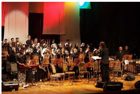
Gambar 4.12. The Beginning

bambu dan kompetisi band. Open gate dibuka dari mulai pukul 19.30 WIB.