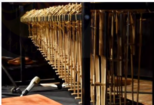
Gambar 4.3. Angklung Toél

Angklung toél merupakan alat tradisional dari Jawa Barat. Angklung toél memiliki bentuk yang mirip dengan angklung pada umumnya, yaitu terdiri dari beberapa tabung bambu. Namun, angklung toél memiliki ciri khas tambahan berupa pemotongan pada bagian ujung tabung bambunya, sehingga bunyi yang dihasilkan cenderung lebih “terbuka” dan memiliki karakter suara yang beda dari angklung konvensional. Pada kelompok musik SORA sendiri memakai empat alat musik angklung toél .