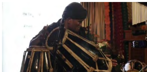
Gambar 4.7. Kendang