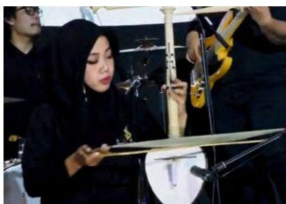
Gambar 4.8. Rebab

Rebab merupakan alat musik berdawai yang terbuat dari kayu dan memiliki badan yang bulat atau seperti buah pir. Rebab memiliki satu atau dua senar yang digesek menggunakan busur yang dilapisi dengan rosin. Di Indonesia sendiri, rebab sudah menjadi bagian dari musik tradisional sejak lama. Rebab digunakan dalam berbagai jenis musik tradisional baik gamelan, wayang kulit, tarian, dan lain sebagainya.