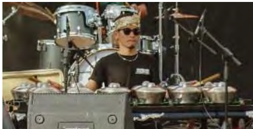
Gambar 4.11. Bonang

sering kali menjadi bagian utama dalam pengiringan musik gamelan.