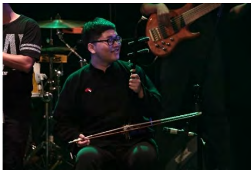
Gambar 4.16. Perform Sunan Ambu

satu mahasiswa musik dari China tersebut untuk memainkan erhu (alat musik gesek China) dalam penampilan karya SKY.