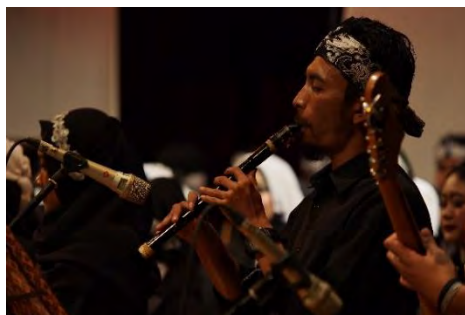
Gambar 4.5. Toléat

Toléat merupakan alat musik tradisional dari Kabupaten Subang yang terbuat dari bambu yang mirip dengan suling. Berdasarkan sejarahnya, alat musik ini diciptakan oleh Mang Parman yang terinspirasi dari alat tiup kaulinan barudak yaitu empet-empetan di pesawahan Pantura Kabupaten Subang.