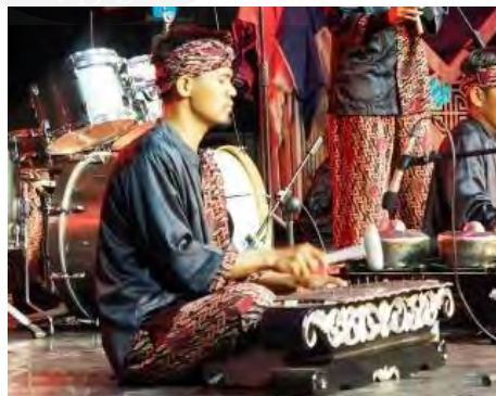
Gambar 4.10. Saron

Saron adalah instrumen berdawai yang terbuat dari logam, biasanya tembaga atau kuningan. Instrumen ini memiliki serangkaian tataan ( tines ) yang dipasang di atas sebuah bingkai kayu atau logam. Saron umumnya disetel dalam skala pelog atau slendro, yang merupakan sistem tangga nada yang unik dalam musik gamelan.