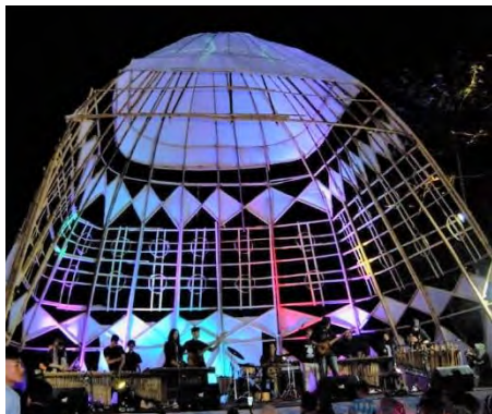
Gambar 4.15. Konser Kampung Jatitujuh