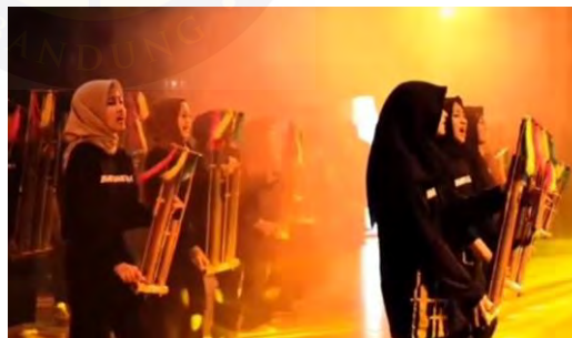
Gambar 4.21. Angklung Nation Bihari, Kamari, Kiwari

Pertunjukan Angklung Nation merupakan pertunjukan angklung dengan berbagai genre musik angklung berdasarkan perkembangan sejarah, mulai dari angklung buhun, angklung padaeng, angklung toel, hingga tiba pada angklung kreasi yang terus dinamis mengikuti perkembangan zaman. Pertunjukan ini dikemas semenarik mungkin dengan menghadirkan para musisi profesional dalam musik angklung.