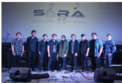
Gambar 4.17. Jazzylicious 1

Konser Jazzylicious 1 merupakan sebuah pertunjukan SORA band yang membawakan konsep musik jazzy-ethnic. Konser Jazzylicious ini berkolaborasi dengan BPNB Jabar, Dinas Budaya dan Pariwisata Jawa Barat serta Bandung Creative HUB. Konser Jazzylicious digelar pada tanggal 30 November 2021 di Gedung Auditorium Bandung Creative HUB (Auditorium Lt. 3).