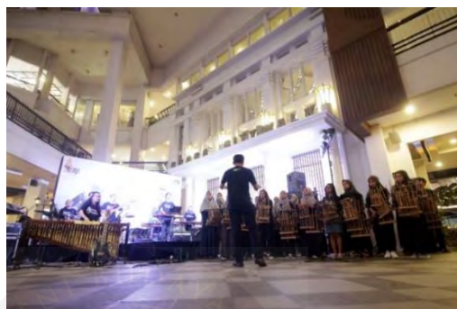
Gambar 4.14. Epic Crescendo

bermakna sebuah permulaan menuju kebanggaan dalam dunia musik angklung. Pertunjukan ini dilaksanakan pada tanggal 6 Desember 2019 bertempat di Braga Citywalk, Jl. Braga No. 99-101, Kecamatan Sumur Bandung, Kota Bandung.