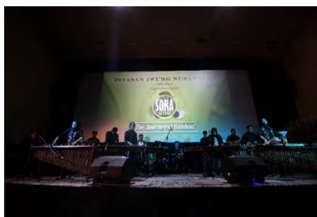
Gambar 4.13. The Journey of Bamboo

Pertunjukan “The Journey Of Bamboo” dilaksanakan pada tanggal 9 Maret 2019 yang digelar di Bandung Creative HUB (Auditorium Lt.3) dengan dua sesi, sesi pertama pukul 15.30 WIB dan sesi kedua pukul 19.30 WIB.