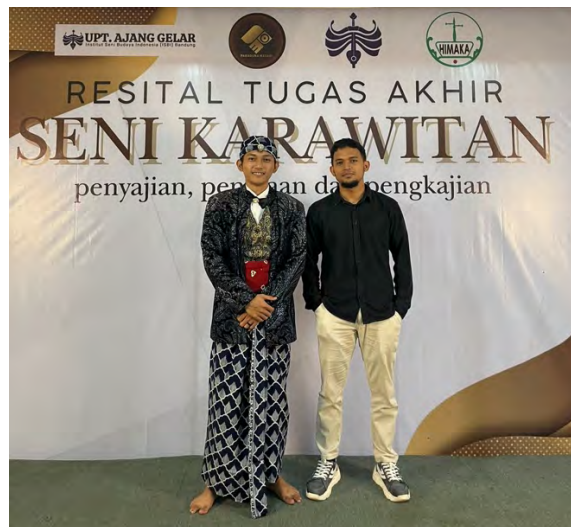
Gambar 16. Dokumentasi bersama pembimbing 1.