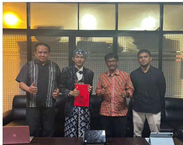
Gambar 15. Dokumentasi bersama penguji.