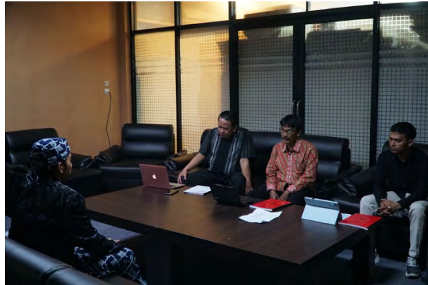
Gambar 13. Dokumentasi pelaksanaan sidang komprehensif.