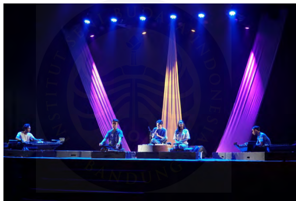
Gambar 11. Dokumentasi gladi bersih.