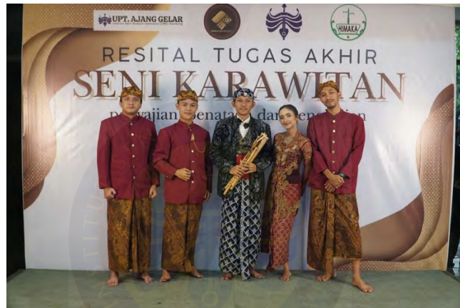
Gambar 14. Dokumentasi bersama pendukung.