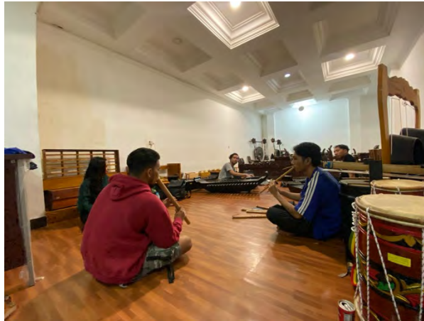
Gambar 10. Dokumentasi bimbingan karya.