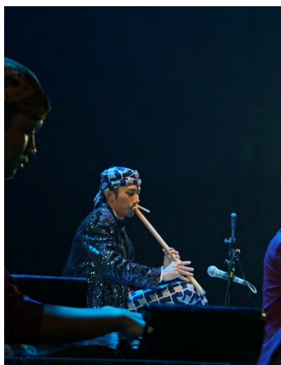
Gambar 12. Dokumentasi pelaksanaan Ujian Tugas Akhir.