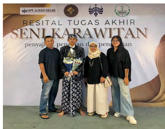
Gambar 18. Dokumentasi bersama keluarga.