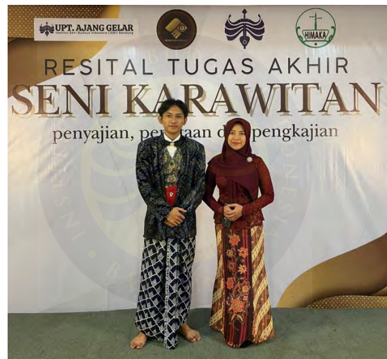
Gambar 17. Dokumentasi bersama pembimbing 2.