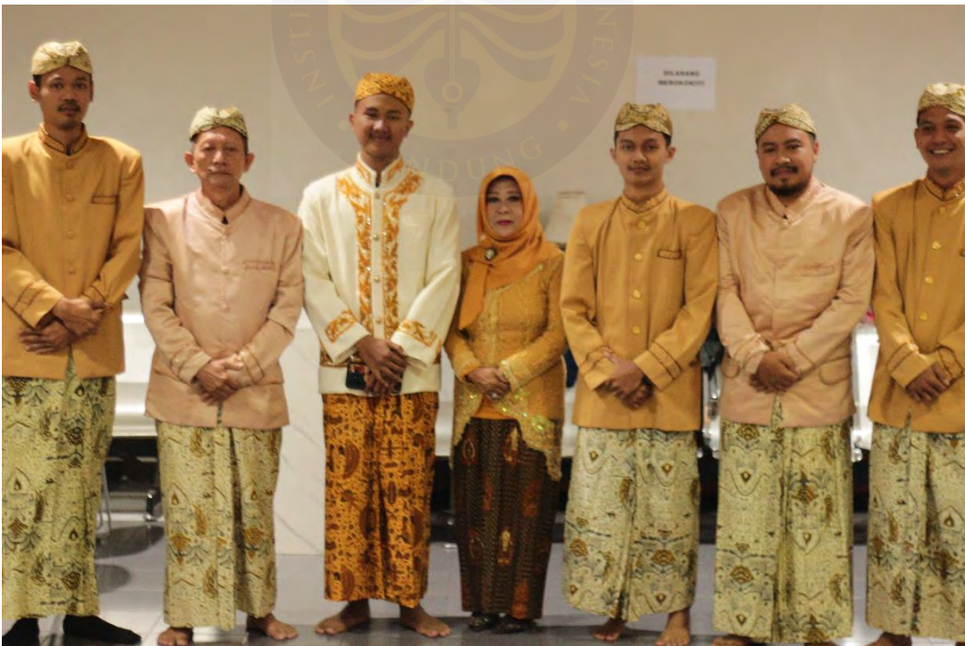
Lampiran 4 Bersama Pendukung