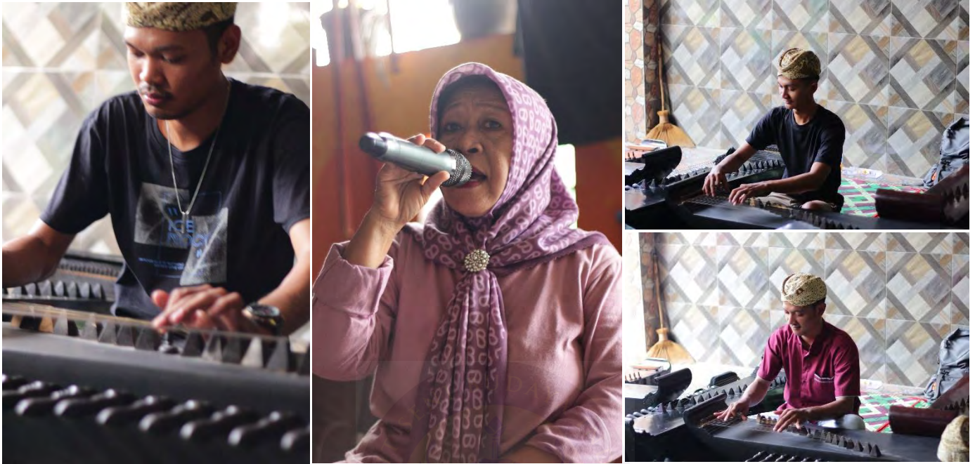
Lampiran 1 Proses Latihan (Dokumentasi Pribadi)