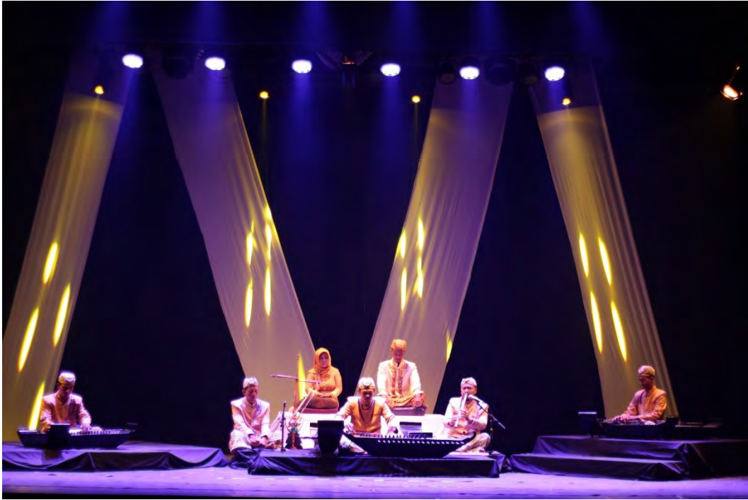
Lampiran 3 Pelaksanaan Tugas Akhir (Dokumentasi Pribadi)