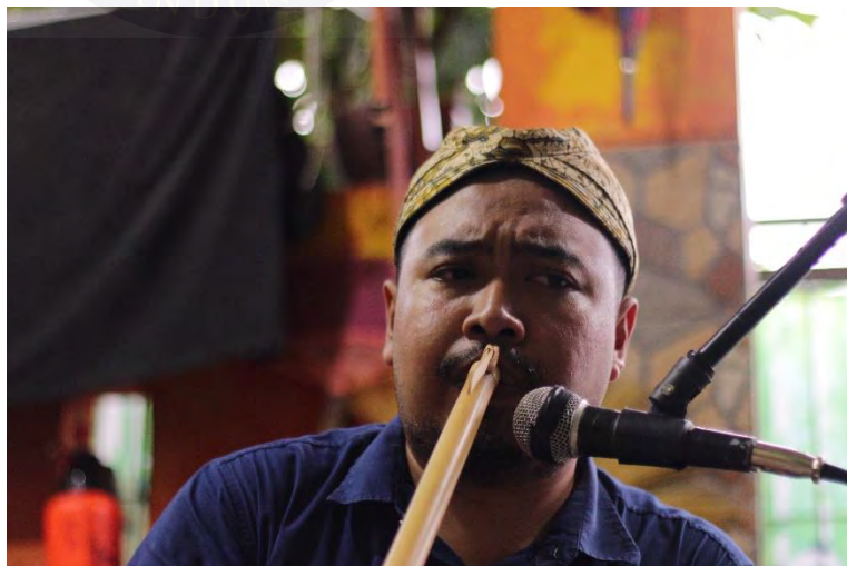
Lampiran 2 Proses latihan