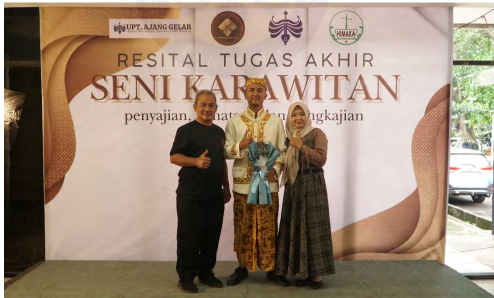
Lampiran 6 Bersama Orang Tua (Dokumentasi Panitia Resital)