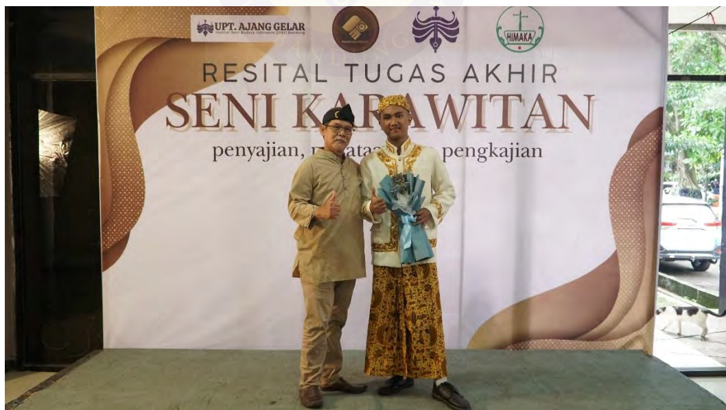
Lampiran 8 Bersama Pembimbing Lapangan (Dokumentasi Panitia Resital)