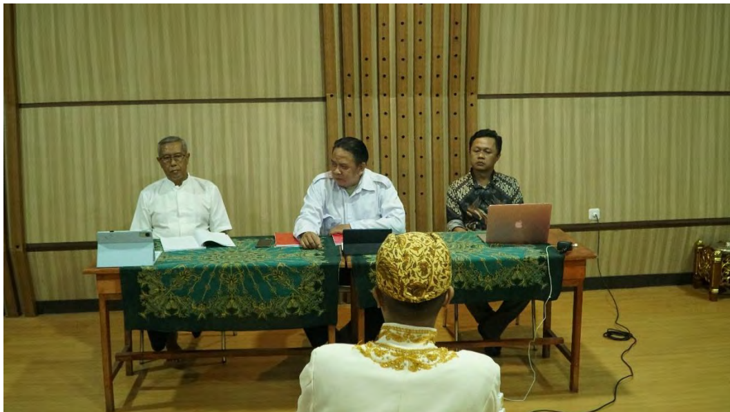
Lampiran 5 Sidang Komprehensif (Dokumentasi Panitia Resital)