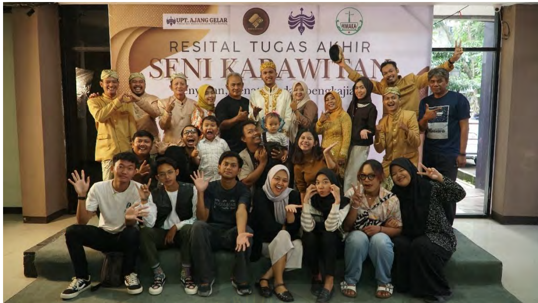
Lampiran 7 bersama Teman-teman (Dokumentasi Panitia Resital)