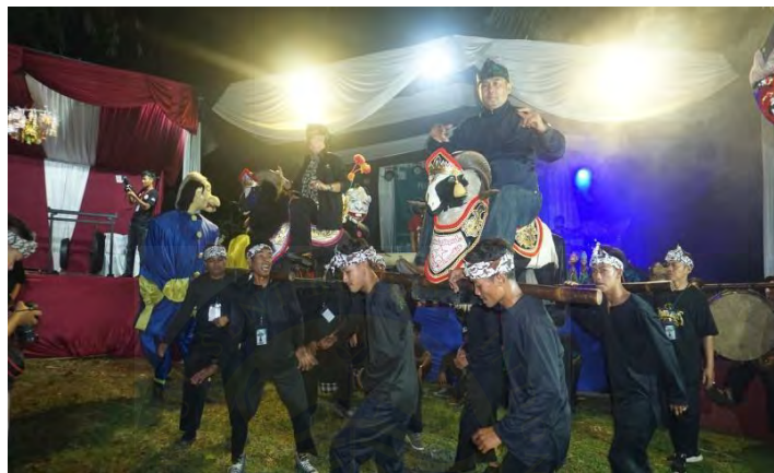
Gambar 4. 6 Dodombaan

ditanggunggi oleh tamu istimewa dan diangkat oleh empat pemuda yang bergerak sesuai dengan irama musik tradisional Sunda. Gerakan mereka bukanlah sembarangan; ada pola tertentu yang mengikuti ketukan musik, dan semuanya dilakukan dengan menjaga keseimbangan pada boneka serta tamunya.