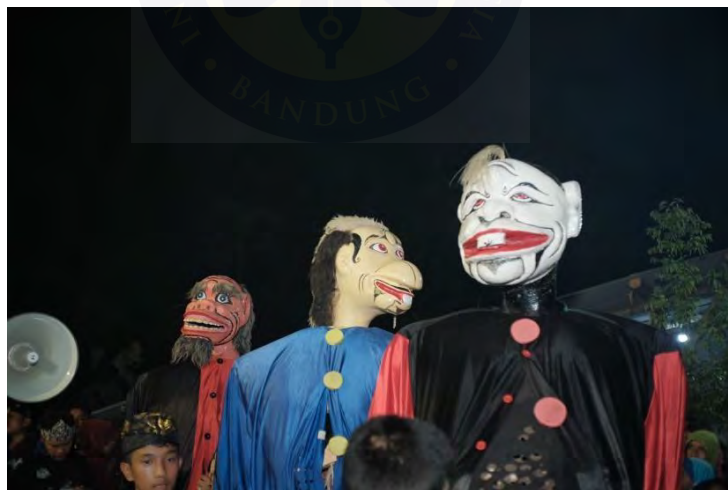
Gambar 4. 7 Badawang

Sebuah pertunjukan seni penting lainnya dalam tradisi Mapag Menak yang menarik perhatian di Desa Nagrak adalah badawang. Keduanya dodombaan dan badawang selalu hadir bersama dalam prosesi, menjadi fokus utama sekaligus lambang kekuatan budaya setempat. Badawang merupakan boneka besar berbentuk manusia, biasanya terbuat dari rangka bambu yang dibalut kain dan dihias dengan cara tertentu. Tingginya bisa mencapai dua hingga tiga meter, dengan kepala besar dan ekspresi wajah yang mencolok—kadang terlihat lucu, kadang menyeramkan, tergantung pada tema yang diangkat. Boneka ini digerakkan oleh seseorang yang berada di dalamnya, mirip dengan ondel-ondel dari Betawi, tetapi memiliki gaya yang khas Sunda.