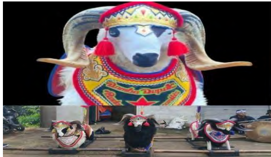
Gambar 4. 8 Dodombaan

bareng, saling jaga keseimbangan, dan nunjukin kekompakan warga.” (Abah Aju, Tokoh Tradisi Mapag Menak)