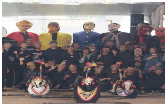
Gambar 4. 1 Tokoh-tokoh Mapag Menak

Tradisi Mapag Menak yang terdapat di Desa Nagrak merupakan salah satu bentuk penghargaan dan penyambutan kepada tamu yang sangat unik dalam budaya Sunda. Istilah “mapag” berarti menyambut, sementara “menak” menunjukkan orang-orang terhormat atau penting. Dengan demikian, Mapag Menak dapat diartikan secara harfiah sebagai sambutan untuk orang-orang yang dihormati. Namun, ini lebih dari sekadar upacara resmi ini adalah saat yang kaya akan nilai budaya sebuah peristiwa yang sarat makna.