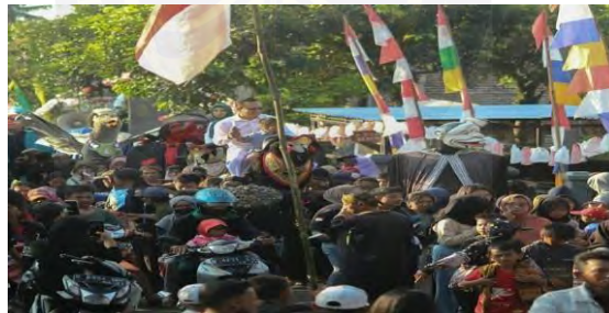
Gambar 4. 2 Helaran Mapag Menak

Di saat upacara mulai, terdapat pawai (helaran) yang diiringi musik tradisional, salah satunya lagu Sabilulungan yang menggambarkan arti penting gotong royong. Menariknya, tamu kehormatan biasanya “diarak” menggunakan dodombaan, yaitu semacam boneka besar berbentuk domba yang dipanggul dan ditarikan oleh empat orang. Ini bukan hanyalah sarana hiburan, tetapi juga simbol penghormatan dan ekspresi seni.