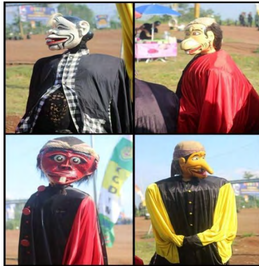
Gambar 4. 9 Badawang