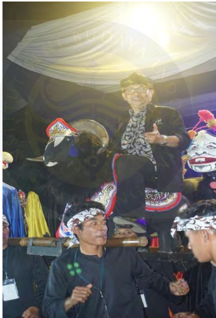
Gambar 4. 5 Bapak Dekan di arak oleh Dodombaan