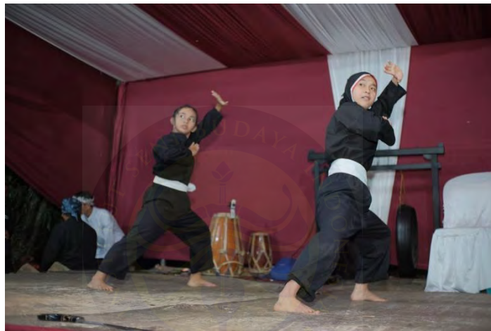
Gambar 4. 10 Pencak Silat Desa Nagrak

Tampilan pencak silat di acara-acara bukan sekadar menunjukkan kemampuan bela diri, melainkan juga berfungsi sebagai lambang perlindungan terhadap martabat dan nilai-nilai budaya. Ini menegaskan bahwa budaya seharusnya tidak hanya ditunjukkan, tetapi juga dilestarikan dan dipertahankan.