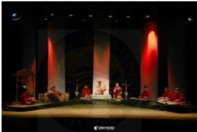
Gambar 11 Foto Sajian