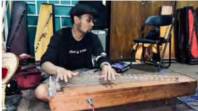
Gambar 7 Dokumentasi Latihan