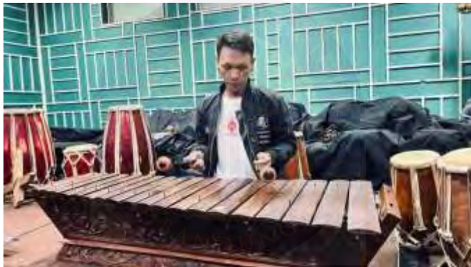
Gambar 8 Dokumentasi Latihan