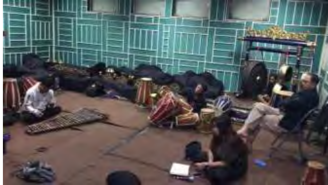
Gambar 1 Dokumentasi Latihan