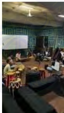
Gambar 2 Dokumentasi Latihan