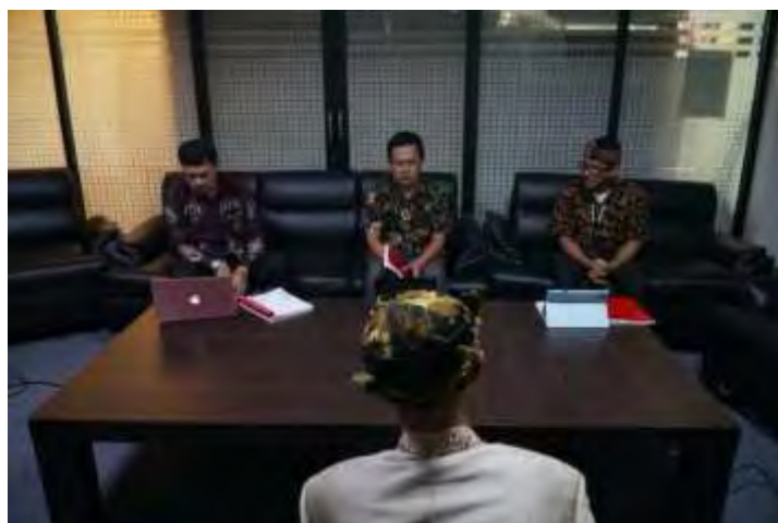
Foto 12 pelaksanaan sidang