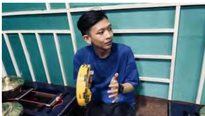
Gambar 6 Dokumentasi Latihan