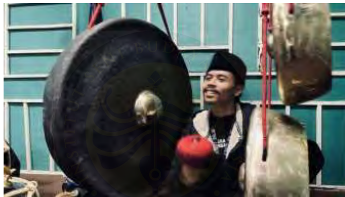
Gambar 5 Dokumentasi Latihan