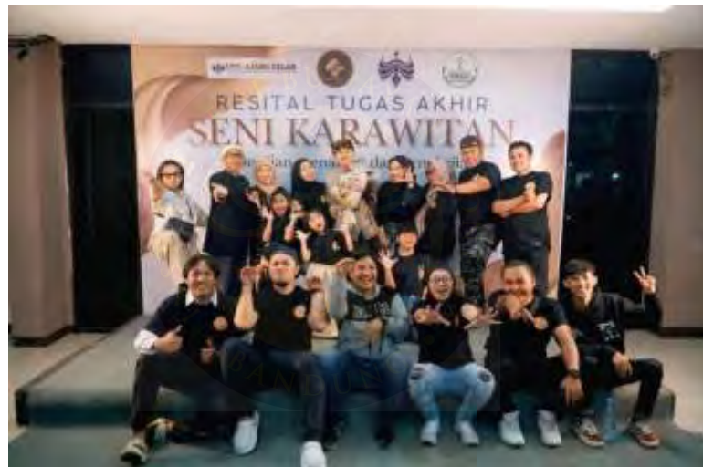
Foto 14 bersama Keluarga Besar