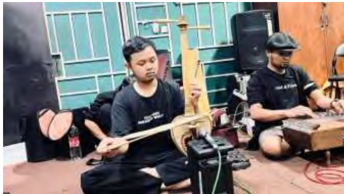
Gambar 4 Dokumentasi Latihan