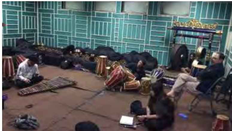
Gambar 10 Dokumentasi Bimbingan