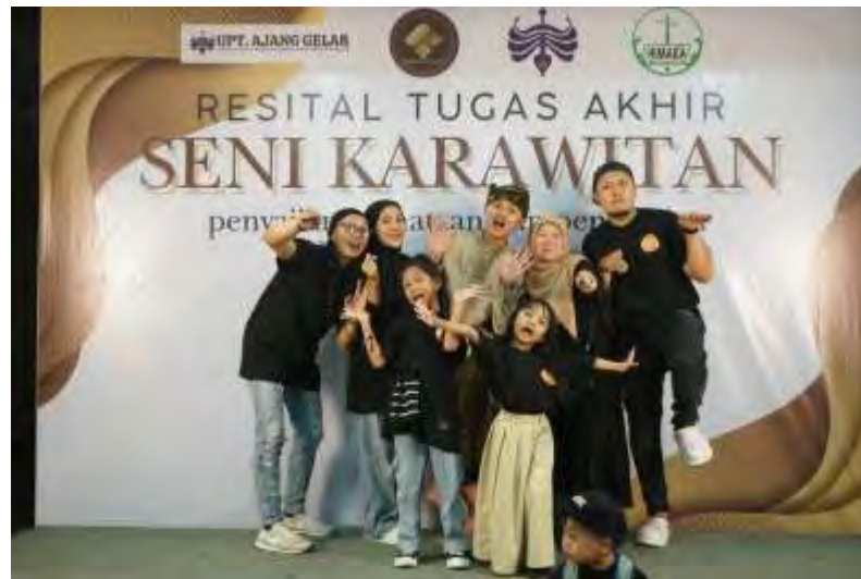
Foto 13 bersama Ibu dan Kakak-kakak