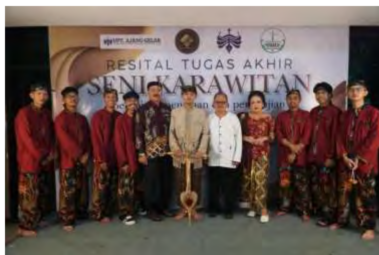
Foto 15 bersama pendukung dan pembimbing