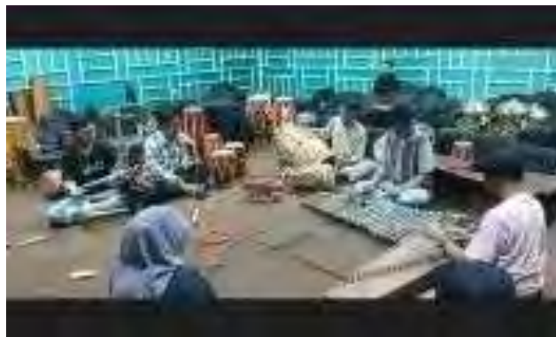
Gambar 3 Dokumentasi Latihan