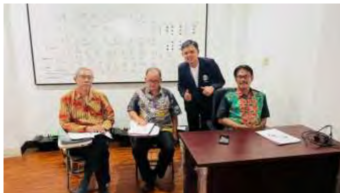
Gambar 9 Dokumentasi Kolokium