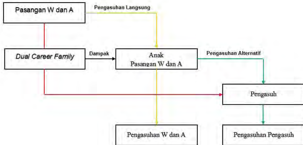
Bagan 4.2 Alur Pengasuhan Anak Keluarga W dan A

Serupa dengan N, W ketika kecil mengalami pengasuhan alternatif di mana W banyak diasuh oleh kerabat dari orang tuanya dikarenakan kedua orang tua W sama-sama bekerja sebagai buruh di industri kain tekstil pada waktu yang bersamaan serupa dengan yang terjadi pada anak W saat ini.