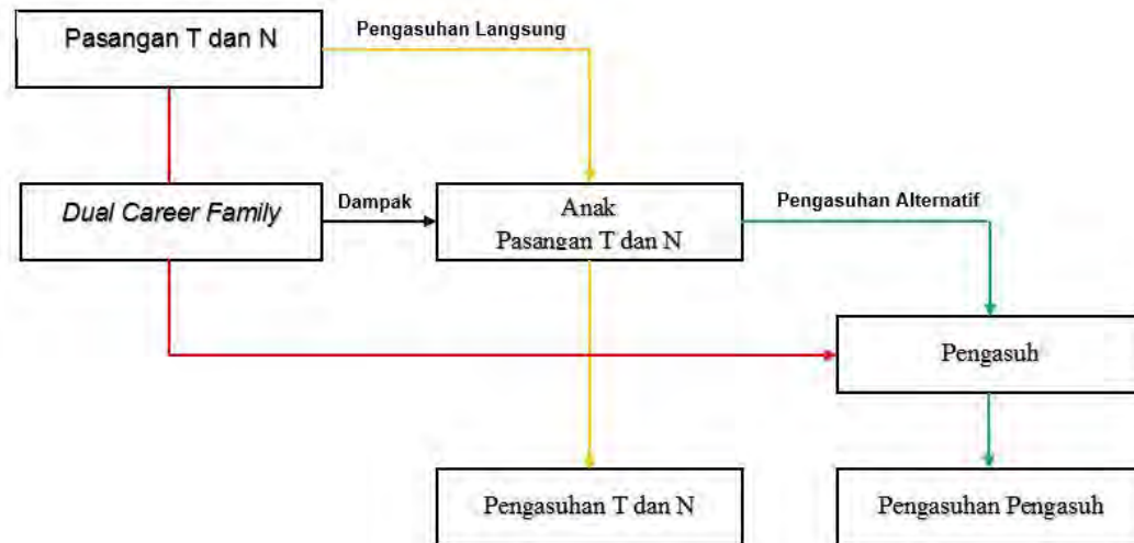
Bagan 4.1 Alur Pengasuhan Anak Keluarga T dan N

Model budaya peran pengasuhan anak pada keluarga N ternyata sudah terjadi ketika N berusia anak-anak, N menjelaskan bahwa ketika dia kecil orang tua N memiliki usaha perdagangan yang mengharuskan orang tua dari N pada satu waktu lebih banyak menghabiskan waktunya dengan kegiatan tersebut yang berakibat pada pengasuhan N yang lebih banyak diperankan oleh kerabatnya.