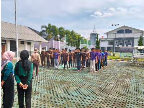
Gambar 1 - Pramuka