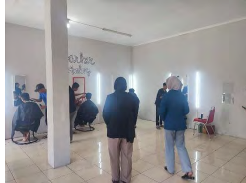
Gambar 2 - Mencukur