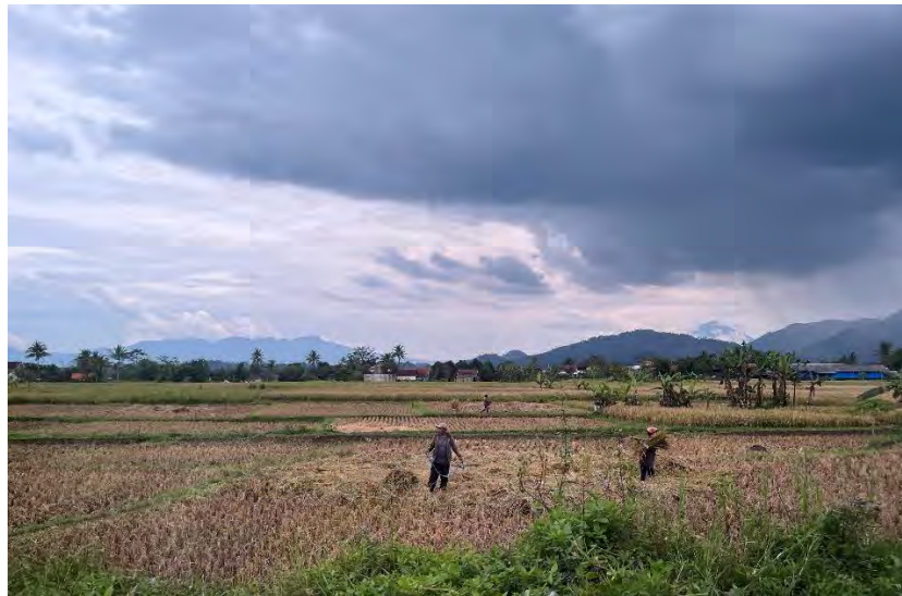
Gambar 2. 1 Para Petani di Desa Wanakerta

larangan), hingga tradisi Mitembeyan Tandur mencerminkan hubungan harmonis antara manusia, alam, dan leluhur.