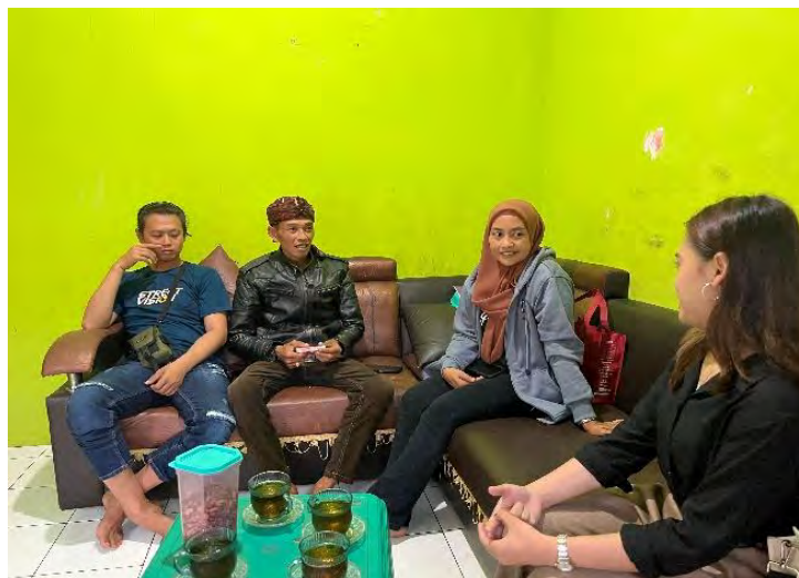
Gambar 4. 4 Ketua serta pemain Seni Gondang Buhun