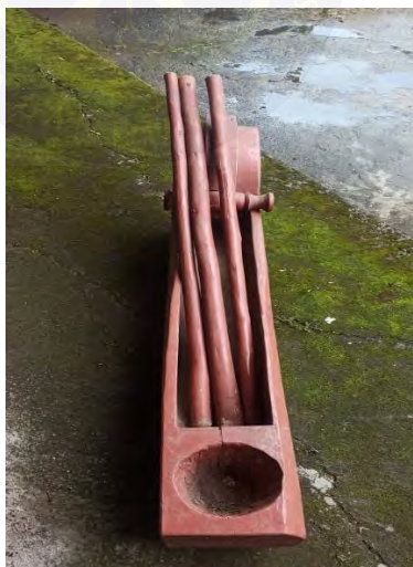
Gambar 4. 6 Lesung dan Alu

Dalam konteks masyarakat agraris di Indonesia, khususnya di kalangan masyarakat sunda di Kabupaten Garut, Lesung digunakan sebagai alat penumbuk padi dalam pertanian masyarakat tradisional. Tetapi selain itu, Lesung juga dikatakan sebagai artefak budaya yang juga memiliki kedudukan simbolik dalam struktur sosial dan kosmologis masyarakat. Secara material, Lesung terbuat dari kayu. Pada zaman dahulu, Lesung terbuat dari kayu nangka atau kayu jambu agar lebih kokoh, namun pada saat ini kayu nangka sulit ditemukan, jadi Lesung dibuat sendiri oleh masyarakat setempat menggunakan kayu biasa yang ada. Lesung dibentuk menyerupai palung memanjang.