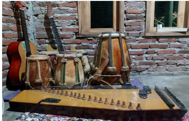
Gambar 4. 8 Alat musik pengiring Gondang Buhun

“Kalau untuk perlombaan kita masih menggunakan yang buhun, jadi memang betul-betul musik yang dikeluarkan itu dari Lesung, kacapi, suling, kendang. Tetapi untuk hiburan di Desa-desa biasanya ada tambahan musik modern juga sebagai pengiring” (Wawancara, dengan Ibu Cuncun, 18 April 2025)