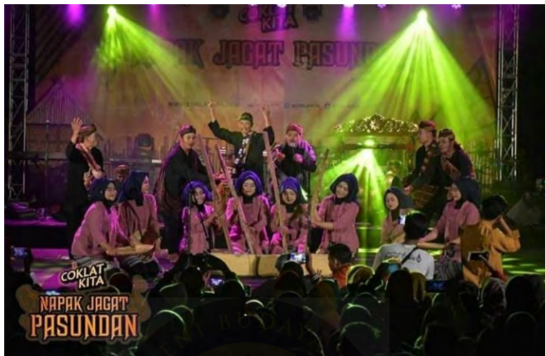
Gambar 4. 7 Pertunjukan Seni Gondang Buhun

dimainkan dengan ritme yang lambat dan penuh kehati-hatian. Irama awal ini disebut sebagai ngawitan, yaitu pertanda dimulainya acara yang sifatnya sakral.