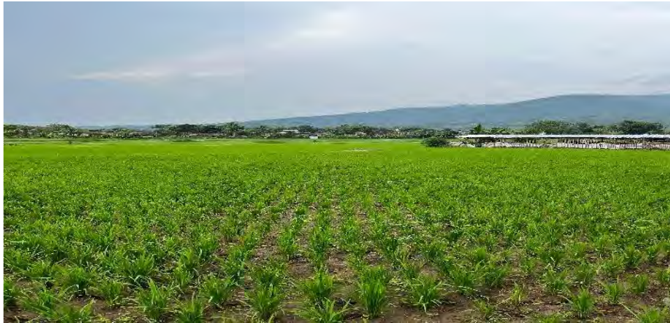
Gambar 4.3 Lahan Pertanian di Desa Wanakerta