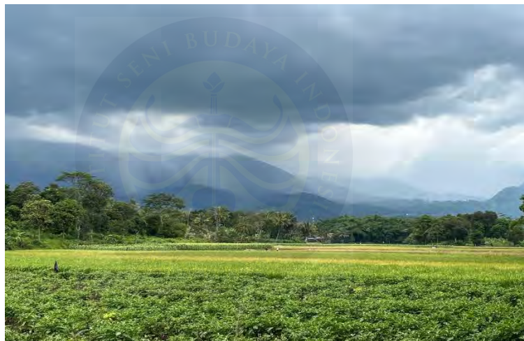
Gambar 4. 1 Desa Wanakerta Kecamatan Cibatu

Lokasi penelitian berada di Desa Wanakerta Kecamatan Cibatu Kabupaten Garut, tepatnya di Lingkungan Seni Pamager Sari yang berada di Kampung Panyongsogan.