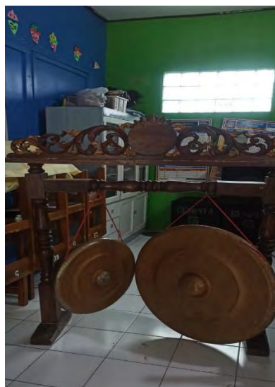
Gambar 4. 9 Alat musik pengiring Gondang Buhun

Ada juga yang menambahkan tarian atau gerakan simbolik sederhana, seperti gerakan menanam padi, mengambil air, atau menumbuk hasil panen, yang menggambarkan kehidupan agraris masyarakat Sunda.