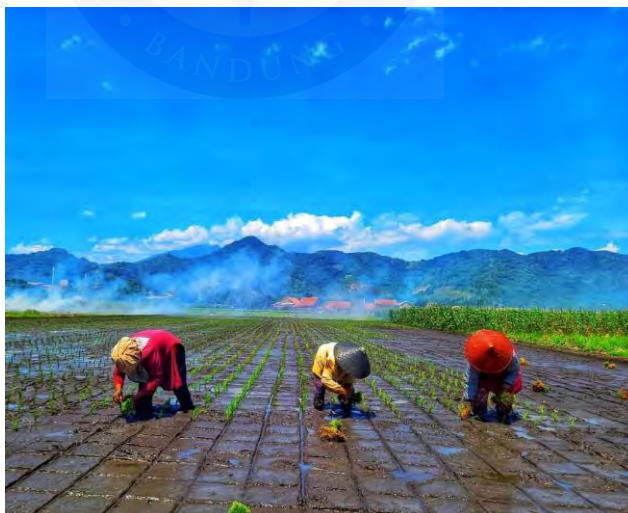
Gambar 4. 5 Tanam Mundur di Lahan Pertanian

Tradisi didefinisikan sebagai setiap bentuk karya, gaya, konvensi, atau kepercayaan yang direpresentasikan sebagai kelanjutan dari masa lalu ke masa kini. Tradisi, dengan demikian, adalah sesuatu yang tidak pernah berubah dan dijalankan sebagai pengulangan-pengulangan. Prof Yasraf dalam bukunya Transestetika , juga mengatakan bahwa, tradisi adalah aneka bentuk, prinsip, konsep, pranata, tingkah laku, ekspresi, norma, dan nilai-nilai yang telah didefinisikan di masa lalu secara kolektif dan diwariskan secara turun temurun.