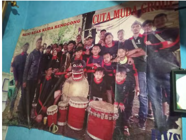
Gambar 25. Foto anggota Grup Cuta Muda