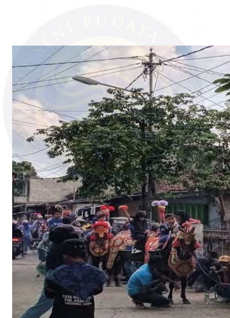
Gambar 26. Foto Kuda Rengong dalam Pertunjukan Reak Grup Cuta Muda