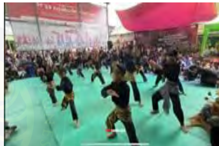
Gambar 4. 2 Kegiatan Silaturahmi Silaturasa