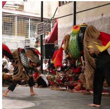
Gambar 4. 3 Kegiatan Latihan Bersama Paguyuban

Kegiatan pertama "Silaturahmi Silaturasa" mempunyai beberapa harapan yaitu dapat menciptakan ikatan yang lebih kuat antara anggota dari 16 lingkung seni Ulin Barong Sekeloa serta meningkatkan partisipasi masyarakat dalam kegiatan seni dan budaya agar dapat mengetahui aya kesenian di Sekeloa dan pentingnya menjaga kesenian Ulin Barong Sekeloa. kegiatan ini juga dapat menjadi esempatan bagi para anggota untuk saling bebagi pengalaman dan pengetahuan kepada satu sama lain agar dapat memperkaya wawasan dan keterampilan masing-masing individu dalam kesenian Ulin Barong Sekeloa.