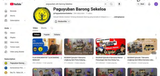
Gambar 4. 6 Dokumentasi Youtube Ulin Barong Sekeloa