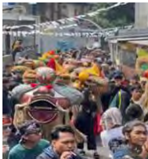
Gambar 4. 1 Arak-arakan