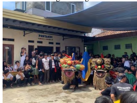
Gambar 4. 4 Kegiatan Ngawal taun 2025