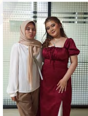
Gambar 11 Bersama Adiks