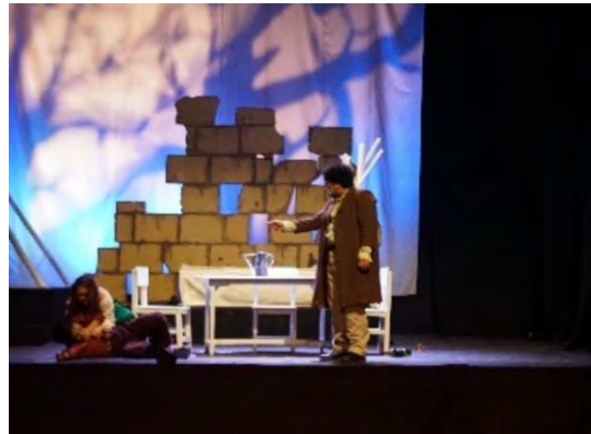
Gambar 16 Pertunjukan