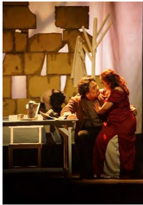
Gambar 13 Pertunjukan