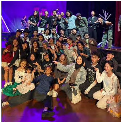
Gambar 18 Bersama Kawan Angkatan Teater 21