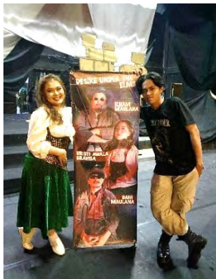
Gambar 15 Bersama Suami