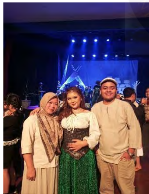
Gambar 12 Bersama Orang Tua