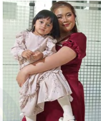
Gambar 14 Bersama Buah Hati