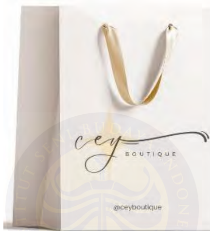
Gambar 5. 5 Packaging/kemasan

Pengemasan dapat memberikan nilai lebih pada image brand , pengemasan juga memiliki fungsi untuk membungkus atau melindungi produk dari kerusakan sehingga kualitasnya tetap terjaga. Bentuk kemasan juga bermacam-macam seperti box , paper bag , plastic . Kemasan yang digunakan oleh pengkarya berupa Paper bag . Berikut merupakan bentuk kemasan dari brand /merek ceyboutique :