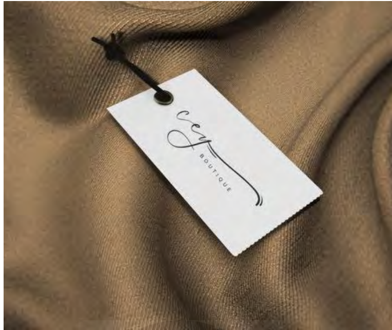
Gambar 5. 3 Hangtag