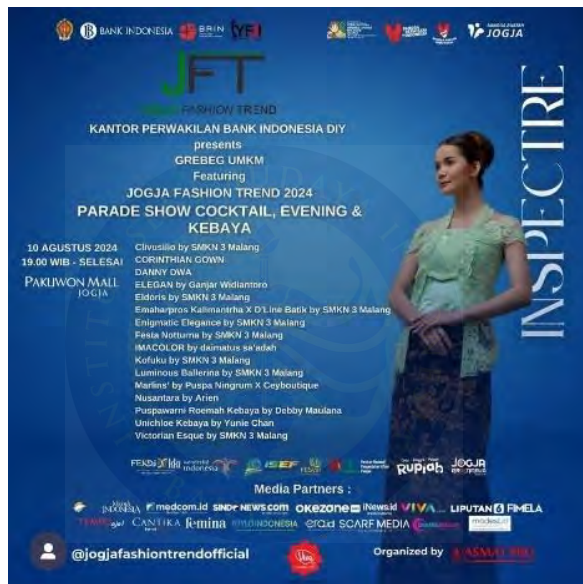
Gambar 5. 6 Jogja Fashion Trend (JFT)

On-event merupakan hari Dimana acara fashion show digelar. Menampilkan koleksi busana karya designer, brand , maupun fashion school . Kegiatan ini meliputi loading barang, merapikan dan mempersiapkan busana yang akan di tampilkan pada fashion show , gladi resik, pemakaian busana pada model, dan yang terakhir fashion show . Koleksi yang ditampilkan berjumlah 8 look .