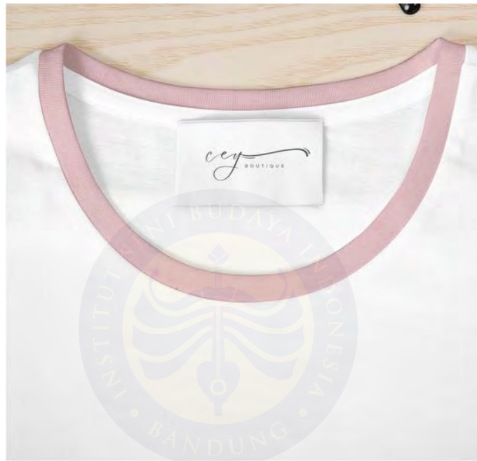
Gambar 5. 2 Label

Label merupakan keterangan kata kata atau gambar yang berfungsi ebagai sumber informasi pada produk. Label pada brand ini yaitu berisi keterangan logotype Cey Boutique dan keterangan made in Indonesia sebagai identitas produk lokal. Berikut label dari brand /merek Cey Boutique :