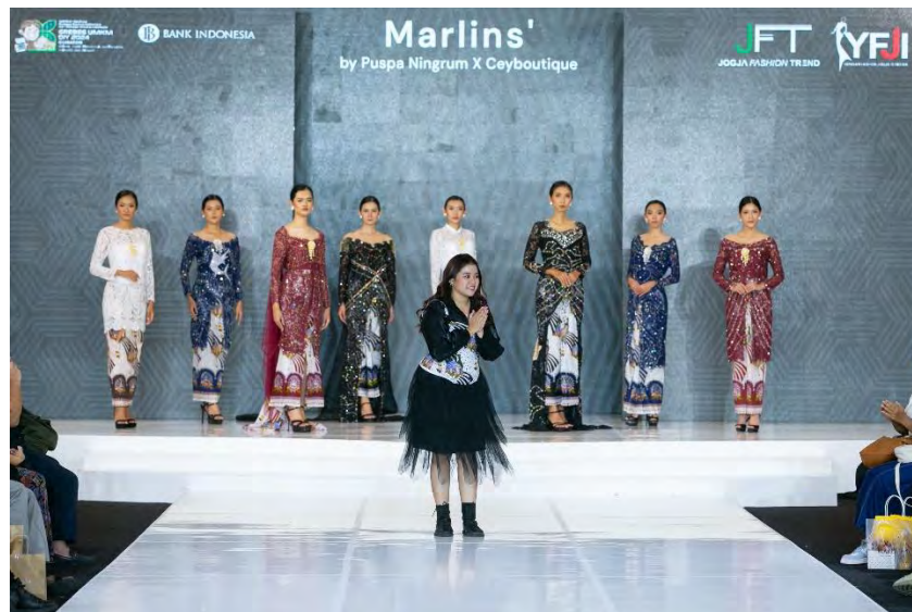
Gambar 5. 8 Fashion Show

Acara fashion show disiarkan melalui live di media sosial youtube sebagai media promosi Jogja Fashion Trend untuk jangkauan lebih luas berikut merupakan dokumentasi live fashion show pada media social youtube melalui channel Kantor Perwakilan Bank Indonesia DIY