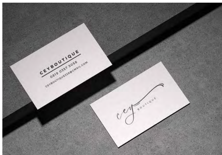
Gambar 5. 4 Kartu Nama

Kartu nama biasanya bersisi informasi mengenai brand /merek, logo brand /merek, kontak yang bisa dihubungi, akun media social, dan Alamat Perusahaan. Kartu nama yang dibuat oleh pengkarya berbahan art paper dengan ukuran 4cm x 5cm. berikut kartu nama dari brand /merek Cey Boutique: