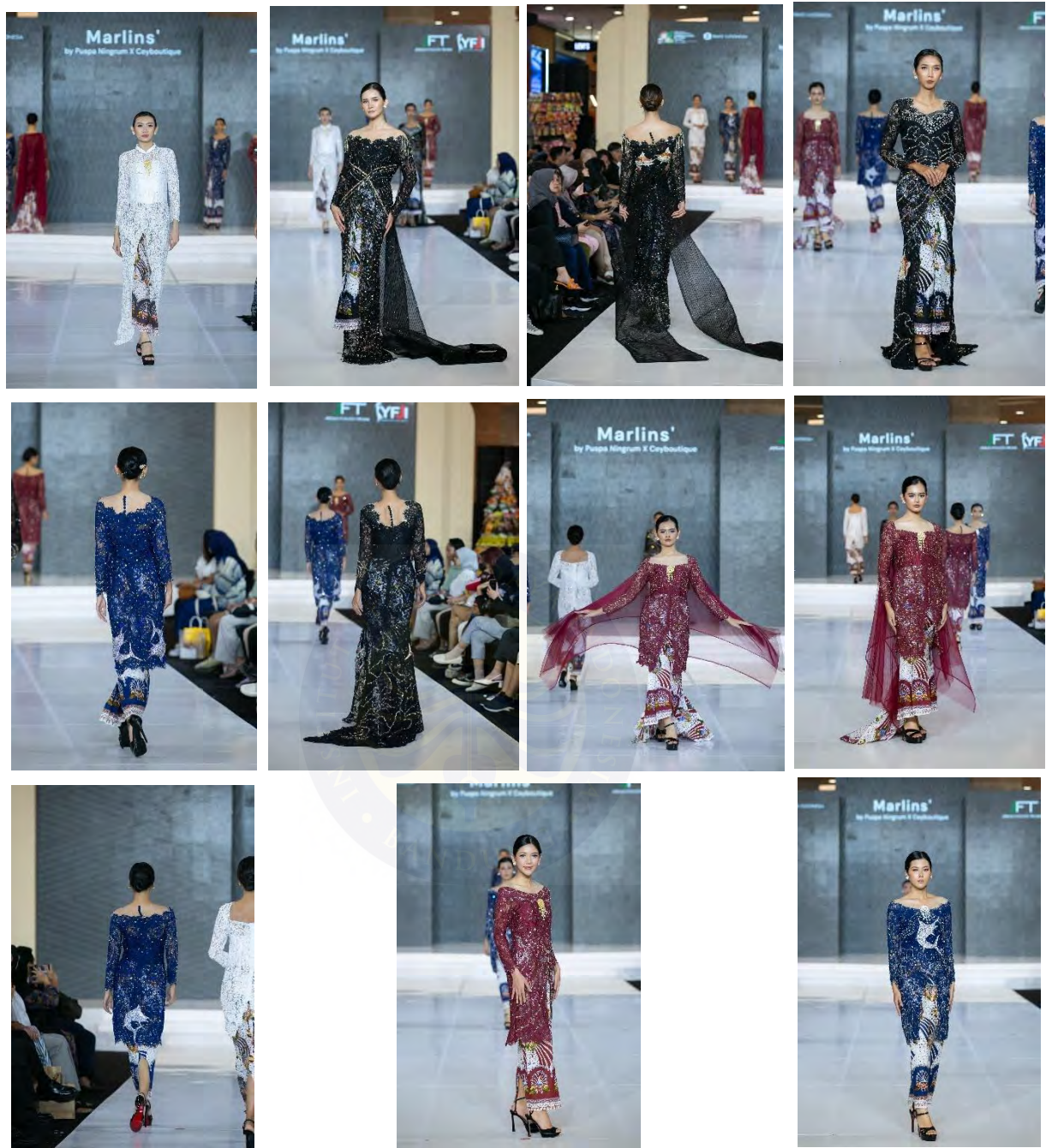
Gambar 5. 7 Fashion Show