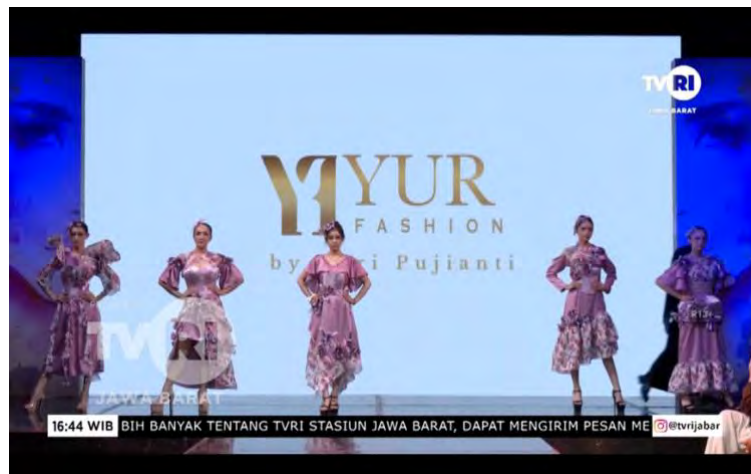
Gambar 5. 4 Fashion Show (Sumber : Yuri Pujianti, 2025)