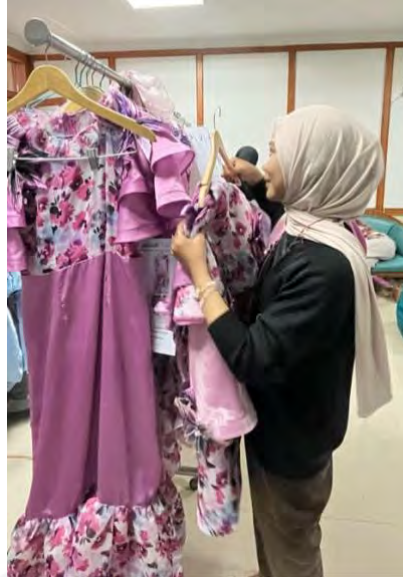
Gambar 5. 2 Persiapan Busana Untuk Fashion Show

Berikut adalah keadaan di backstage sebagai tempat persiapan desainer untuk menyiapkan busana yang akan diperagakan oleh model.