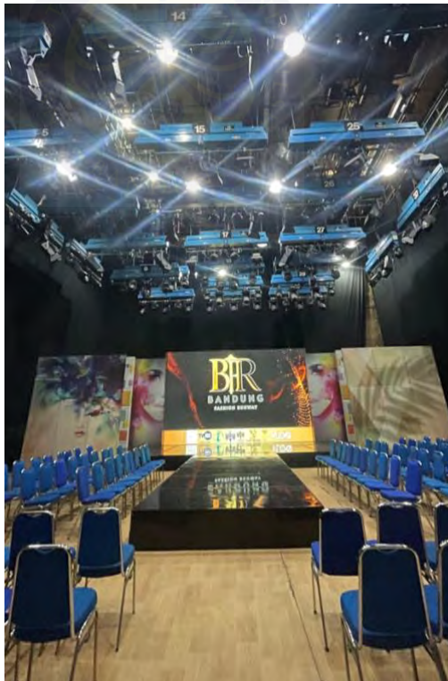
Gambar 5. 1 Stage Runway

Tema yang di usung pada acara Bandung Fashion Runway ini adalah “Spectrum of Shape” yaitu koleksi yang mengeksplorasi teknik dan dimensi bentuk pada busana. Panggung area catwalk berbentuk persegi panjang, di bagian kanan dan kiri terdapat kursi penonton yang bisa melihat detail busananya. Terdapat LED Screen pada bagian tengah panggung.