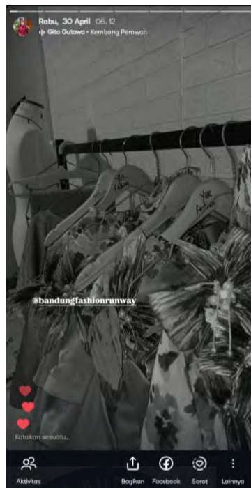
Gambar 5. 11 Unggahan Progres Di Akun Pribadi