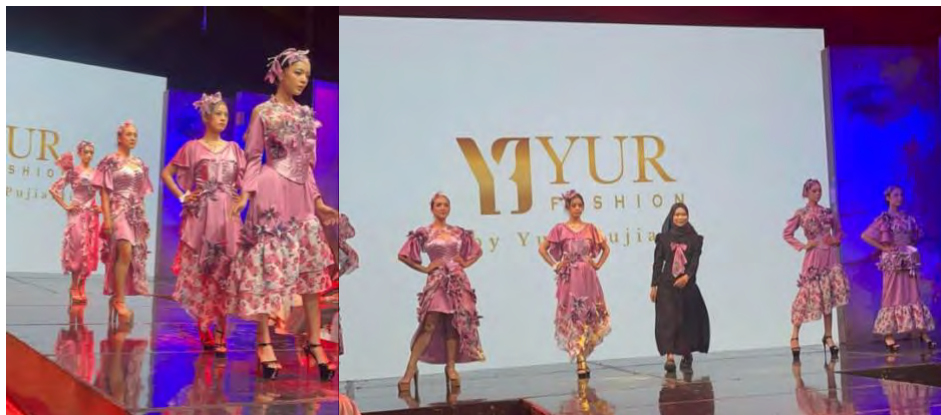
Gambar 5. 3 Fashion Show

Penampilan para model ketika runway busana, setiap model berjalan dan berhenti di titik tertentu untuk berpose dengan memperlihatkan bentuk dan detail hiasan busana kepada audiens .