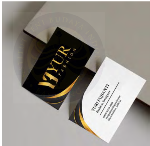
Gambar 5. 8 Desain Kartu Nama

Kartu nama berisi informasi mengenai pemilik brand , nama perusahaan, nomor handphone , Instagram brand , email dan web. Berikut adalah desain kartu nama yang dibuat oleh pengkarya :