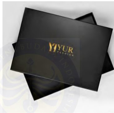
Gambar 5. 10 Desain Box