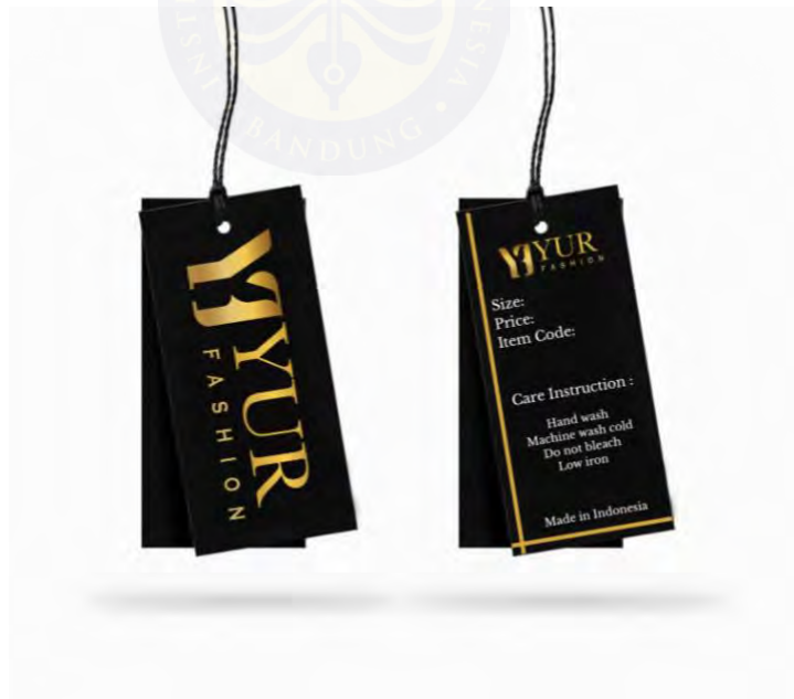
Gambar 5. 6 Desain Hangtag

Hangtag sebagai media informasi keterangan mengenai produk seperti logo, size, negara pembuatan, dan cara perawatan produk. Bagian depan terdapat logo dan di bagian belakang terdapat keterangan informasi mengenai produk dan cara perawatannya. Cara merawat produk tugas akhir ini adalah dengan dry clean (pencucian tanpa air), setrika dengan suhu rendah/uap, dan busana disarankan untuk digantung agar tidak kusut. Berikut adalah hangtag brand “YUR Fashion” .