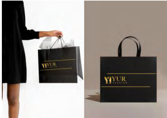
Gambar 5. 9 Desain Paper Bag