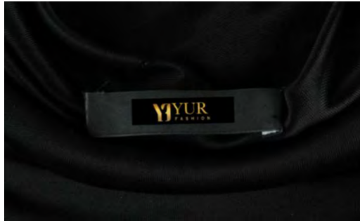
Gambar 5. 7 Desain Label

Kartu nama berisi informasi mengenai pemilik brand , nama perusahaan, nomor handphone , Instagram brand , email dan web. Berikut adalah desain kartu nama yang dibuat oleh pengkarya :