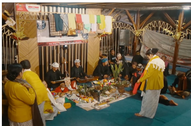
Gambar 2. Pertunjukan upacara adat Ngalaksa Rancakalong, Sumedang (2025)

Suasana pertunjukan Tarawangsa umumnya diwarnai kesakralan dan pertunjukannya biasanya dilakukan pada malam hari, diawali dengan doa dan sesajen sederhana. Para pemain duduk menghadap penonton, sementara itu penonton mengapresiasi dan ada juga yang ikut menari pada pertunjukannya.