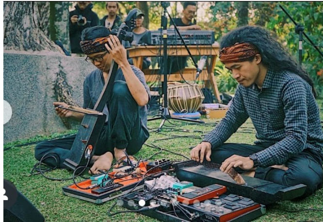
Gambar 18. Detail instrument Tarawangsa dan penggunaan efek digital dalam pertunjukan Trawangsawelas

Melalui pendekatan visual dan sonic 35 yang saling melengkapi, Tarawangsa berhasil menghadirkan pengalaman estetika yang tidak hanya bersifat audiotori, tetapi juga spiritual dan reflektif. Kombinasi antara tradisi dan teknologi modern terlihat jelas dalam bagaimana mereka memanfaatkan ruang pertunjukan, tata cahaya, serta perangkat digital untuk memperluas makna bunyi tanpa menghilangkan esensi sakral Tarawangsa itu sendiri, pendekatan pertunjukan yang demikian menjadi pintu masuk penting untuk memahami bentuk dan karakter musik Tarawangsa secara lebih