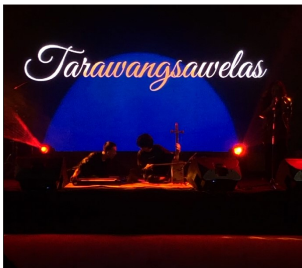
Gambar 17. pertunjukan Tarawangsawelas dengan pencahayaan temaram dan atmosfer ritualistik di Bandung

Dalam setiap pertunjukan, ruang dan pencahayaan memainkan peran penting dalam membentuk pengalaman bunyi. Warna merah sering digunakan sebagai simbol energi dan spiritualitas, sementara keheningan di antara bagian-bagian musik menjadi ruang reflektif bagi penonton. Teguh Permana menjelaskan bahwa pencahayaan bukan sekedar elemen visual, tetapi bagian dari “ritual bunyi” yang membantu membangun suasana kontemplatif. Setiap detail, mulai dari posisi pemain, arah cahaya, hingga resonansi ruang, direncang untuk menciptakan kesatuan antara pendengaran, pemain, dan bunyi yang hidup di ruang tersebut.