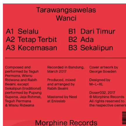
Gambar 16. Label Album Wanci (2017)

menghadirkan pengalaman fisik dan spiritual yang lebih dalam karena setiap putaran jarum pada piringan adalah simbol dari waktu yang terus berjalan.