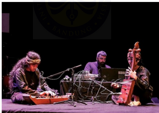
Gambar 4. Kolaborasi bersama Rabih Beaini di Rewire Festival

Perjalanan artistik 14 Tarawangawelas mencapai titik penting pada tahun 2017, ketika mereka berkolaborasi dengan Rabih Beaini, seorang musisi dan produser asal Lebanon yang juga pendiri label Morphine Records 15 di Jerman. Pertemuan ini bermula dari jejaring etnomusikolog dan musisi internasional yang tertarik dengan musik tradisional Sunda. Melalui kolaborasi tersebut, Tarawangawelas mendapat kesempatan untuk tampil di berbagai festival musik internasional.