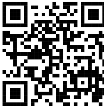
Gambar 8. Kode QR akses digital album Wanci di Bandcamp