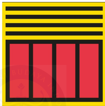
Gambar 7. Visual Album Wanci (2017) (Dokumentasi pribadi Teguh Permana, Instagram Tarawangawelas 2024)

namun bagi Teguh, istilah ini tidak sekedar menunjukkan pengertian kronologis, melainkan juga kesadaran akan perubahan, siklus, dan transendensi manusia terhadap ruang dan waktu.