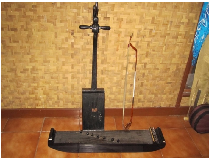
Gambar 1. Alat Musik Tradisional Tarawangsa

Instrument utama dalam kesenian ini terdiri dari Tarawangsa 9 (alat gesek bersenar dua) dan Jentreng 10 (alat petik bersenar tujuh).