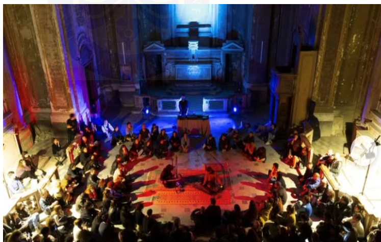
Gambar 6. Europa tour 2023

Teguh dalam Tarawangsa . Hal ini terlihat melalui dokumentasi pertunjukan mereka di beberapa festival internasional yang diunggah pada kanal resmi Tarawangsa , di mana audiens tampak menikmati pertunjukan dalam suasana hening, reflektif, dan penuh perhatian. Berdasarkan observasi penulis, respon tersebut menunjukkan bahwa dorongan eksternal terhadap kreativitas Teguh Permana tidak hanya berasal dari lingkungan lokal, tetapi juga dari apresiasi global terhadap nilai-nilai tradisi yang dibalut inovasi.