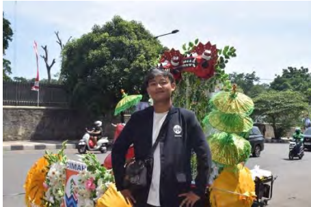
Acara Capgomeh Bogor