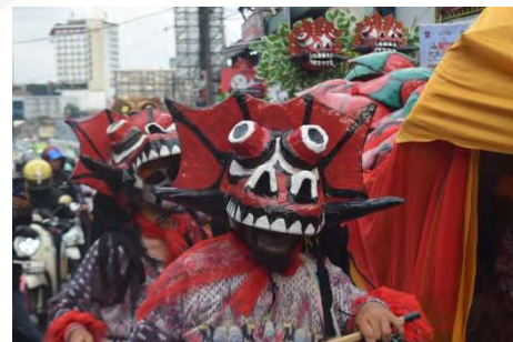
Bangbarongan Munding Dongkol