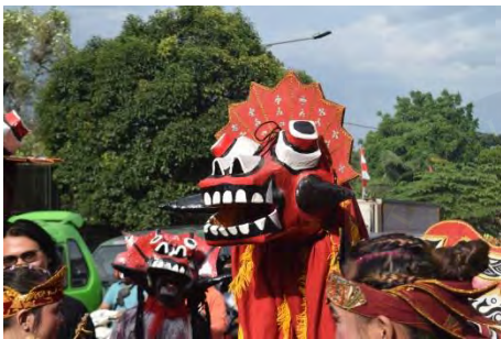
Bangbarongan Munding Dongkol