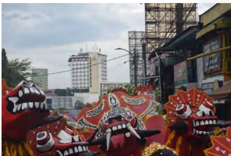
Bangbarongan Munding Dongkol