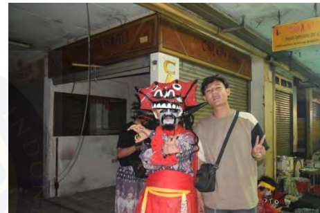
Fitra dan Barong