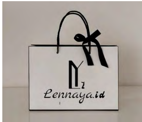
Gambar 5. 7 Packaging Brand Lennaya.id

Berikut adalah packaging pada brand Lennaya.id: