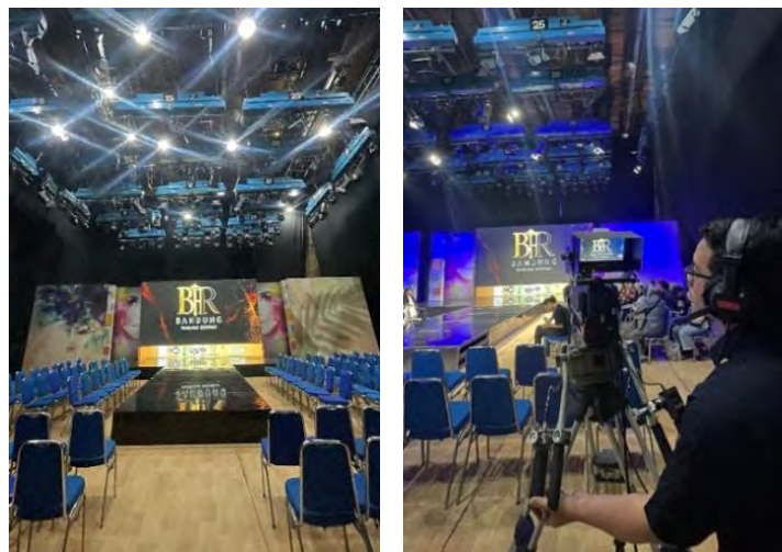
Gambar 5. 1 Stage Bandung Fashion Runway TVRI Jawa Barat 2025

Konsep fashion show pada acara ini berbentuk runway show , dengan fokus utama pada karya ini yaitu memperlihatkan detail busana seperti material, bentuk siluet, gaya busana dan teknik dengan tampilan keseluruhan mulai dari look 1 hingga look 5. Runway show dapat dibuat dengan suasana formal atau kasual tergantung pada tema acara. Penyajian musik pada saat fashion show menggunakan musik dengan genre indie pop dan Acoustic Ballad yaitu lagu yang emosional dan ekspresif serta mampu memberikan nuansa melankolis (emosional) dan lembut. Instrument yang digunakan terdengar intim dengan nada yang harmonis, sehingga sesuai untuk mengiringi fashion show pada karya busana art of beat style ini. Berikut beberapa dokumentasi saat pelaksanaan fashion show :