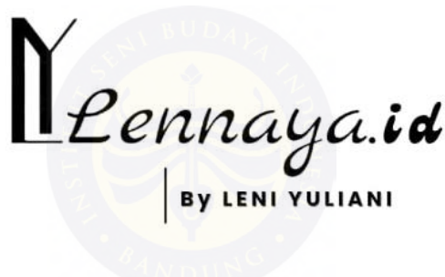
Gambar 5. 4 Logo Brand Lennaya.id

Nama brand dari karya ini adalah Lennaya.id disingkat LY. Kata ini berasal dari singkatan nama pengkarya. LY merupakan nama brand yang mempromosikan produk fashion dengan kategori ready to wear deluxe dan ready to wear . Warna hitam dan putih dipilih karena memberikan kesan netral dan elegan.