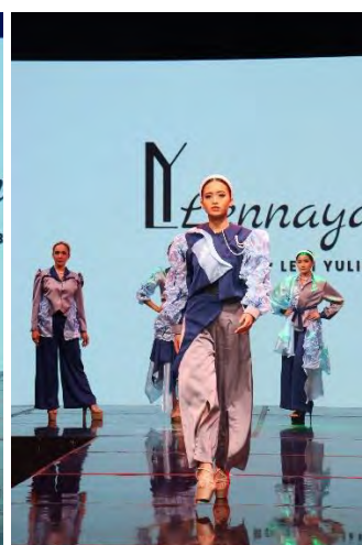
Gambar 5. 3 Hasil Foto Event BFR TVRI Jawa Barat 2025