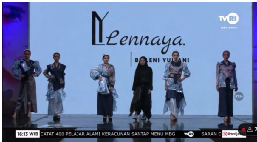
Gambar 5. 2 Video live Streaming Youtube BFR TVRI Jawa Barat 2025