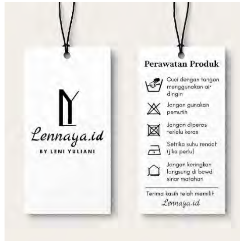
Gambar 5. 5 Desain Hangtag Brand Lennaya.id

Berikut adalah desain hangtag produk Lennaya.id: