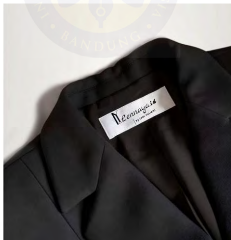
Gambar 5. 6 Label Brand Lennaya.id (Sumber: Leni Yuliani, 2025)

Label adalah media yang berisikan identitas produk, label sangat penting dalam suatu produk untuk memperkuat nama brand suatu produk. Berikut adalah label produk dari Lennaya.id: