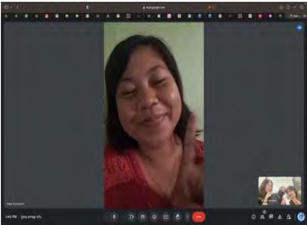
Gambar 70. Wawancara Perias Jenazah