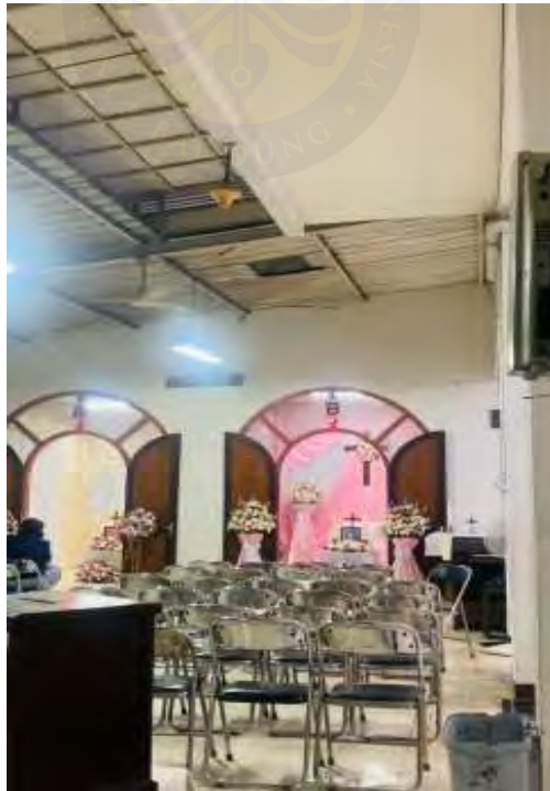
Gambar 67 Rumah Duka St. Borromeus