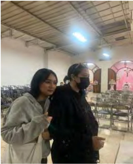
Gambar 68. Rumah Duka St. Borromeus