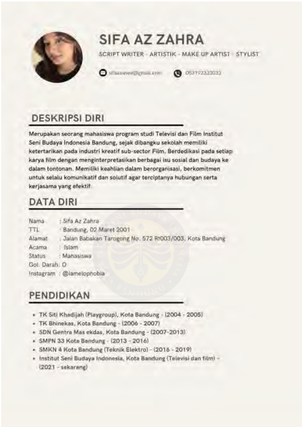
Gambar 63. Biodata Diri