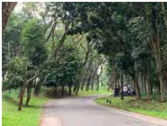
(Senin, 12 Mei 2025, 17.12 WIB)