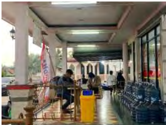
Gambar 4.4. Potret beberapa orang sedang nongkrong

Dokumentasi Penulis (Senin, 12 Mei 2025, 17.33 WIB)