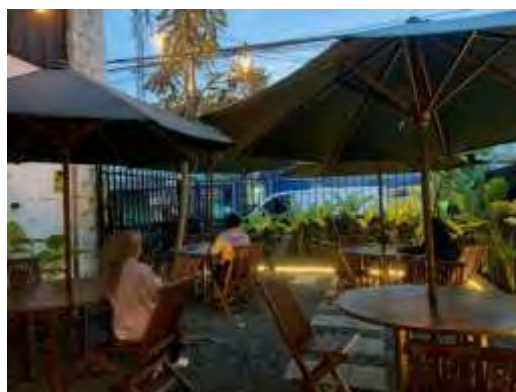
Gambar 4.10. Kondisi dalam Kojo Cafe

(Selasa, 6 Mei 2025, 17.41 WIB)