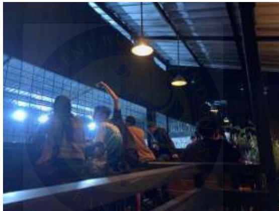
Gambar 4.9. Potret remaja yang sedang berpacaran dan nongkrong

(Senin, 12 Mei 2025, 21.01 WIB)