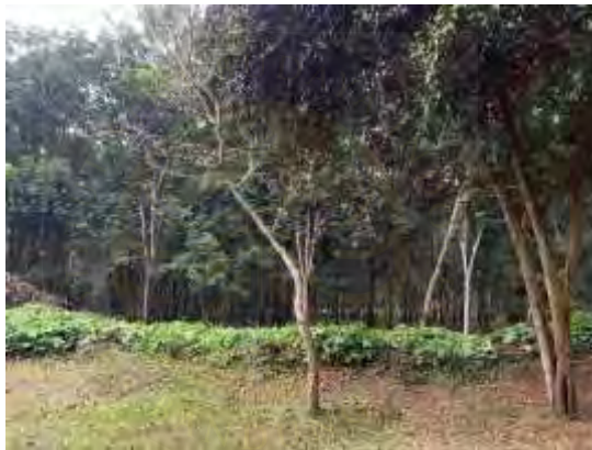
(Selasa, 6 Mei 2025. 17.16 WIB)