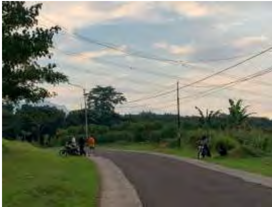
(Selasa, 6 Mei 2025. 17.14 WIB)