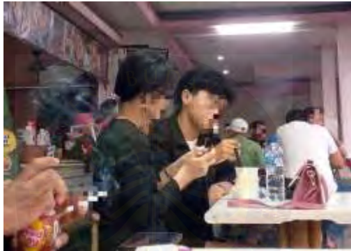
Gambar 4.3. Potret remaja berpacaran

Dokumentasi Penulis (Senin, 12 Mei 2025, 18.27 WIB)