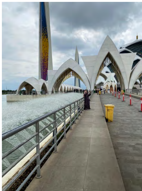
Gambar 4. 8 Danau Buatan Masjid Raya Al-Jabbar

Selain bangunan utama, pengunjung juga memberikan perhatian pada lingkungan sekitar masjid yang tertata rapi dan bersih. Ruang terbuka hijau, taman, dan jalur pejalan kaki menjadi pelengkap yang mendukung suasana nyaman dan menenangkan. Banyak dari responden menyatakan bahwa suasana lingkungan masjid memberikan kesan damai, cocok untuk kontemplasi maupun rekreasi spiritual, sehingga menjadi alasan tambahan bagi mereka untuk mengambil foto.