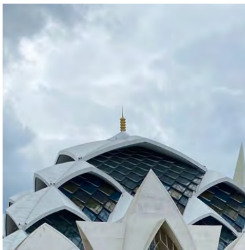
Gambar 4. 3 Makara Masjid Raya Al-Jabbar

Relung di dalam masjid berjumlah 27 merepresentasikan jumlah kota dan kabupaten yang dimiliki oleh provinsi Jawa Barat. Makara yang berada di bagian puncak masjid raya al-jabbar dengan bentuk seperti tusuk sate memiliki kesamaan dengan bentuk pada kantor gubernur Jawa Barat dengan merepresentasikan lima rukun islam.