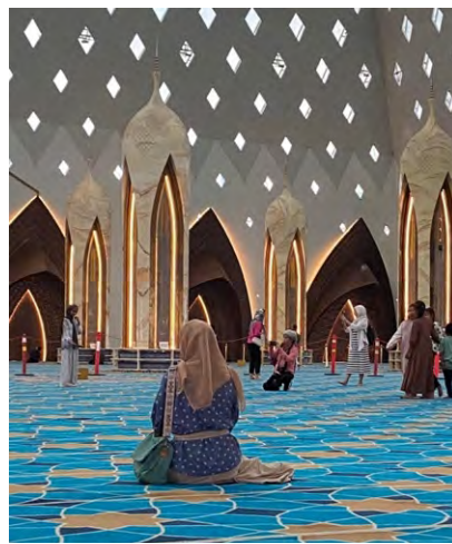
Gambar 4. 7 Aktivitas Selfie di Area Dalam Masjid Raya Al-Jabbar

Aktivitas di dalam masjid yang menjadi salah satu utama atas pemahaman perilaku yang kurang pantas dikarenakan ada sebagian orang yang sedang beribadah, tetapi disisi lain alasan tersebut jika disandingkan bersamaan dengan tindakan lainnya yang mengganggu beribadah didalam masjid yang bersamaan dengan pengunjung yang melakukan aktivitas selfie.