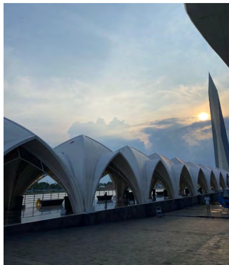
Gambar 4. 1 Koridor Masjid Raya Al-Jabbar

Sa'i berjalan kaki dari Bukit Safa ke Bukit Marwah (Tia Mutiawati, Pengunjung). Hal ini juga sesuai dengan luas masjid raya al-jabbar yang diperkirakan memiliki kapasitas area dalam 35.000 dengan shaf yang rapi, tetapi area luar kurang lebih 45.000 dan ini bisa lebih lebih banyak memuat banyak jamaah.