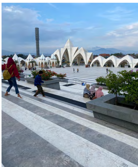
Gambar 4. 5 Pengunjung Menikmati Suasana Masjid Raya Al-Jabbar

ini dilakukan secara santai, dan selfie menjadi bagian dari aktivitas sosial tersebut. Selfie yang diambil dalam konteks ini lebih santai dan ekspresif, mencerminkan identitas sosial masing-masing pengunjung