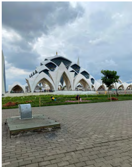
Gambar 4. 6 Area terbuka Masjid Raya Al-Jabbar

salah satu area terbuka hijau yang disediakan oleh masjid raya al-jabbar dijadikan sebagai tempat untuk aktivitas selfie