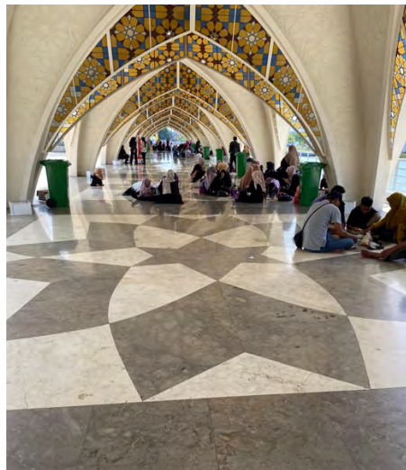
Gambar 4. 4 Kebersamaan Pengunjung dikoridor Masjid Raya Al-Jabbar

Sehingga hal ini juga menjadikan pihak pengelola memberikan ruang untuk kebersamaan pengunjung salah satunya dengan menyediakan koridor di sepanjang sisi Masjid Raya Al-jabbar yang merupakan fasilitas umum bagi pengunjung untuk berkumpul. Umumnya pengunjung menjadikan koridor tersebut sebagai tempat bersantai, beristirahat maupun makan bersama.