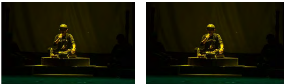
Gambar 6. Proses Gladi Kotor Pertunjukan