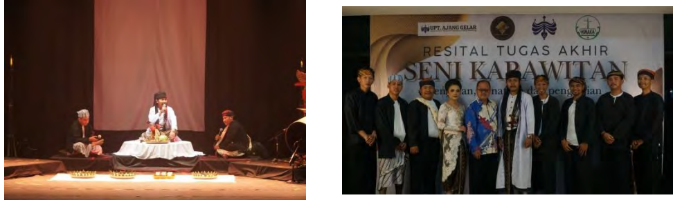
Gambar 7. Pelaksanaan Tugas Akhir Adarmajap