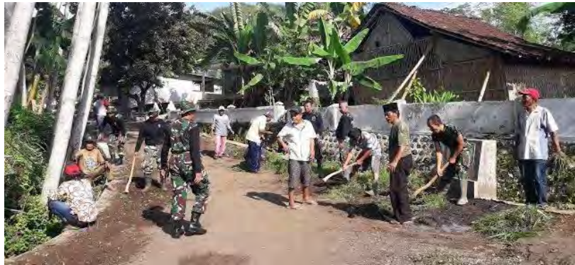
Gambar 4. 3 Gotong Royong

tentang menyelesaikan pekerjaan secara bersama-sama, tetapi sekaligus mempererat hubungan masyarakat.