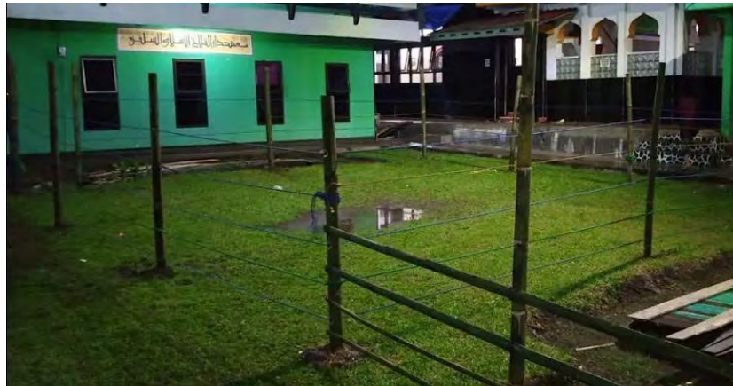
Gambar 4. 9 Kalang (Ring)