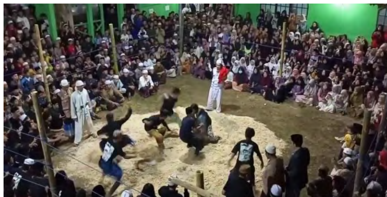
Gambar 4. 12 Pelaksanaan Tradisi Jeblog

Tepat pada tanggal 12 Mulud malam, sebelum dilakukan ritual ngadu ilmu selalu dilaksanakan tabligh akbar untuk memperingati Maulid Nabi Muhammad SAW. Dalam hal ini, berbagai kalangan masyarakat menyaksikan tausiyah dan beberapa rangkaian acara lainnya, mulai dari anak-anak, remaja, orang tua, lansia, para santri ataupun bukan berbondong-bondong untuk menyaksikan tabligh akbar dan ritual ngadu ilmu.