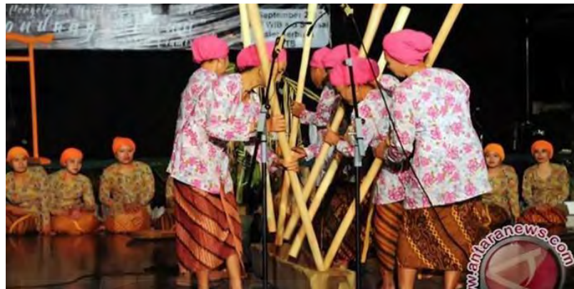
Gambar 4. 5 Kesenian Tutunggulan

Bunyi "Dung" dihasilkan dari pukulan antara halu dan bagian dalam pamoroyan. Dan, "Prek" dihasilkan dari benturan halu dalam posisi silang.