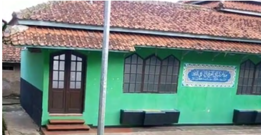
Gambar 4. 7 Madrasah Darul Falah