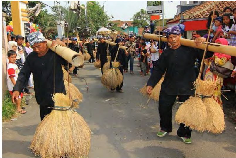
Gambar 4. 6 Kesenian Rengkong Warungkondang