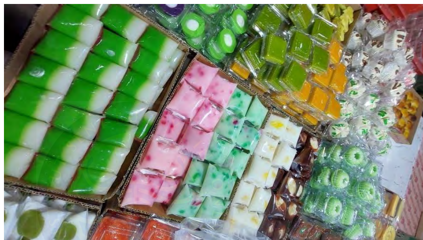
Gambar 4. 8 Hidangan Tradisi Jeblag

Sebelum dan sesudah berlangsungnya tradisi jeblag biasanya dilakukan makan-makan sebagai rasa syukur atas nikmat yang diberikan oleh Allah SWT.