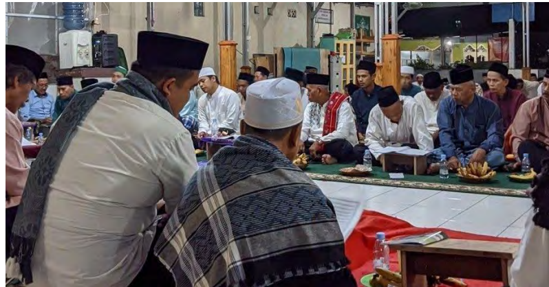
Gambar 4. 4 Tawasul

energi-energi positif yang terus mengalir di lingkungan masyarakat.