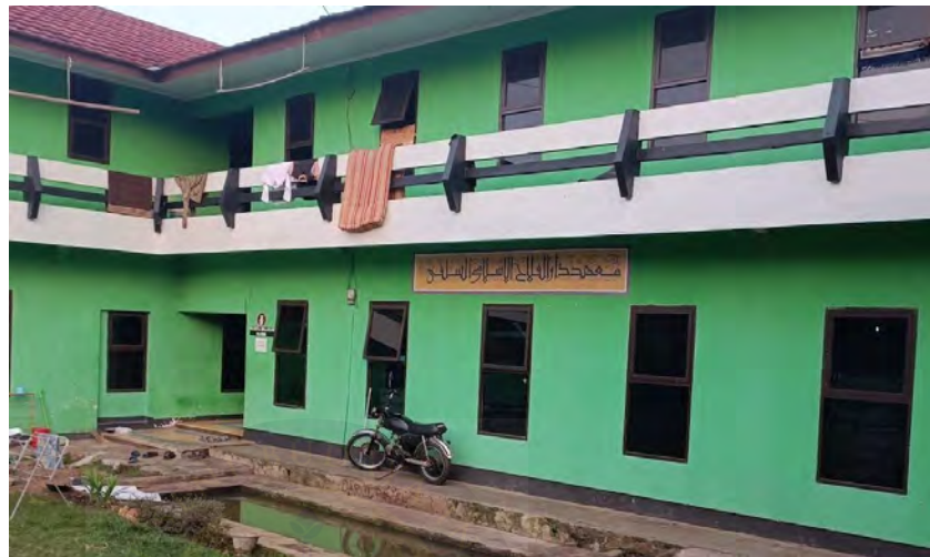
Gambar 4. 1 Pesantren Darul Falah Desa Jambudipa Kecamatan Warungkondang Kabupaten Cianjur

Pada tahun 1978, masing-masing dilebur menjadi satu gedung yang diberi nama Asrama Darul Falah. Hingga saat ini, asrama tersebut menjadi salah satu pesantren tertua di Jawa Barat.