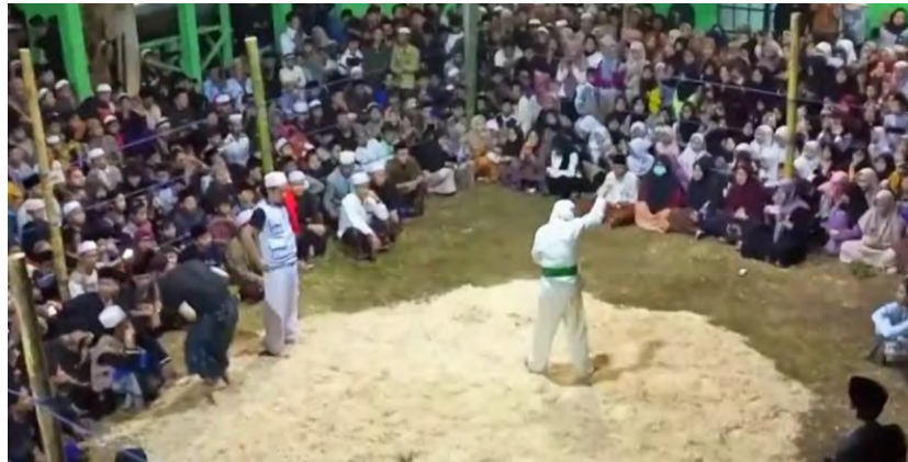
Gambar 4. 10 Lapang Tradisi Jeblag

para pemain jeblag dan penonton. Lapangan ini berukuran kurang lebih 25 m x 25 m.