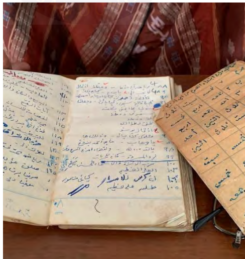
Gambar 4. 11 Mantra atau Jampe