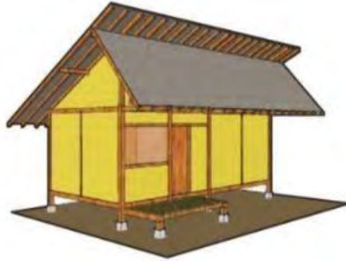
Gambar 2. 2. Sketsa Atap Tagog Anjing