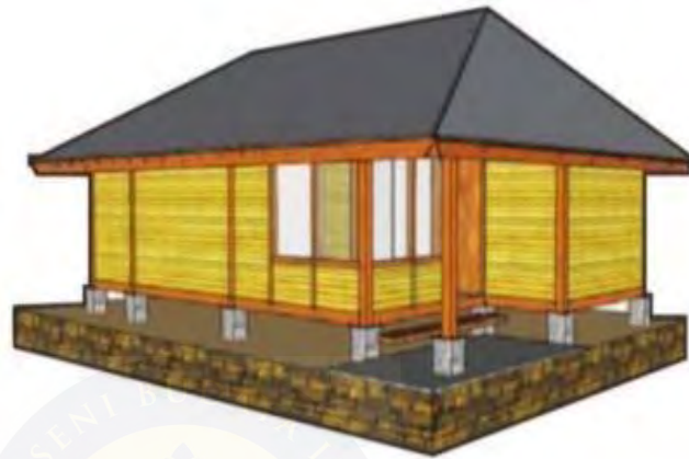
Gambar 2. 4. Sketsa Atap Perahu Nangkub

Desain atap bangunan rumah ini menyerupai perahu yang terbalik (telungkup) dan memiliki kemiripan dengan model atap limasan.