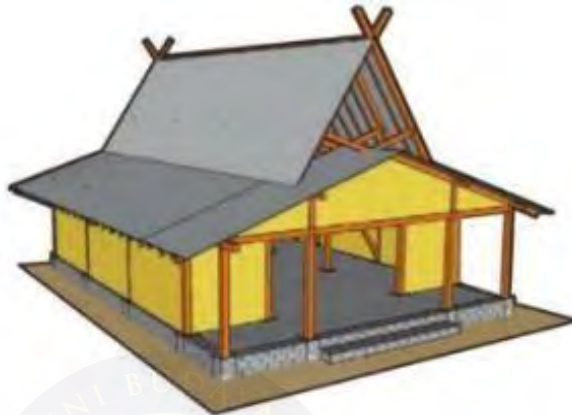
Gambar 2. 6. Sketsa Atap Julang Ngapak