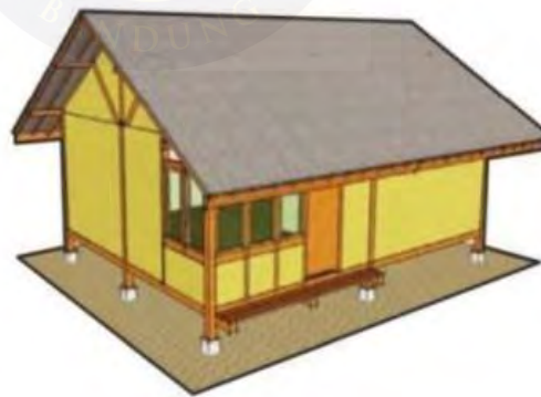
Gambar 2. 1. Sketsa Atap Jolopong)

Sumber: Anwar dan Nugraha dalam Buku Rumah Etnik Sunda)