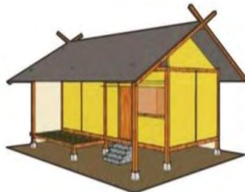
Gambar 2. 5. Sketsa Atap Capit Gunting