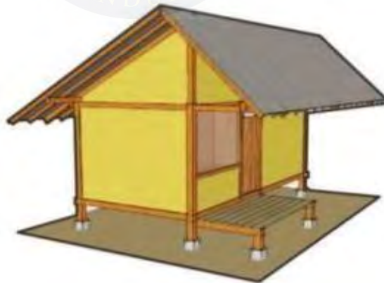
Gambar 2. 3. Sketsa Atap Badak Heuay